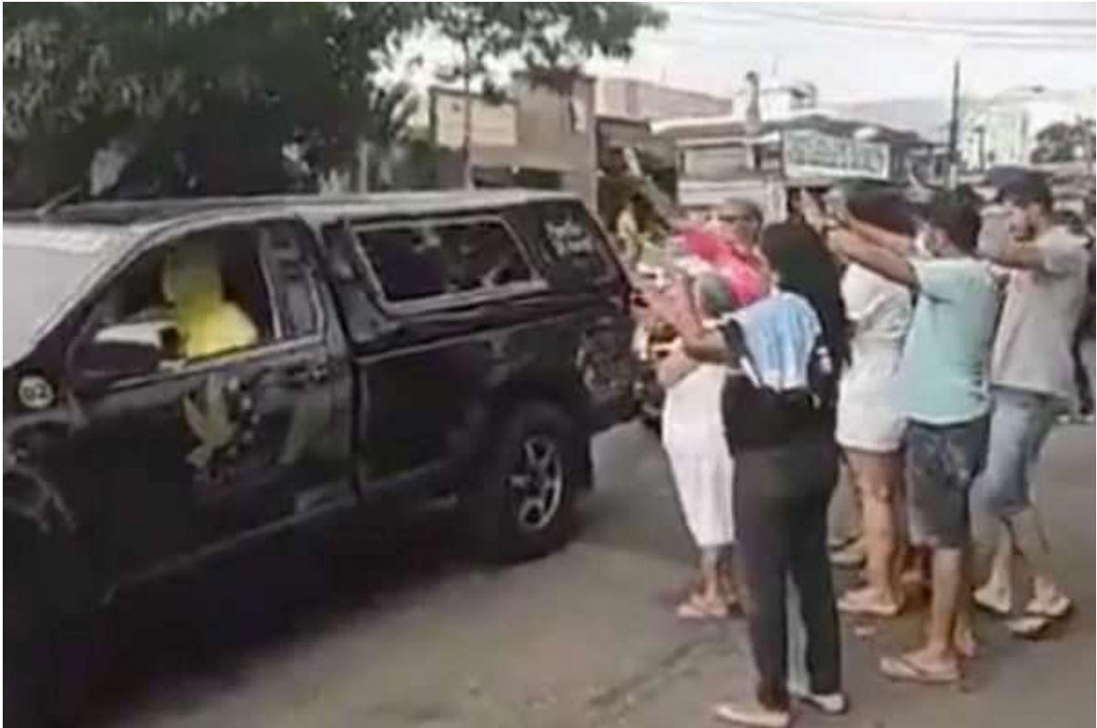
Figura 2 – “Covid-19: carro funerário vai até mãe de vítima para último adeus”