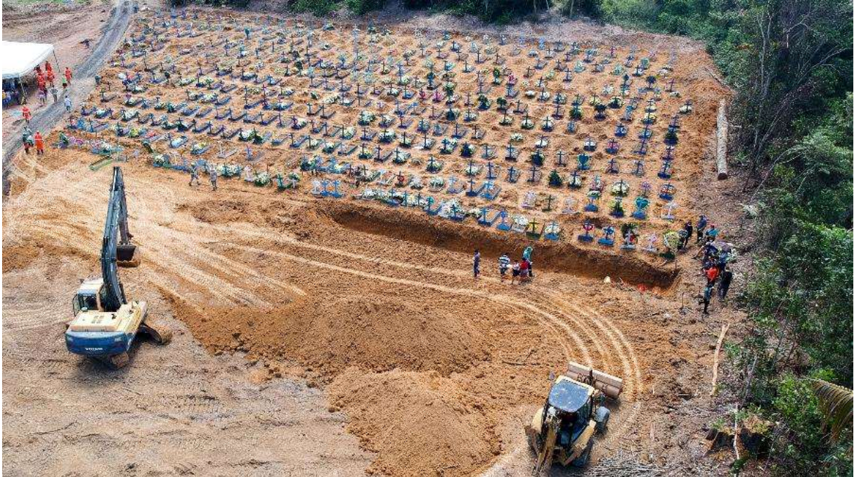
Figura 3 – “Após boom em enterros, Manaus abre covas coletivas para vítimas de Covid-19”

ritual ocasionada pelo vírus (Vicente da Silva, 2020). Aqui podemos enxergar o caráter de “desindividualização” da pandemia (figura 3).