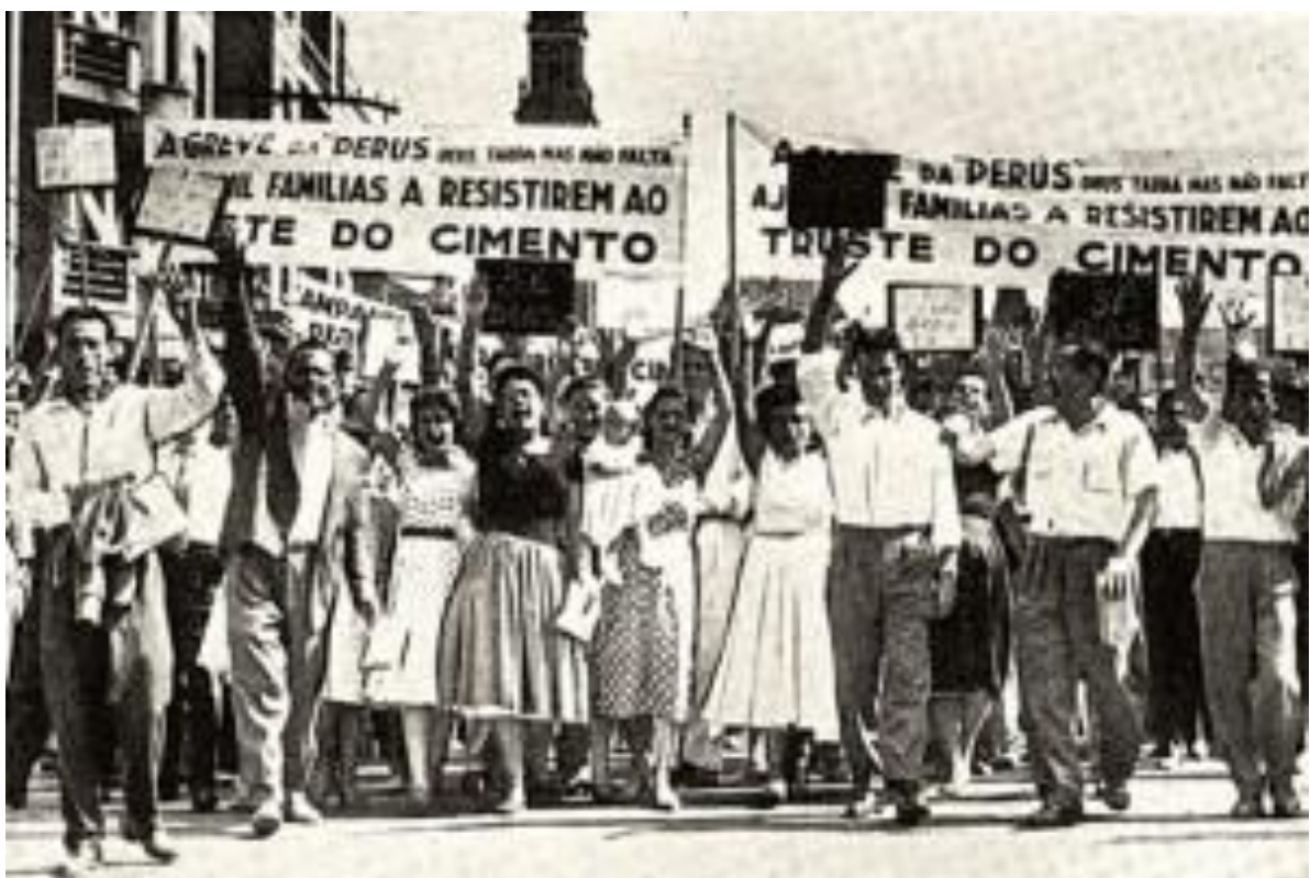
“Créditos: Acervo Greve dos Queixadas “Esposas dos Queixadas fazendo piquete em frente à Pedreira em Cajamar” 1962 – Sindicato dos Trabalhadores nas Indústrias de Cimento, Cal e Gesso de São Paulo.