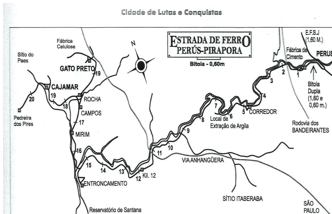
Mapa geral da ferrovia, adaptado do mapa da revista japonesa Steam Locomotives , nº 7 (1972), por Nilson Rodrigues. As principais estações e pátios estão destacadas em cor laranja.

Todas as famílias se uniram junto com a comunidade e igreja católica e sindicato e moradores do bairro de Perus, todos viviam em Perus, respirava de todas as formas o cimento naquele bairro. Todo o bairro dependia dessa matéria – prima, direta ou indiretamente da fábrica.