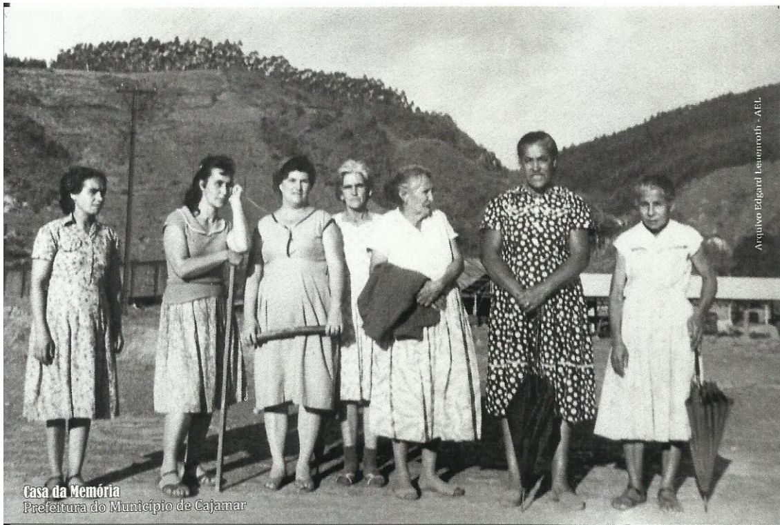
“Créditos: Acervo da greve dos Queixadas “Esposas dos Queixadas fazendo piquete em frente à Pedreira em Cajamar” 1962 – Casa da Memória Prefeitura do Município de Cajamar.