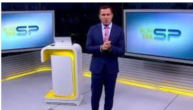
Figura 3. Bom Dia São Paulo/ Rodrigo Bocardi.

Por último, cabe salientar, como se pode observar na imagem abaixo, uma mudança no formato da apresentação e no próprio cenário do noticiário. A bancada foi substituída por uma quase imperceptível, e os jornalistas apresentam o telejornal em pé, caminhado de um lado para o outro e interagido entre eles, o que assinala um maior envolvimento , interação e intimidade com o telespectador.