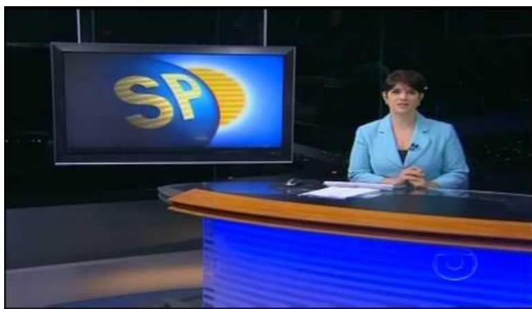
Figura 2. Bom dia São Paulo/ Mariana Godoy. 16/07/2009.

O trecho em destaque foi selecionado com o objetivo de ilustrar e analisar, de forma cronológica, as transformações e as modificações no discurso dos apresentadores do Bom Dia São Paulo ao longo dos anos. Optou-se por um trecho em que a jornalista Mariana Godoy é a apresentadora, em função da notoriedade que a jornalista conquistou durante o tempo em que conduziu o noticiário, entre 2001 e 2010. No que diz respeito ao formato da apresentação, como se pode observar na imagem a seguir, nota-se que a apresentadora enuncia as notícias sentada, a partir de uma bancada, seguindo uma linha de apresentação formal, comum para os noticiários da época.