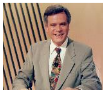
Chico Pinheiro.

No que diz respeito às transformações no formato e no modo de apresentar as notícias, o Bom Dia São Paulo foi um dos primeiros telejornais da Rede Globo a utilizar o editorial, a promover campanhas semanais sobre questões de interesse da comunidade – como a falta d'água ou o transporte ineficiente nos bairros da periferia – e a manter uma agenda dos principais acontecimentos em Brasília. Além das notícias nacionais, o noticiário contava com correspondentes no exterior, que cobriam os principais acontecimentos no mundo.