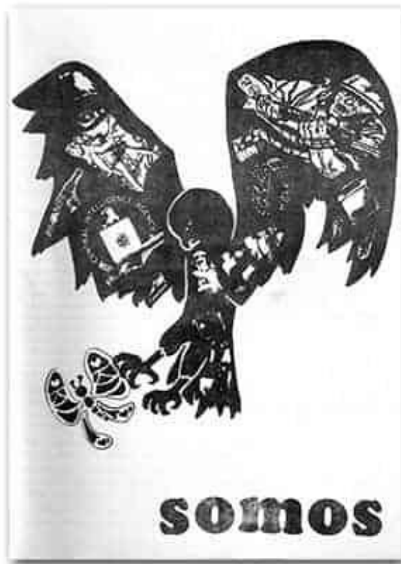
Fanzine da Frente de Liberación Homosexual Argentina