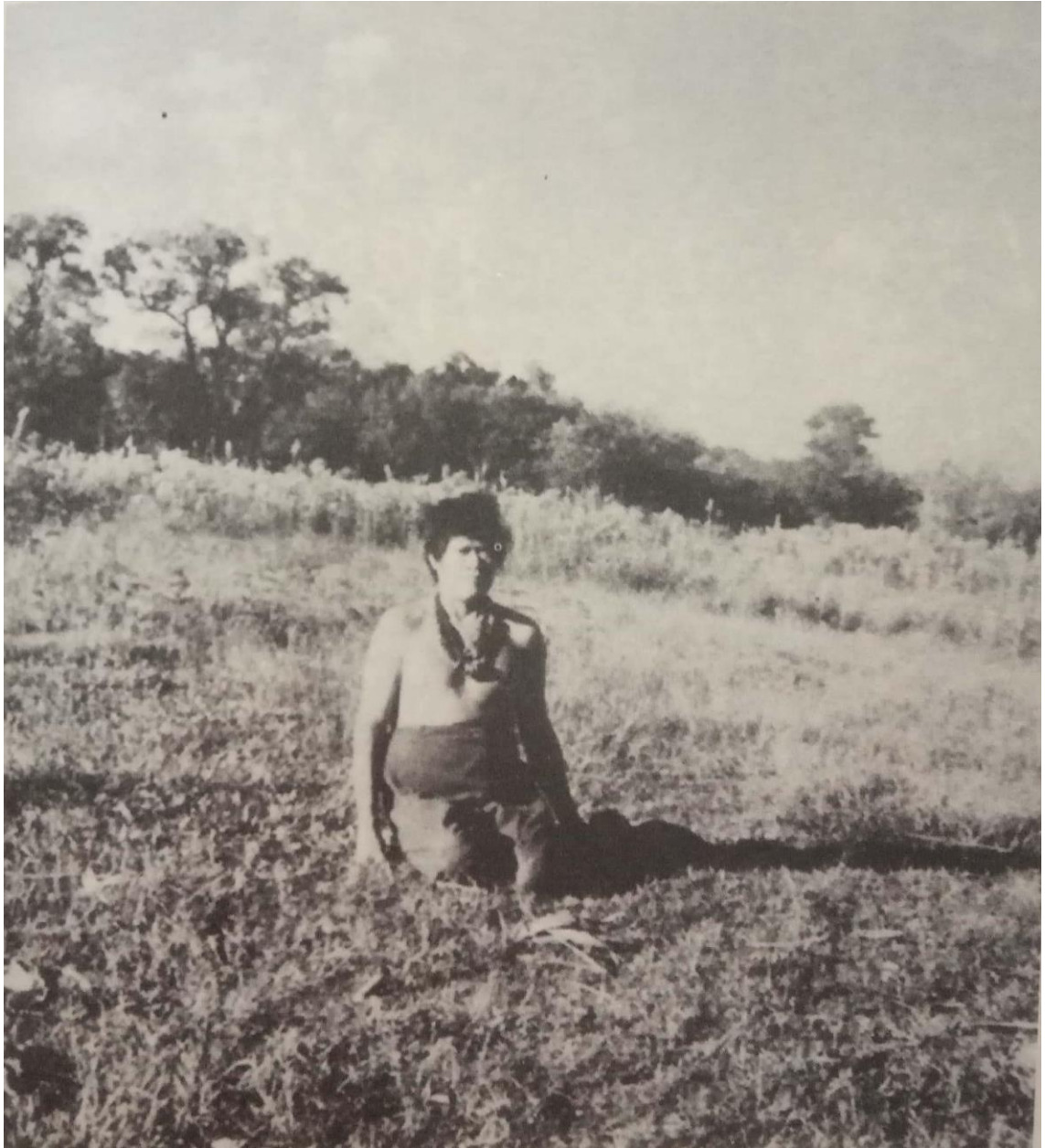
Krebemgi (CLASTRES, 2020, p. 272)