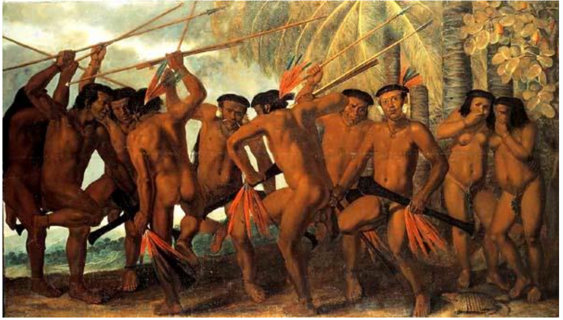
Dança dos Tapuia , de Albert Eckhout, 1641-1644