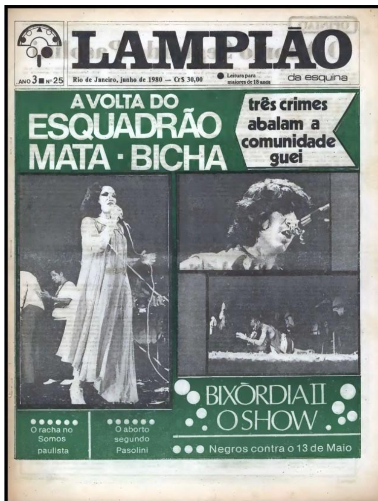
Edição de junho de 1980 do jornal Lampião da esquina

Esse conjunto de práticas mostrava como a união de setores descontínuos dos chamados movimentos sociais encontravam na resistência a opressão das práticas policiais um lugar comum de luta que possibilitasse uma unificação, mesmo que passageira e incipiente. Chama a atenção é que frente a esse momento político de represália, uma infinidade de direitos passa a ser reivindicado por tais grupos, em especial na segunda metade dos anos 1980 e início dos anos 1990.