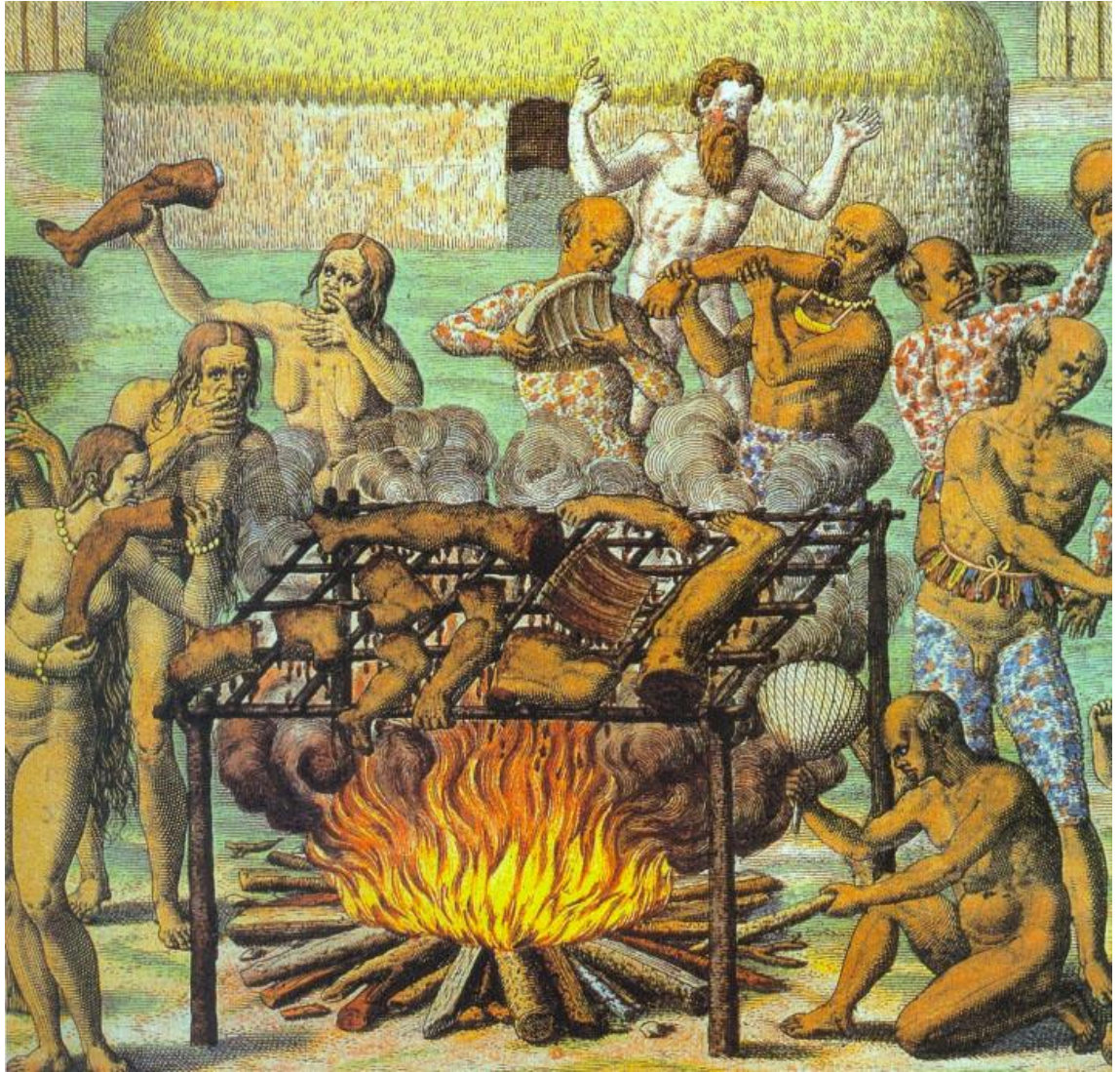
Theodor de Bry, Cena de canibalismo , a partir de "Americae Tertia Pars", 1592.