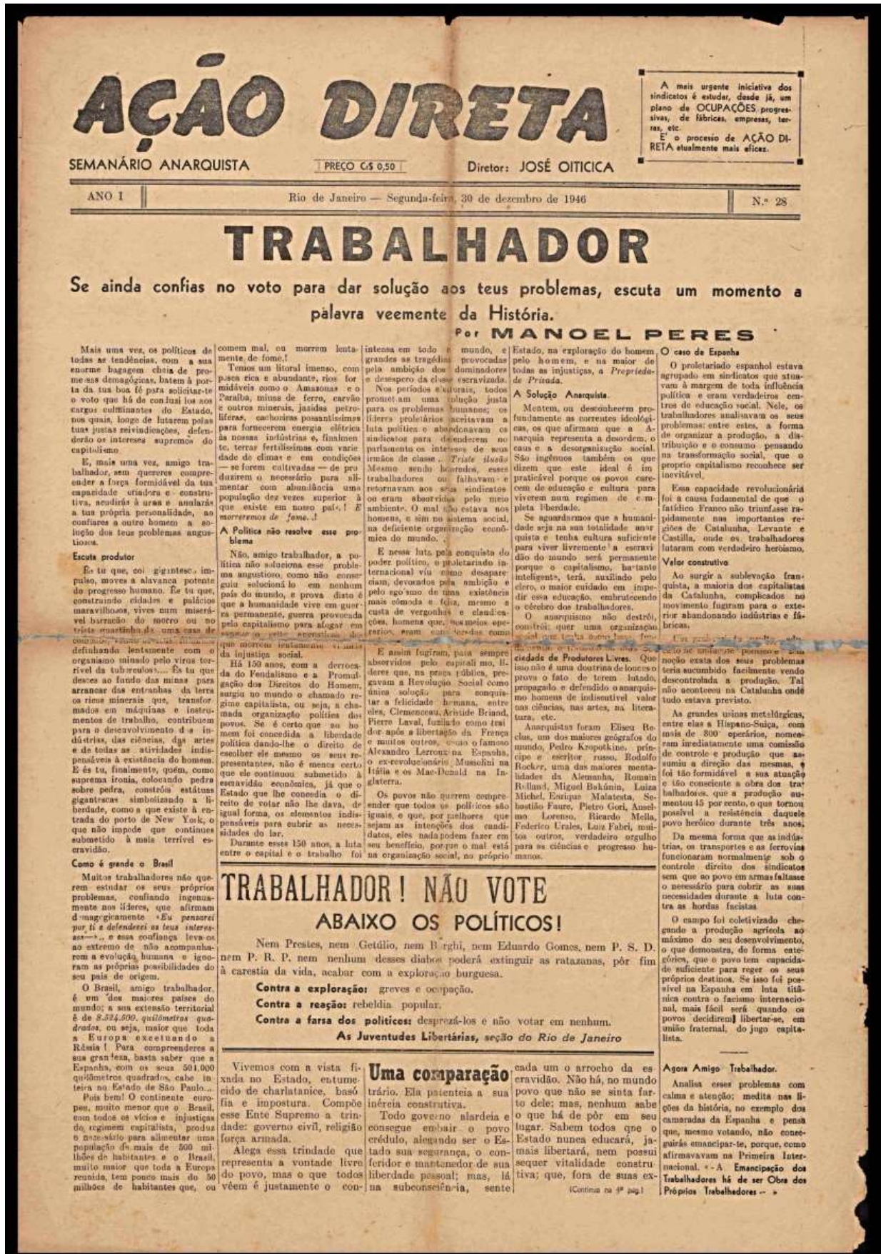
Figura 17 - Número do jornal Ação Direta que defende o absentismo eleitoral.