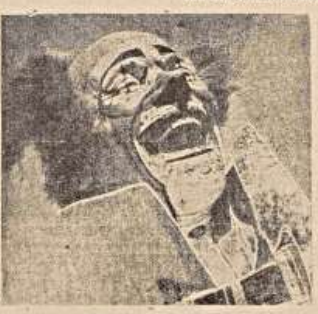
Que tal trabalhador!