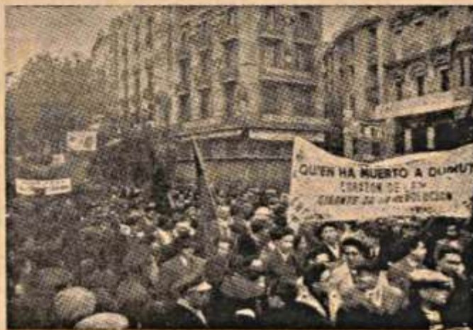
Aspecto do enterro de Durruti em Madrid

dos elementos da C. N. T., Durruti, sentando a filhinha no colo, exclamava com orgulho: Esta será anarquista como su padre.