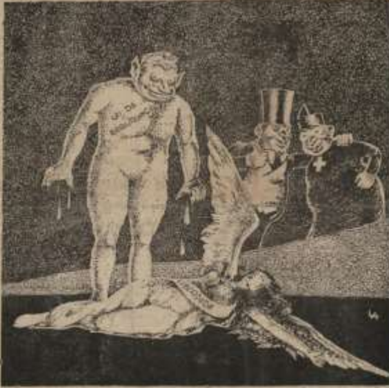
O conluio reacionário preparou o monstro para o sacrifício da Liberdade