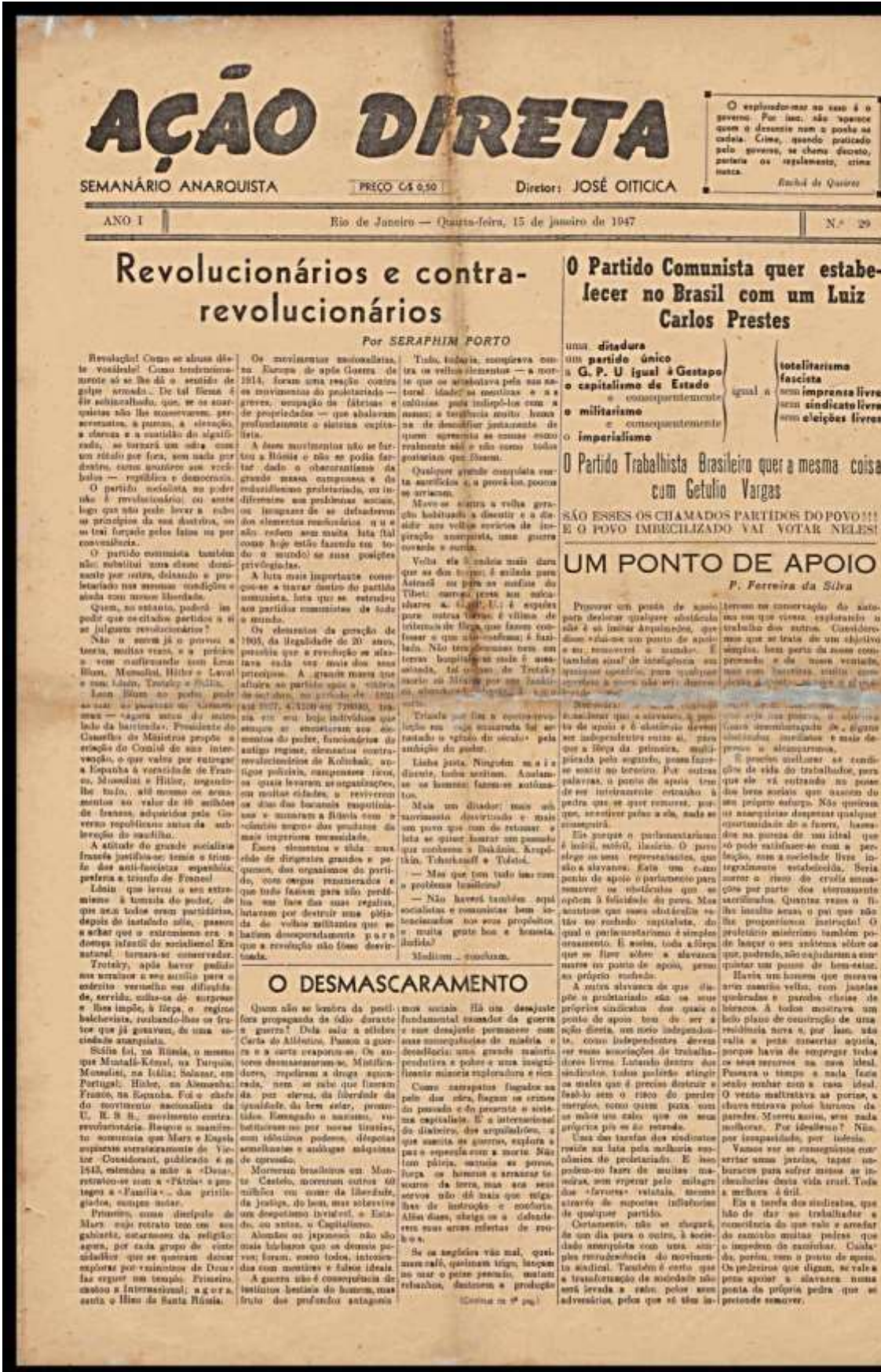
Figura 10 - Artigo do jornal Ação Direta criticando Prestes e os comunistas.