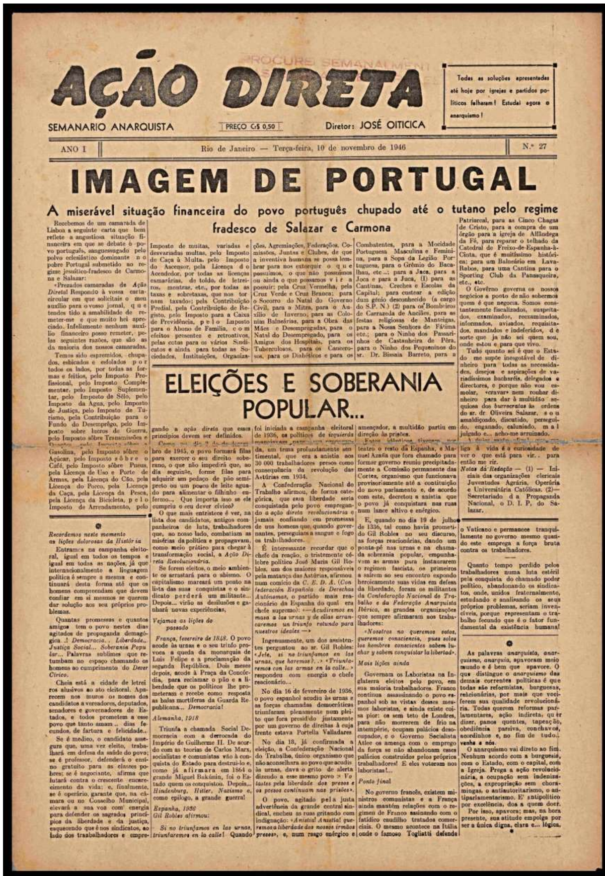
Figura 13 - Artigo do jornal Ação Direta questionando a soberania popular.

AÇÃO DIRETA SEMANARIO ANARQUISTA PREÇO: Cr$ 0,50 Diretor: JOSÉ OITICICA