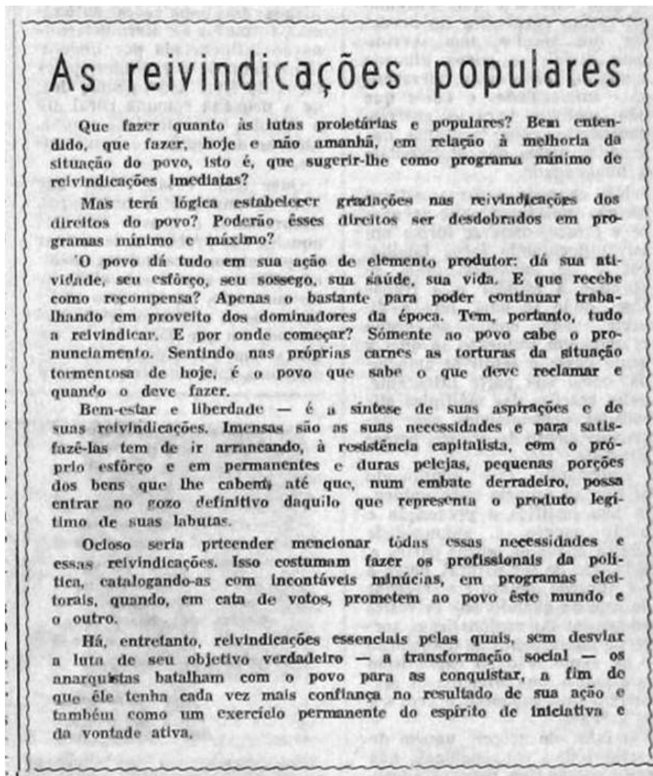
Figura 3 - Detalhe de A Plebe nº 1 sobre as lutas populares