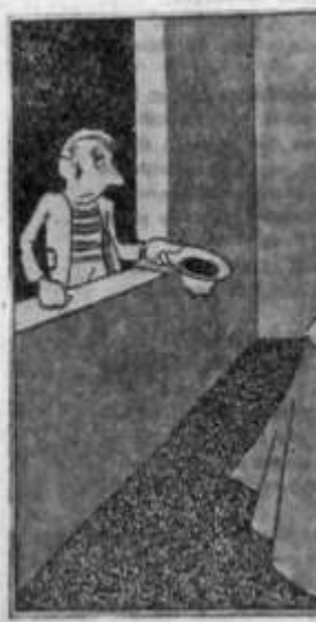
São assim os tiranos e explora

ENDERECO DE "A PLEBE" A correspondência para "A Plebe" deve ser enviada para o seguinte endereço: "A PLEBE" — CAIXA POSTAL, 5739 — SÃO PAULO. Vales postais, cartas registradas com valor declarado — ou cheques bancários devem vir para o mesmo endereço em nome de Edgard Leuenroth.