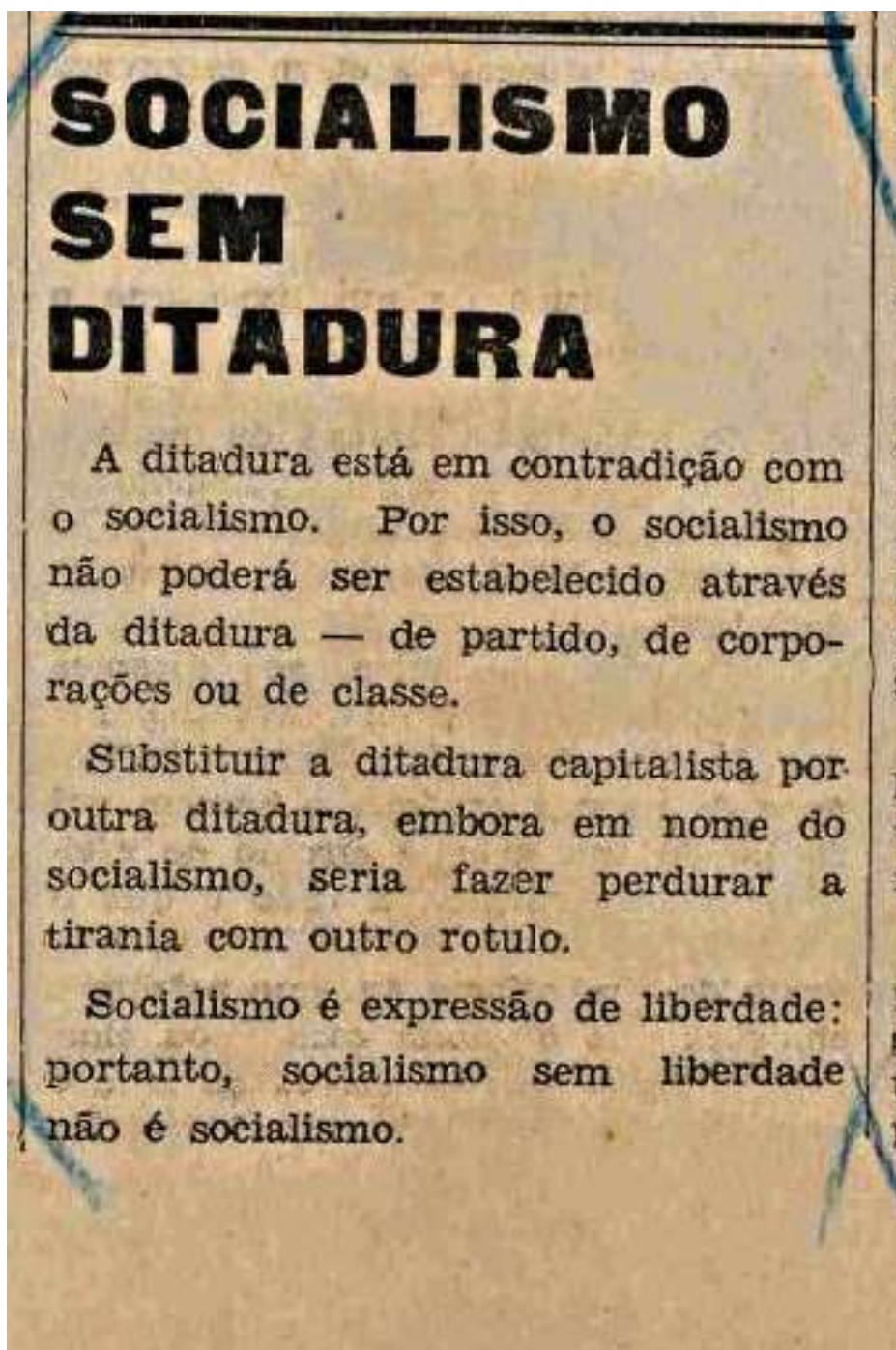
Figura 28 – Detalhe de nota sobre o socialismo.