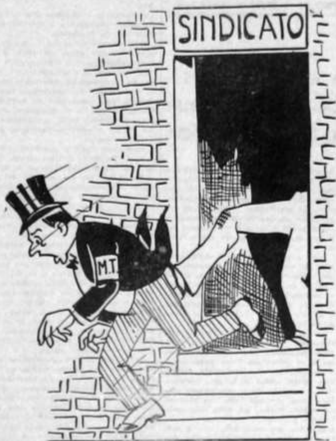
Somente assim os sindicatos voltarão a expressar a vontade do proletariado.

Baseada na lição de um longo período de experiências, feitas em toda a parte onde o proletariado tem desenvolvido atividade em prol de seus direitos, demonstrando que