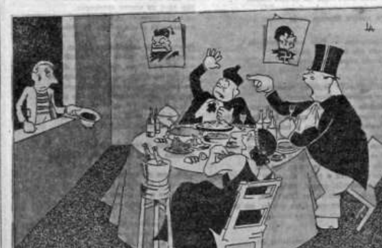
São assim os tiranos e exploradores do povo. Recordam-se com o apreço de sua vítima