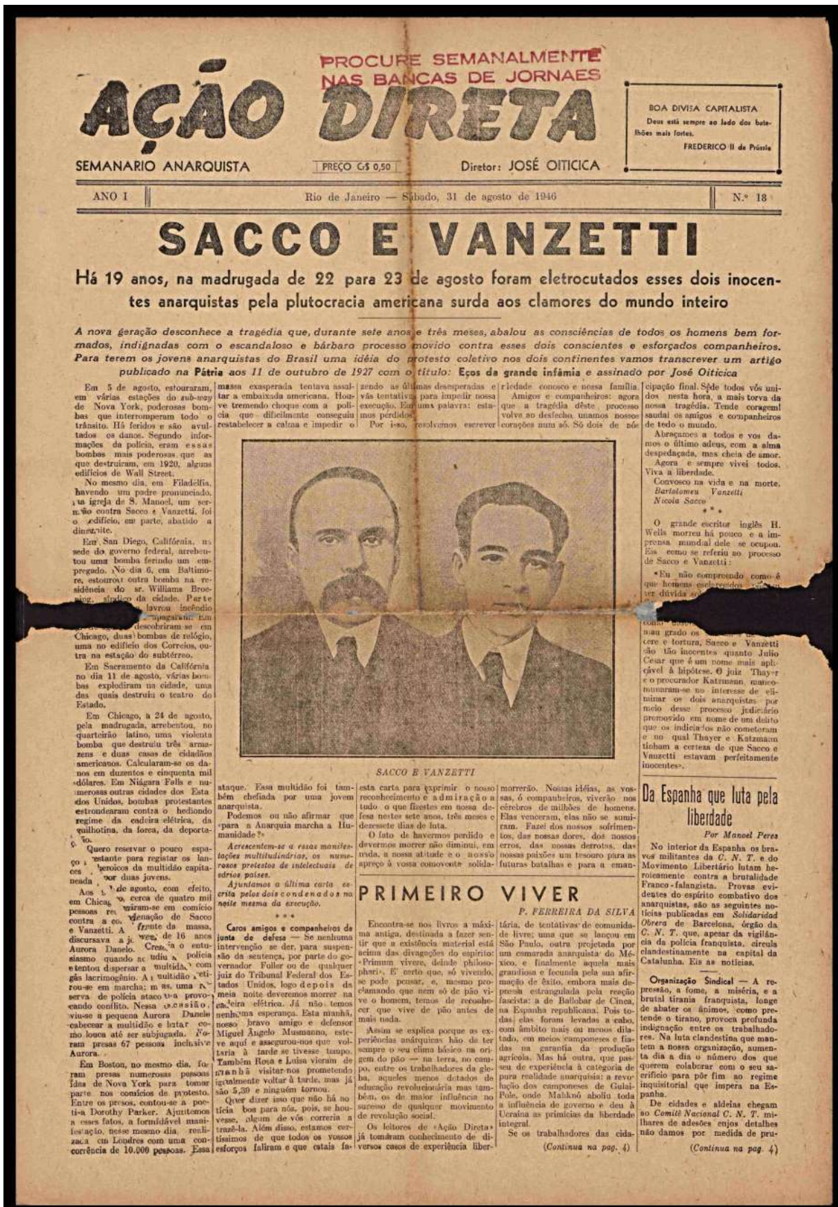
Figura 4 - Matéria de capa sobre o caso 'Sacco e Vanzetti'.