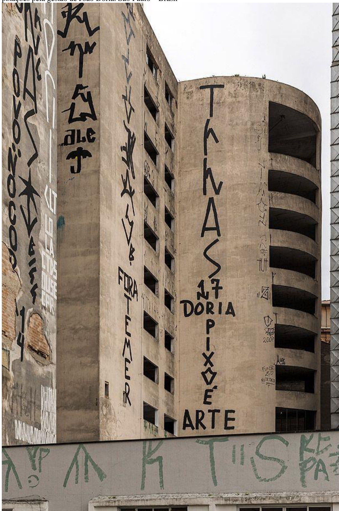
Imagem 28 – Dória o pixo é arte - Pixação contra a cobertura cinza e o apagamento dos graffitis e pixações pela gestão de João Dória. São Paulo – Brasil