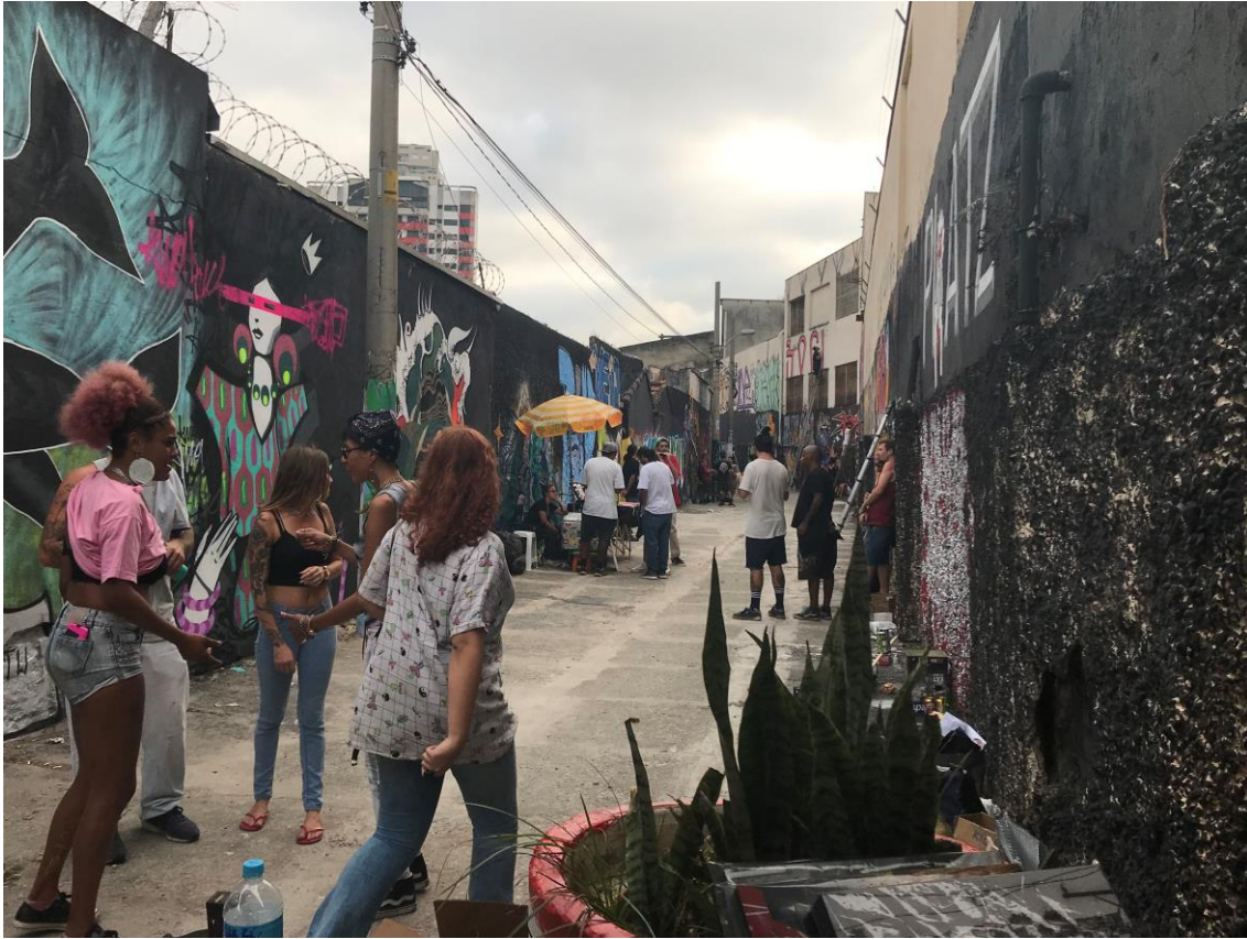
Imagem 2 - Evento 1 Lapa frente – Sociabilidade. Revitalização do Beco Bartolomeu Belli; comemoração 10 anos do macaco Yoko. São Paulo – Brasil