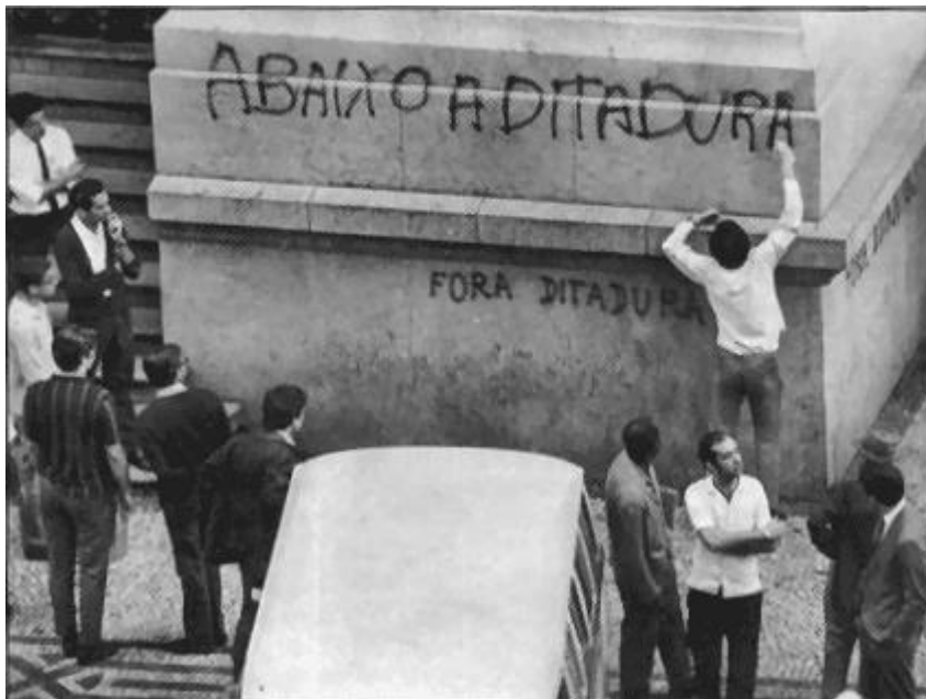
Imagem 31 – Abaixo a Ditadura. Rio de Janeiro - Brasil