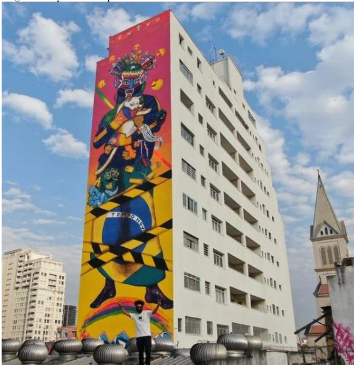
Imagem 7 - Empena realizada para o Na Lata Festival. São Paulo - Brasil