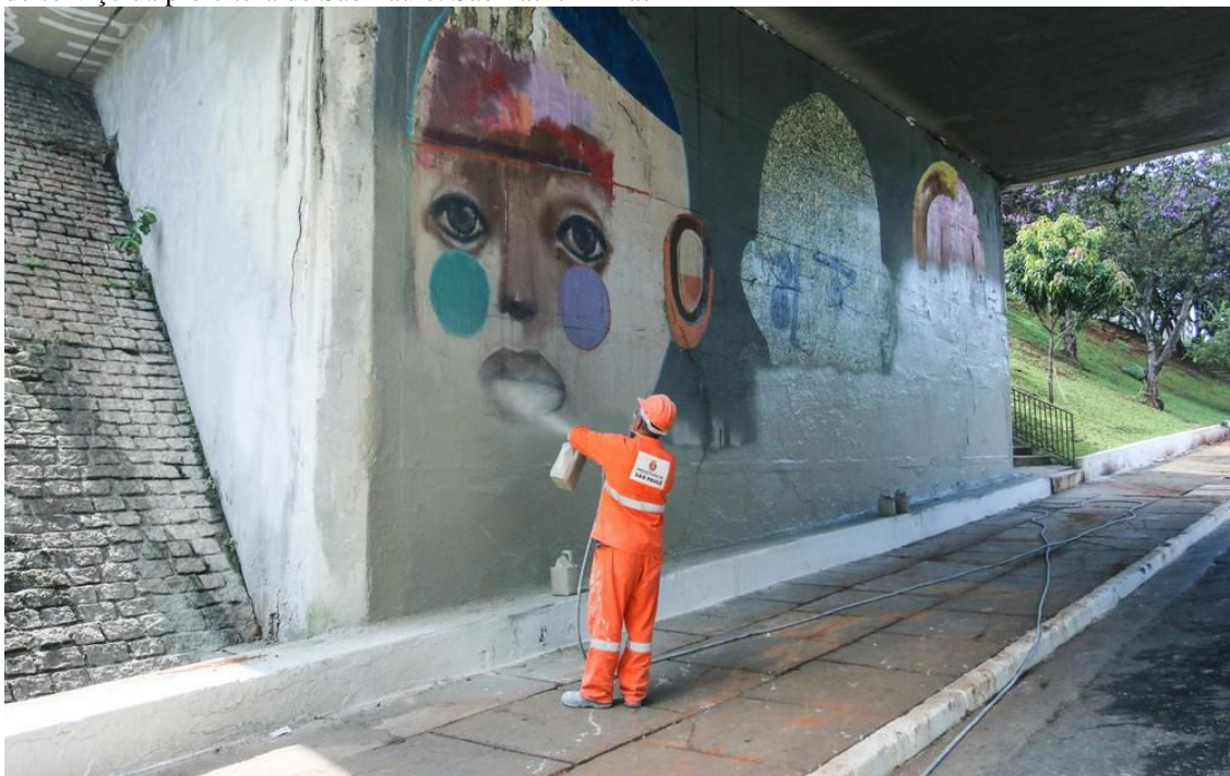
Imagem 25 – Cobertura cinza, para o apagamento dos graffitis da avenida 23 de maio, por prestadores de serviço da prefeitura de São Paulo. São Paulo – Brasil