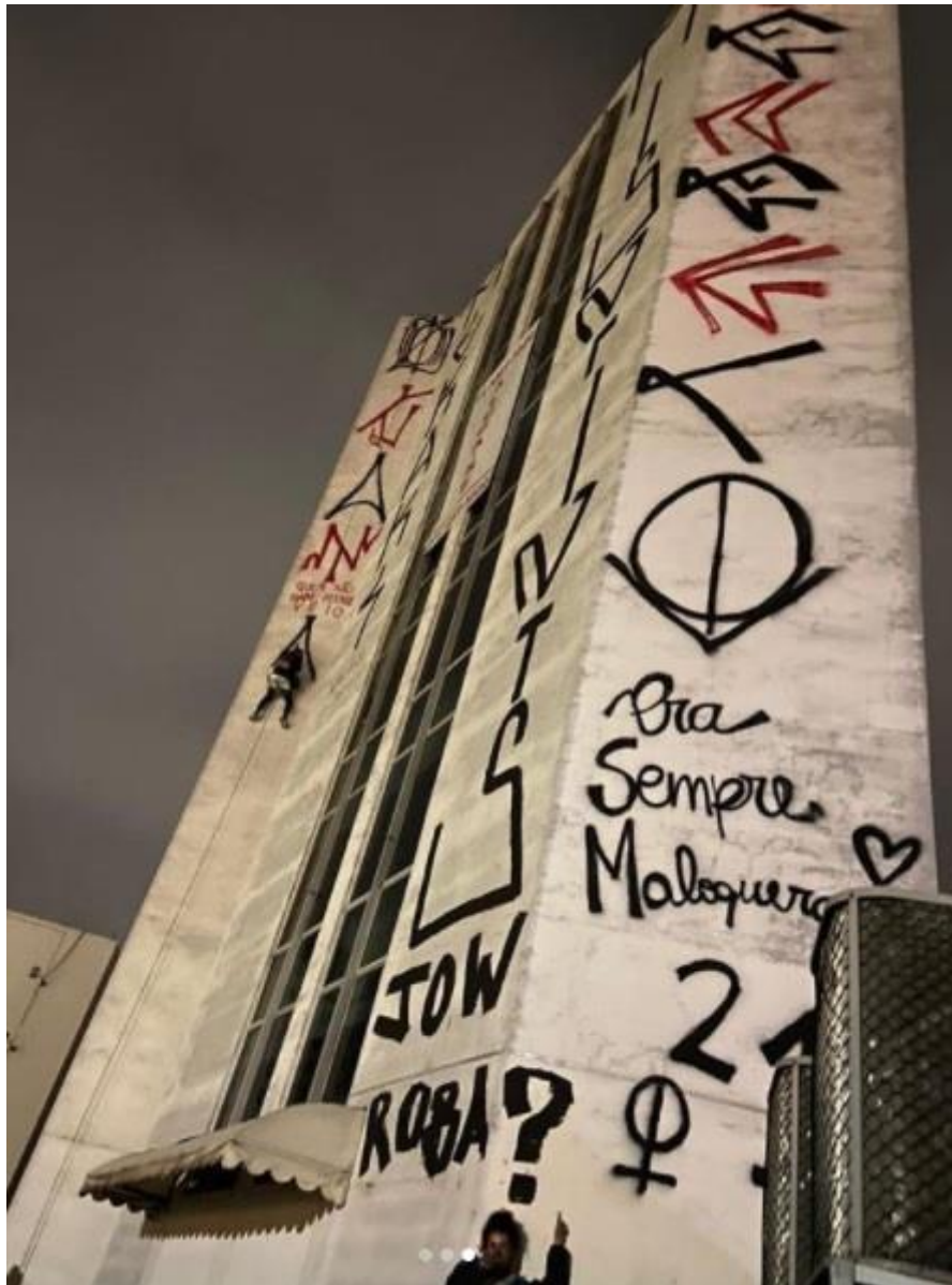
Imagem 44 – Pixadora Eneri, junto ao seu pixo seguido da inscrição Pra sempre maloqueira e o símbolo do feminino. São Paulo – Brasil