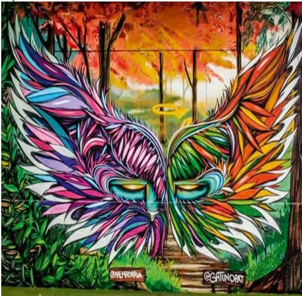
Imagem 39 - Graffiti do artista Gattuno, na fachada da galeria Alma da Rua; Vila Madalena – Devido a esse graffiti ser um cenário muito procurado no Beco do Batman para fotos, existe uma caixinha para contribuição livre e colaborativa com a Galeria Alma da Rua. São Paulo – Brasil