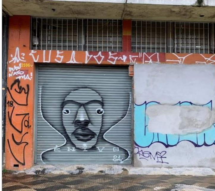
Imagem 6 – Graffiti rápido, sem muita elaboração. São Paulo - Brasil

Fonte: Instagram do artista Enivo Disponível em: https://www.instagram.com/p/CNNCSXHDsPB/ . Acesso em: 20 mar. 2021