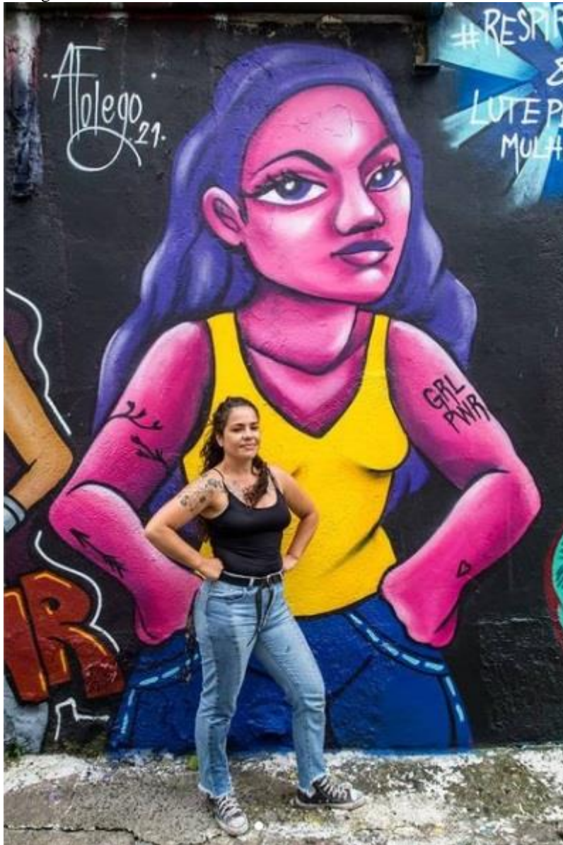
Imagem 16 – Afolego - Girl Power. São Paulo – Brasil