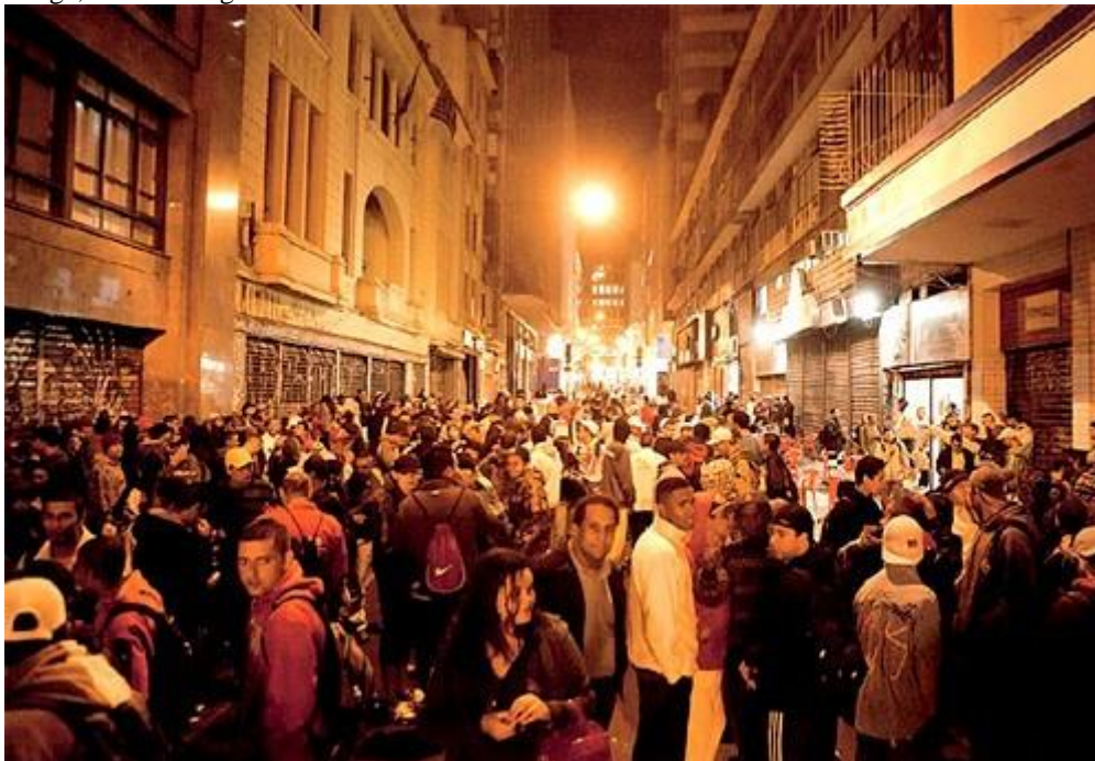
Imagem 35 – Point da pixação, da região central – Encontro às quintas-feiras, rua Barão de Itapetininga, ao lado da galeria Olido. São Paulo – Brasil