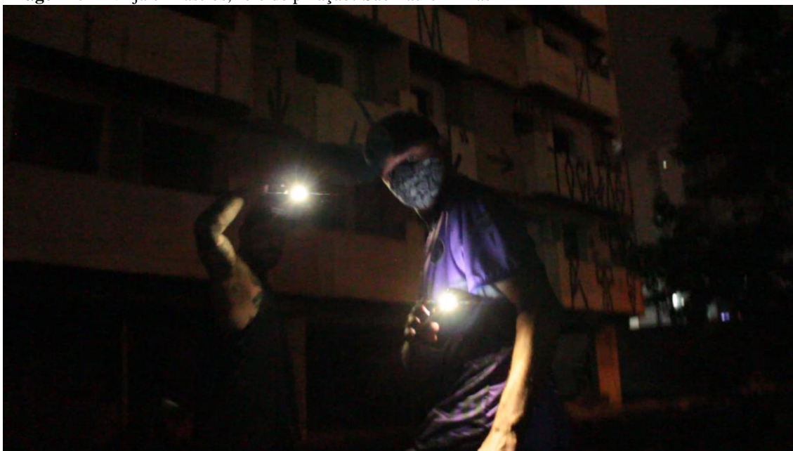
Imagem 5 – Ninja e Alastros, role de pixação. São Paulo – Brasil