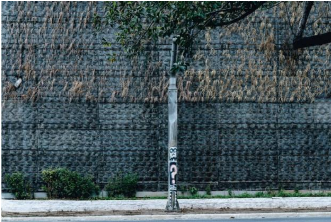
Imagem 26 – Mural verde, projetado pela gestão de João Dória, sem manutenção, com natureza morta. São Paulo – Brasil.