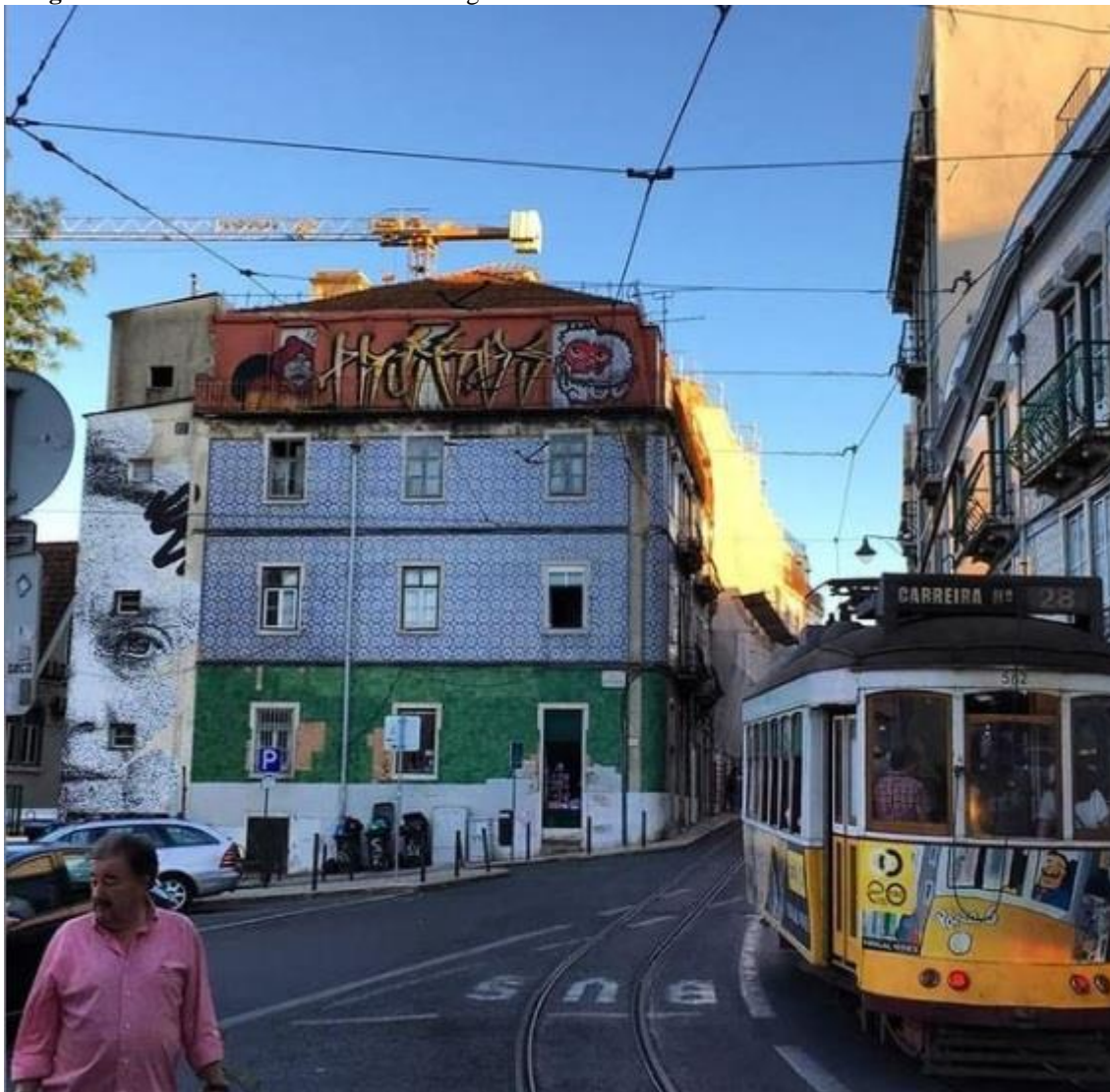
Imagem 10 - Graffiti Subtu. Lisboa - Portugal