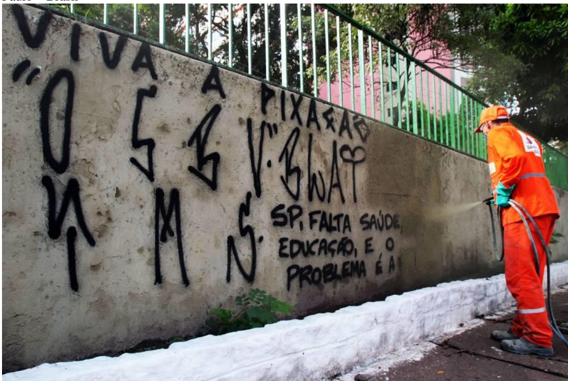
Imagem 30 – Viva a pixação – Provocação contra as ações anti pixação do prefeito João Dória. São Paulo – Brasil