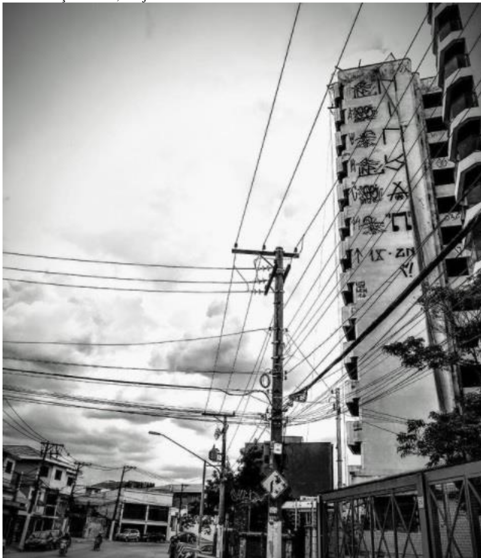
Imagem 14 - Pixação lateral, Ninja. São Paulo – Brasil.

Fonte: Instagram do artista Ninja. Disponível em: https://www.instagram.com/p/BsduyNQH9n1/ . Acesso em: 20 mar. 2021