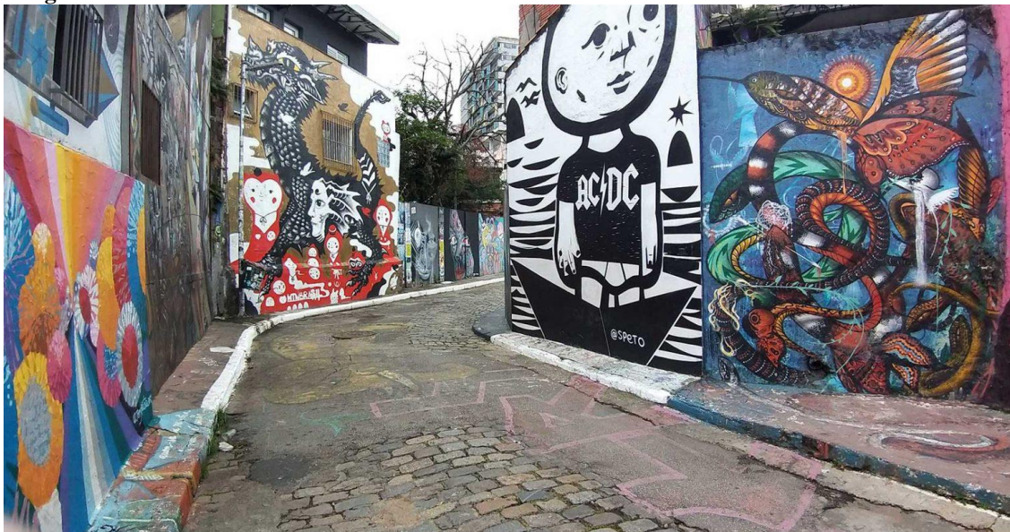
Imagem 19 – Interior do Beco do Batman. São Paulo – Brasil