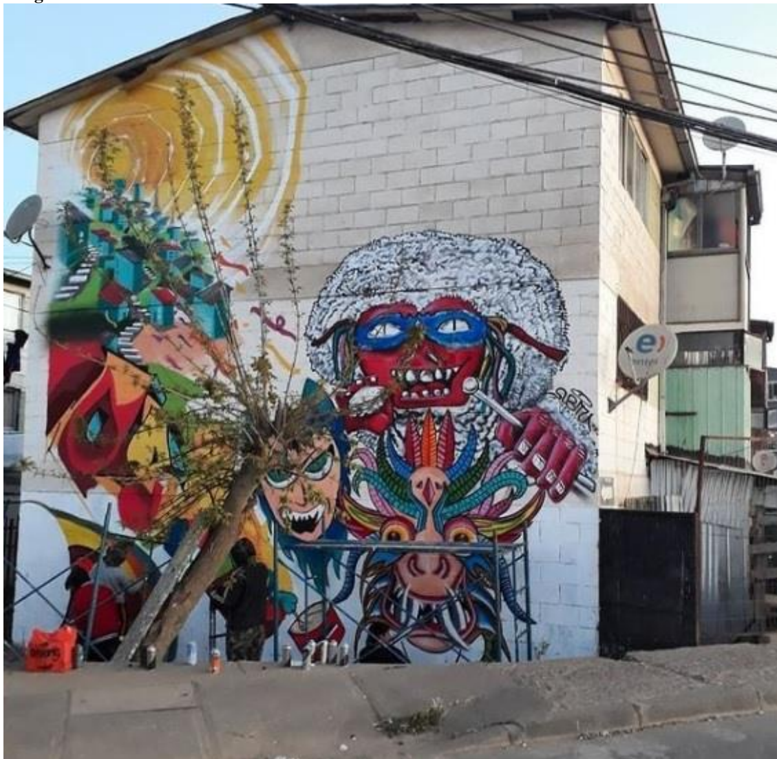
Imagem 8 - Painel coletivo. Val Paraíso – Chile