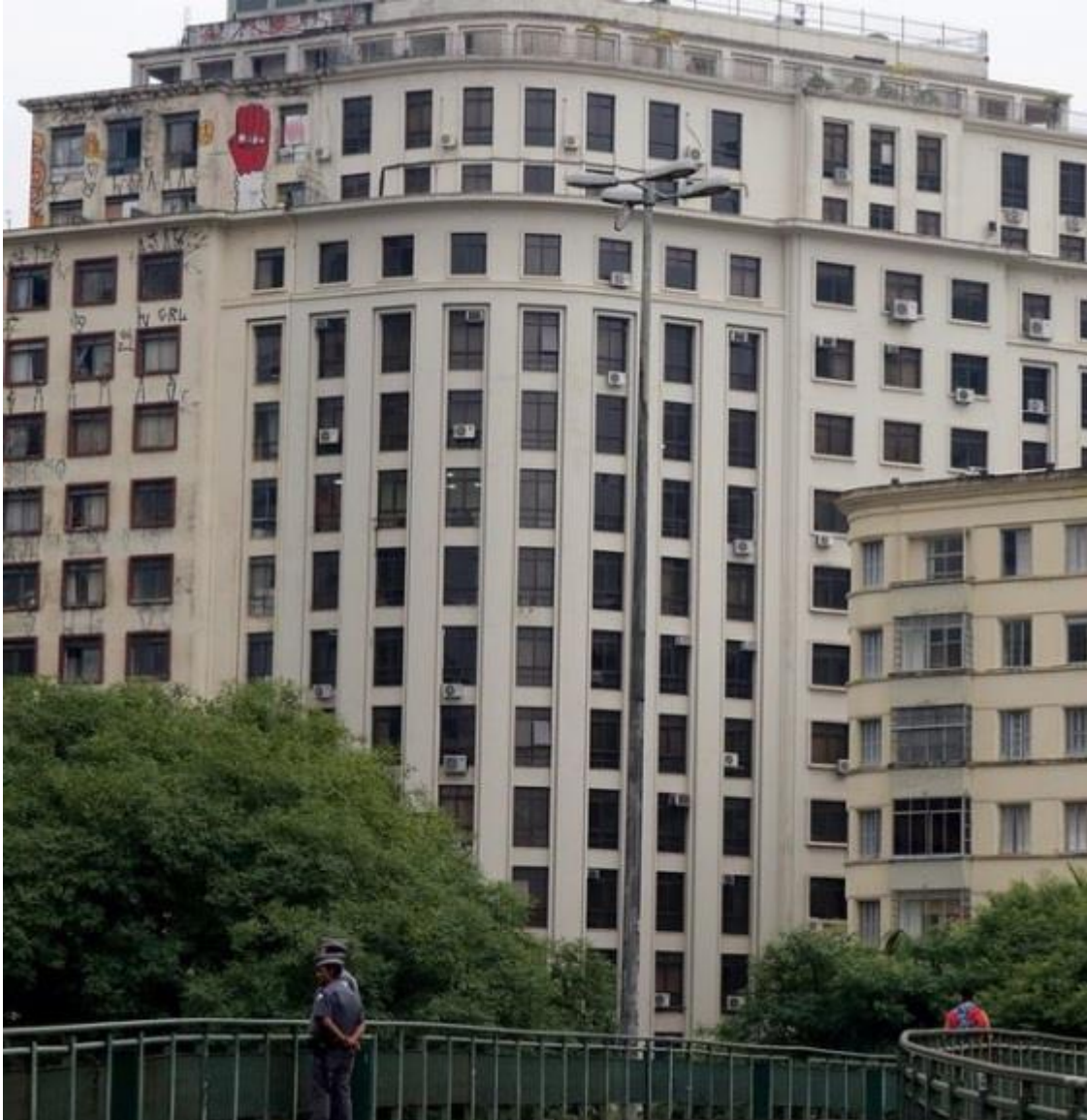
Imagem 40 – Hotel Cambridge lateral. São Paulo – Brasil

Fonte: Instagram do artista Subtu. Disponível em: https://www.instagram.com/p/BdyYaOyHPNo/ . Acesso em: 18 mar. 2021