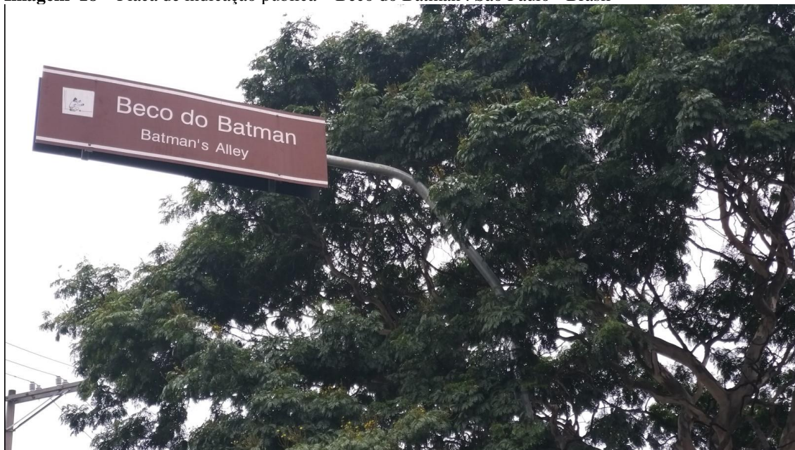
Imagem 18 – Placa de indicação pública – Beco do Batman . São Paulo - Brasil