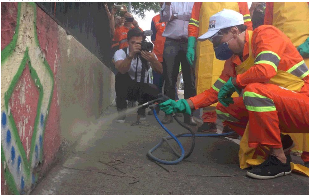
Imagem 24 – João Dória, vestido de prestador de serviço da prefeitura, pintando de cinza os muros da avenida 23 de maio. São Paulo – Brasil