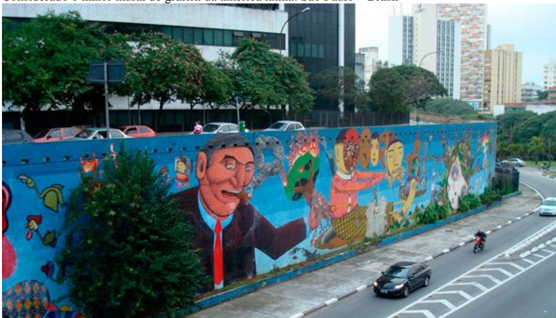
Imagem 22 – Mural coletivo na avenida 23 de Maio, com destaque para o graffiti dos Gêmeos – Considerado o maior mural de graffiti da América Latina. São Paulo – Brasil