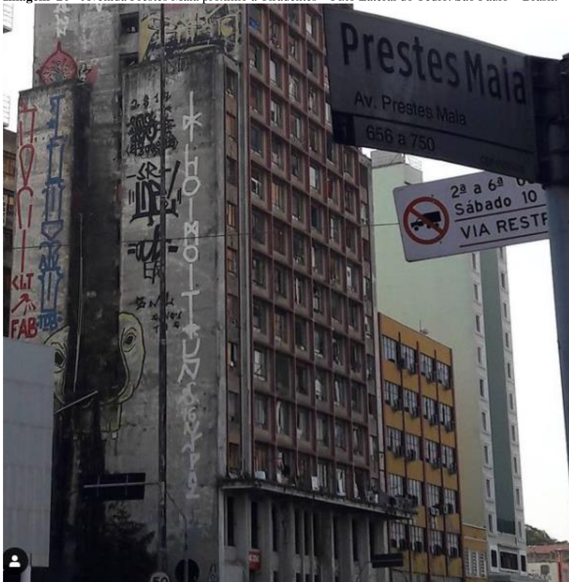
Imagem 20 - Avenida Prestes Maia próximo a Tiradentes – Pixo Lateral do Tédio. São Paulo – Brasil.