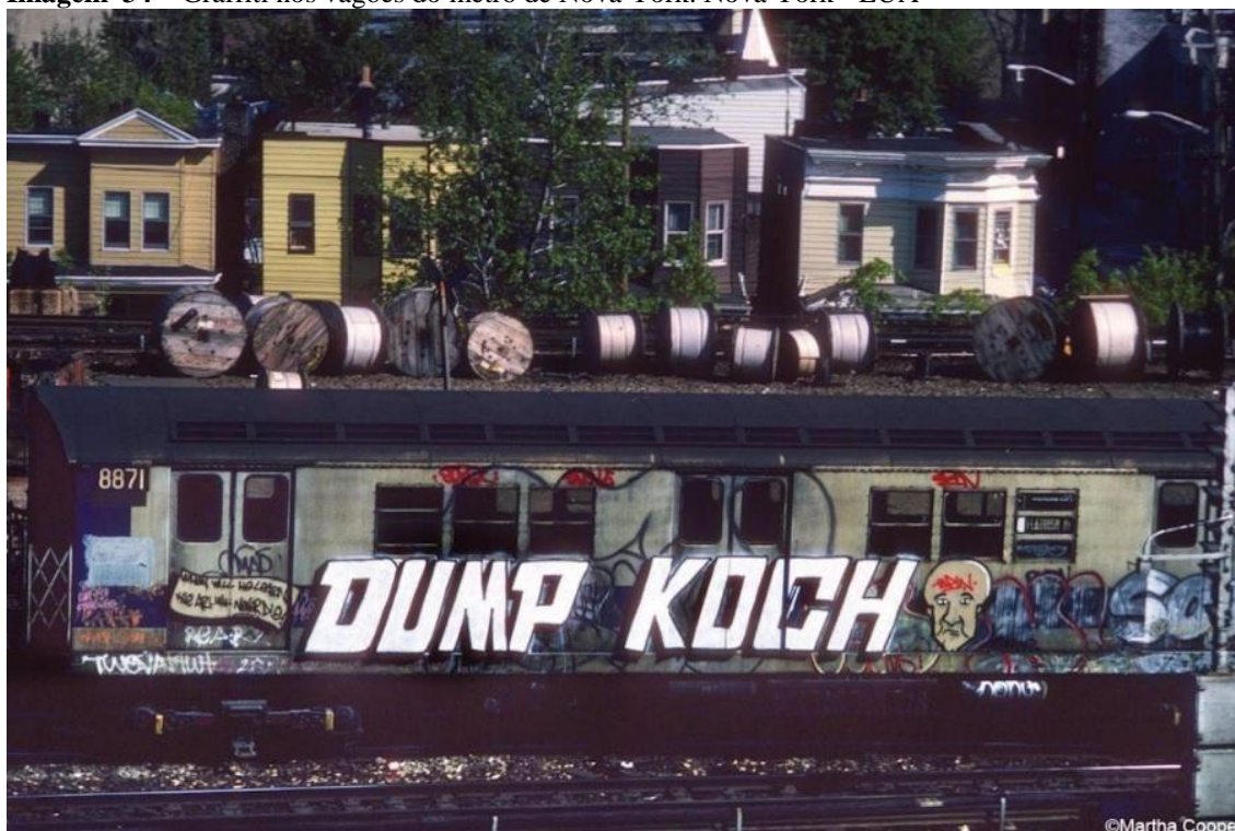
Imagem 34 – Graffiti nos vagões do metrô de Nova York. Nova York - EUA