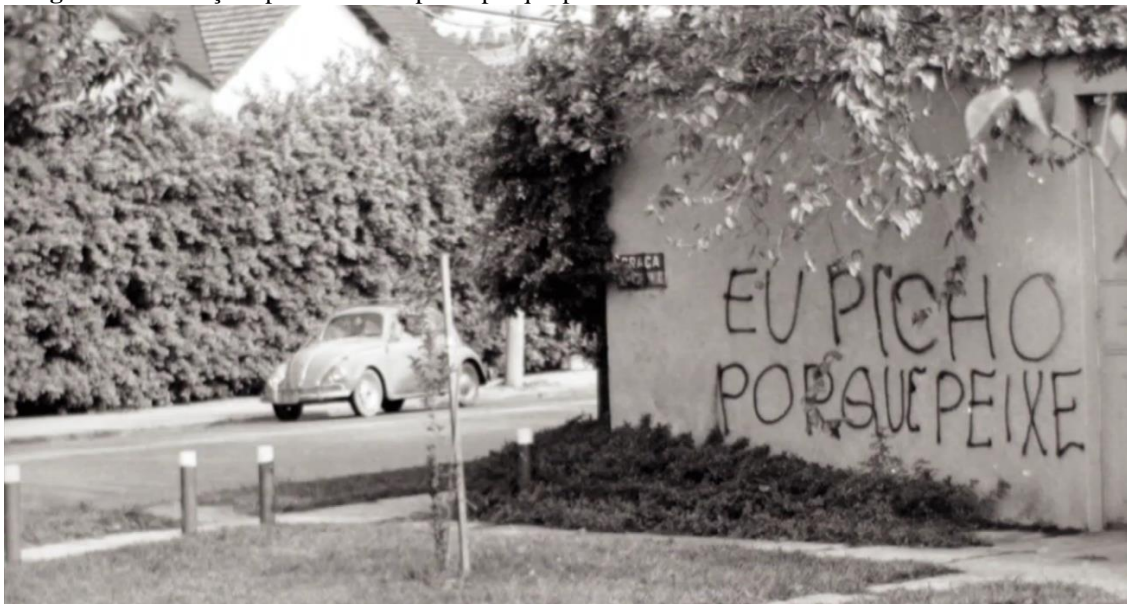
Imagem 32 – Pixações poéticas – Eu picho porque peixe. Brasil

Fonte: Revista Garupa. Disponível em: http://revistagarupa.com/edicao/edicao-seis-quadra-9/secao/ja-nos-levaram-tudo-6/artigo/pixador-grafiteiro-muralista-a-espetacularizacao-d . Acesso em: 20 mar. 2021