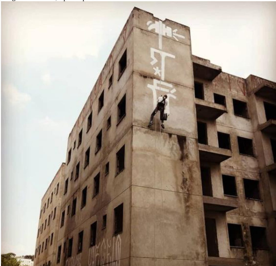
Imagem 13 – Tédio, rapel em prédio abandonado – Zona norte de São Paulo – Brasil