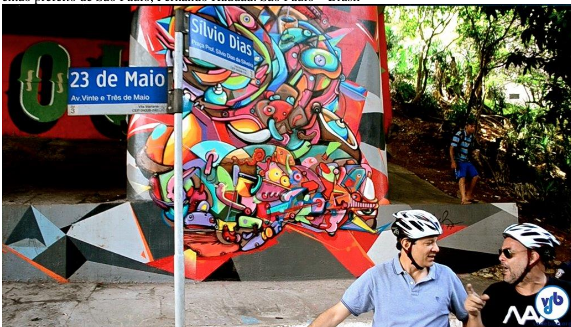
Imagem 23 – Pedala de Inauguração do mural de graffiti da avenida 23 de Maio, com a presença do então prefeito de São Paulo, Fernando Haddad. São Paulo – Brasil