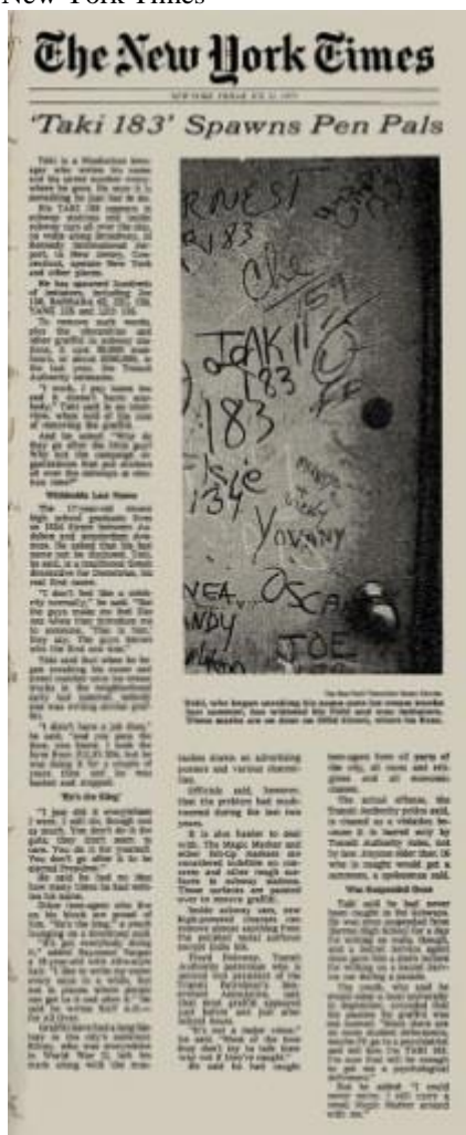
Imagem 33 – Taki 183 no The New York Times