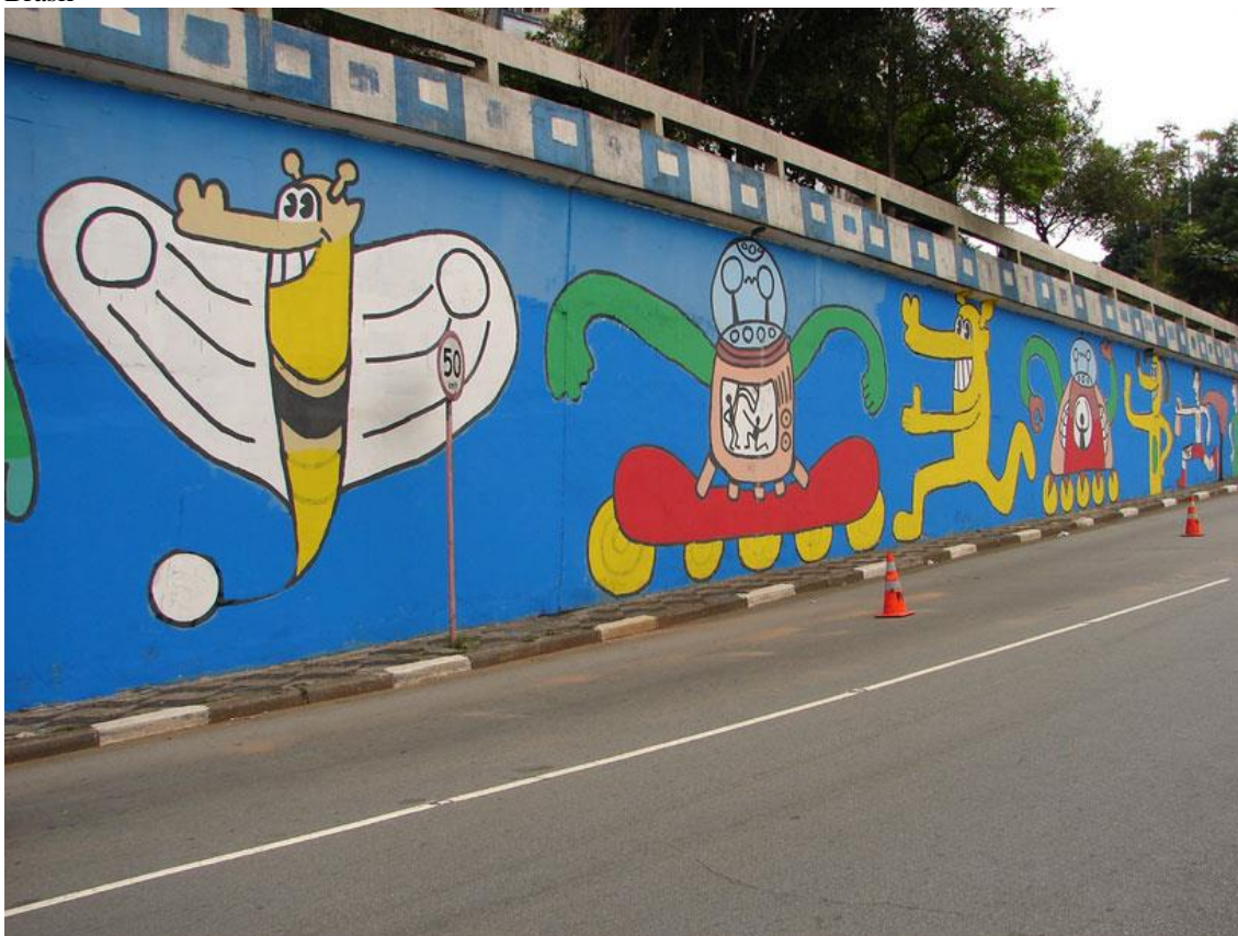
Imagem 17 – Túnel que liga a avenida Paulista a Dr. Arnaldo - Painel de Rui Amaral. São Paulo – Brasil