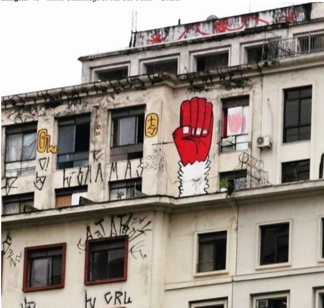
Imagem 41 – Hotel Cambridge zoom. São Paulo – Brasil