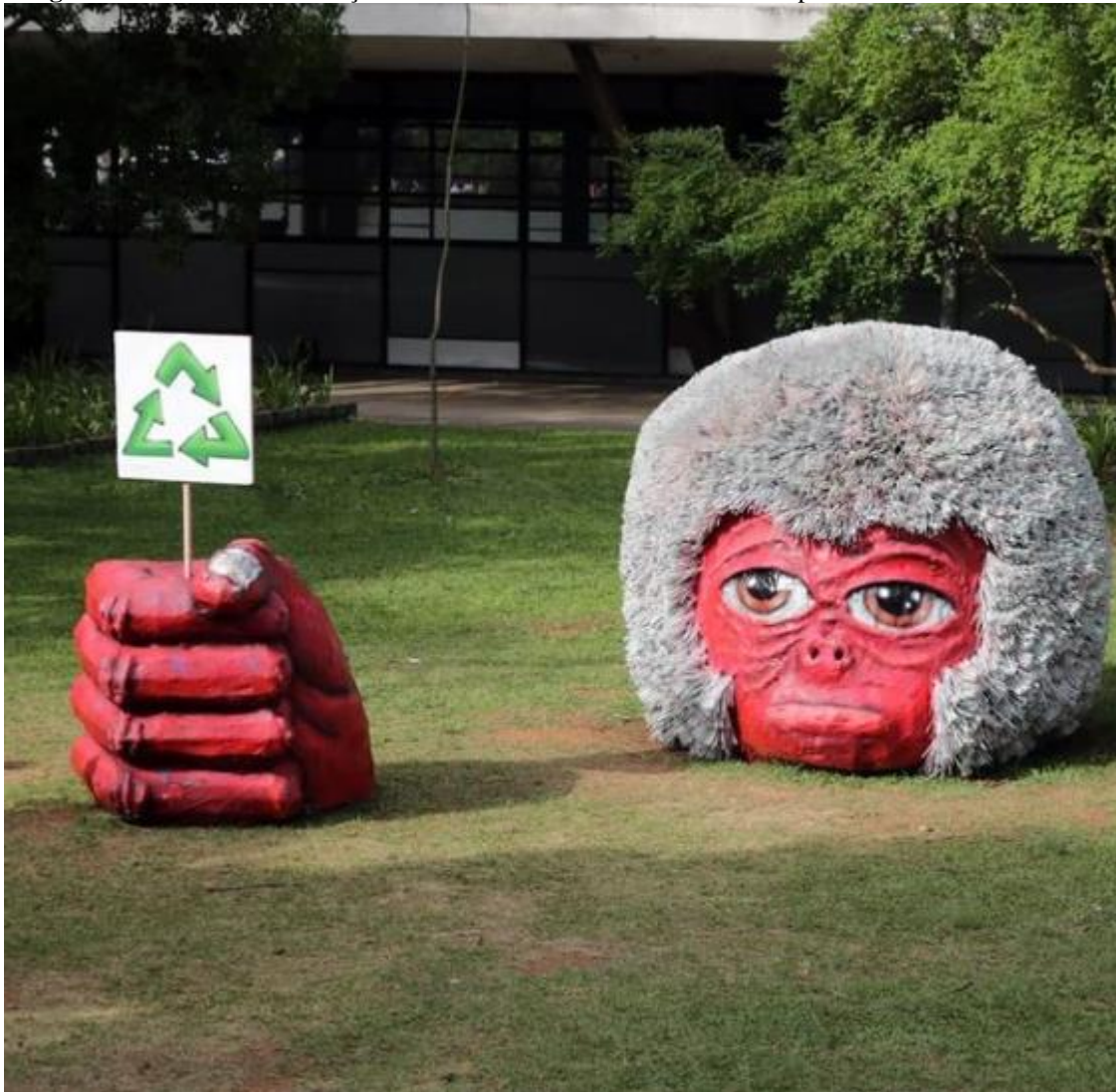
Imagem 38 – Escultura/ Instalação Amor e Ódio – Macaco Yoko no Ibirapuera. São Paulo – Brasil