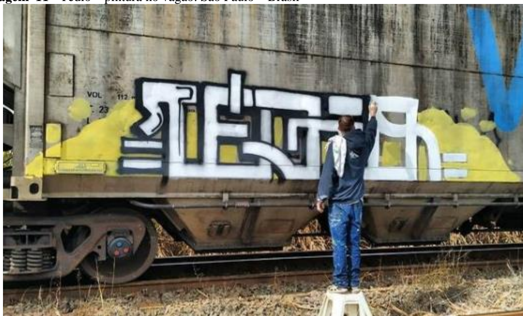
Imagem 11 - Tédio – pintura no vagão. São Paulo – Brasil

Fonte: Instagram do artista Tédio. Disponível em: https://www.instagram.com/p/CBRZJJ4j9a9/ . Acesso em: 20 mar. 2020