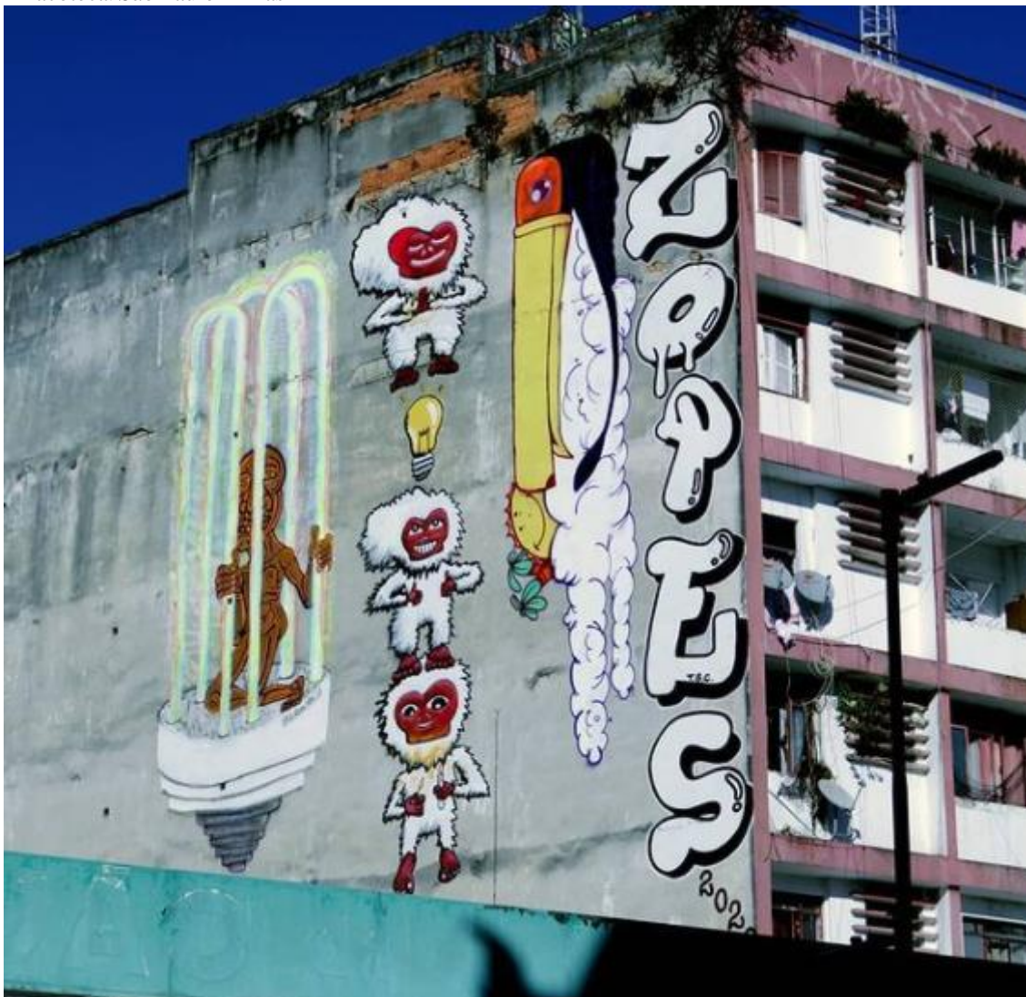
Imagem 21 – Macaco Yoko, graffiti do Subtu, em lateral do prédio na região central – Estação Luz Pinacoteca. São Paulo – Brasil