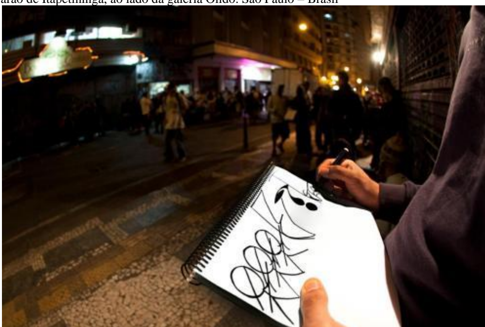
Imagem 36 – Assinatura de folhinhas no point de pixação, região central – Encontro às quintas-feiras, rua Barão de Itapetininga, ao lado da galeria Olido. São Paulo – Brasil