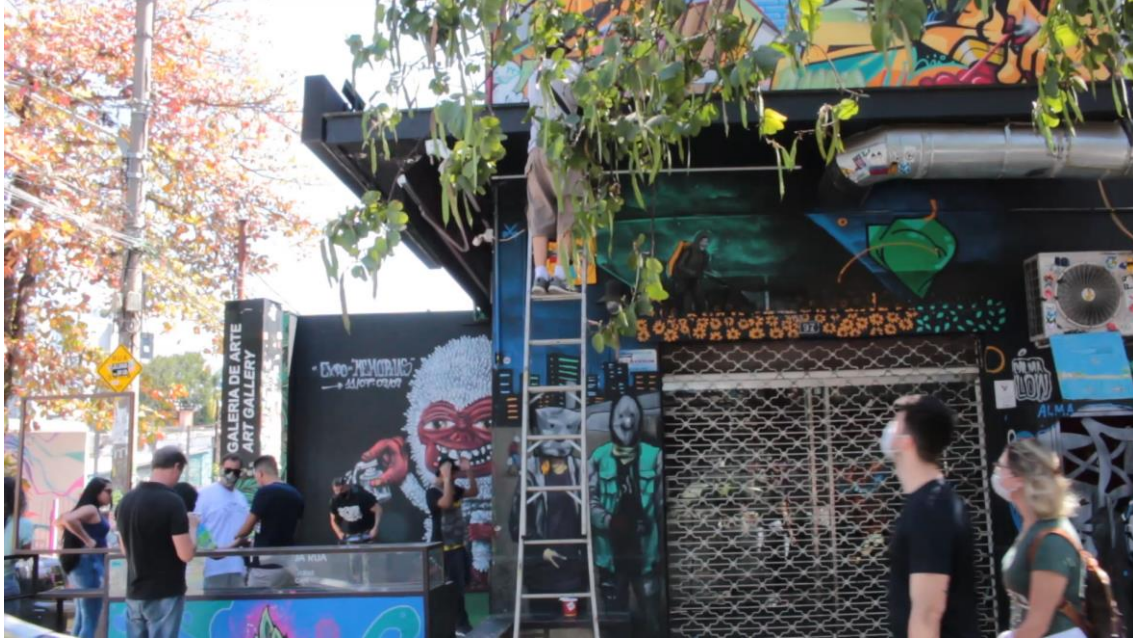
Imagem 1 - Subtu em pintura da fachada, Galeria Alma da Rua. São Paulo – Brasil

madrugada, privilegiando horários em que as ruas e avenidas têm menor circulação de carros e pedestres, e a maioria dos moradores está dormindo.