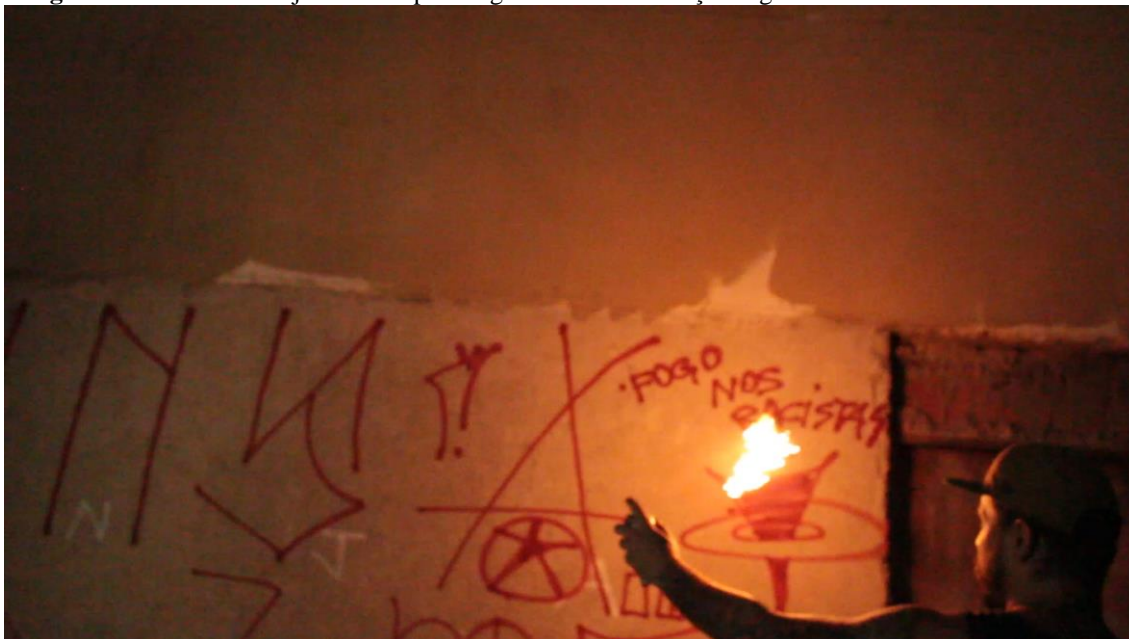
Imagem 45 – Pixador Ninja com seu pixo seguido da manifestação fogo nos racistas. São Paulo – Brasil