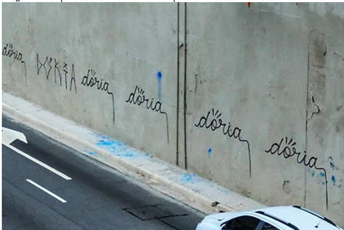
Imagem 29 – Sequência de doze vezes do nome do prefeito Dória na avenida 23. São Paulo – Brasil