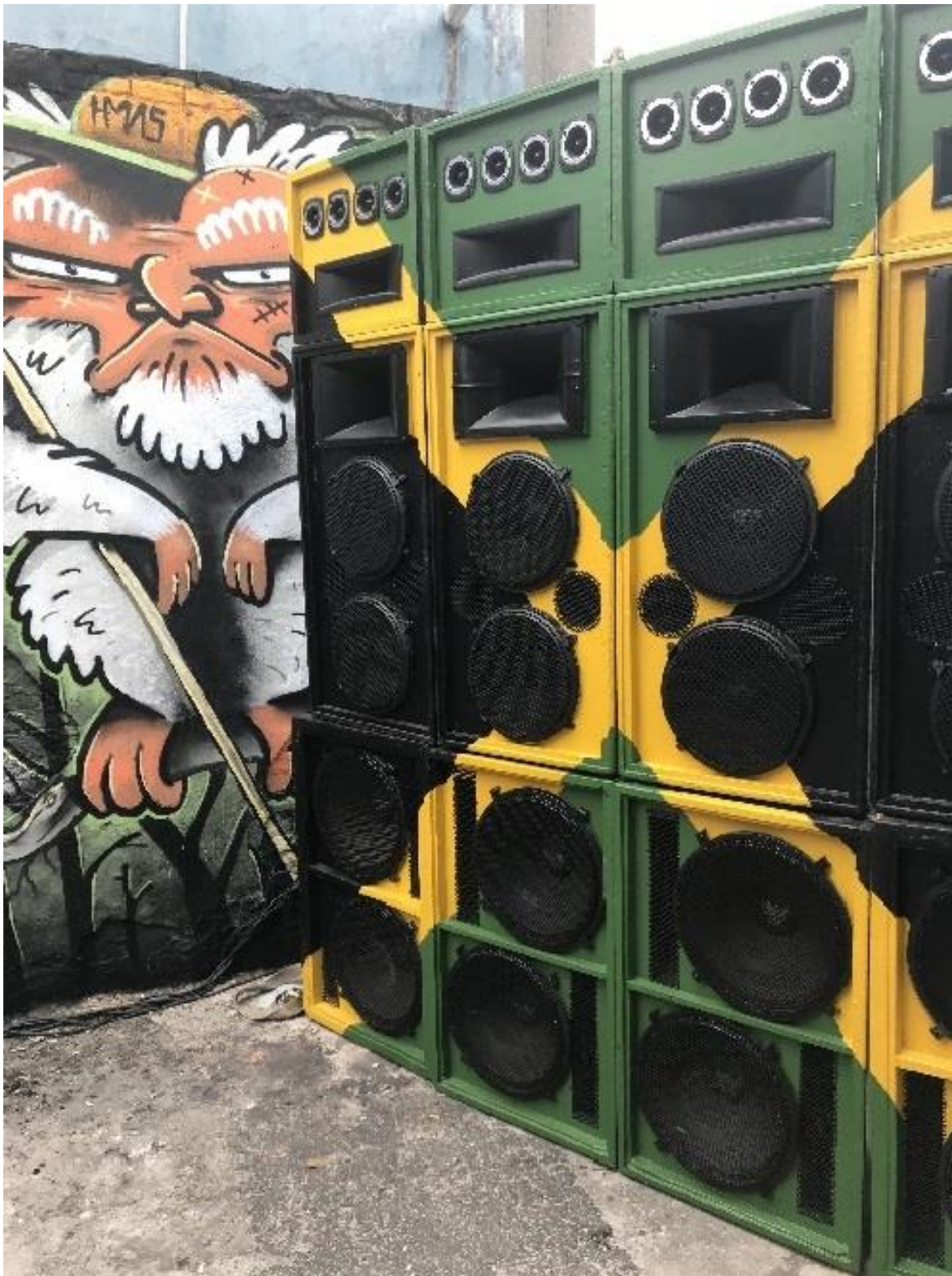
Imagem 3 – Evento 1 Lapa frente – Soundsystem. Revitalização do Beco Bartolomeu Belli; comemoração 10 anos do macaco Yoko. São Paulo – Brasil