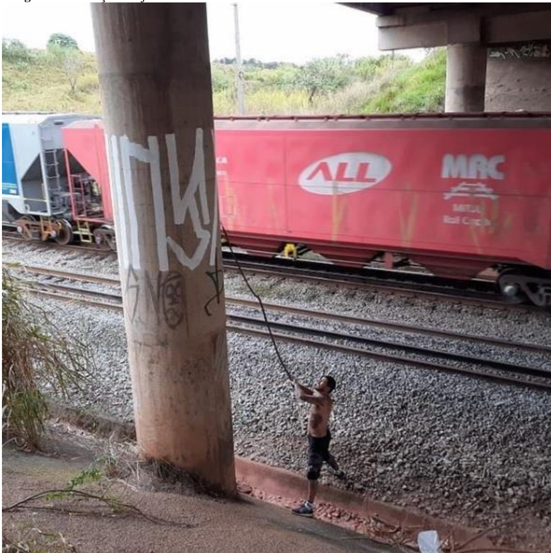
Imagem 12 - Pixação Ninja com cabo extensor. São Paulo – Brasil