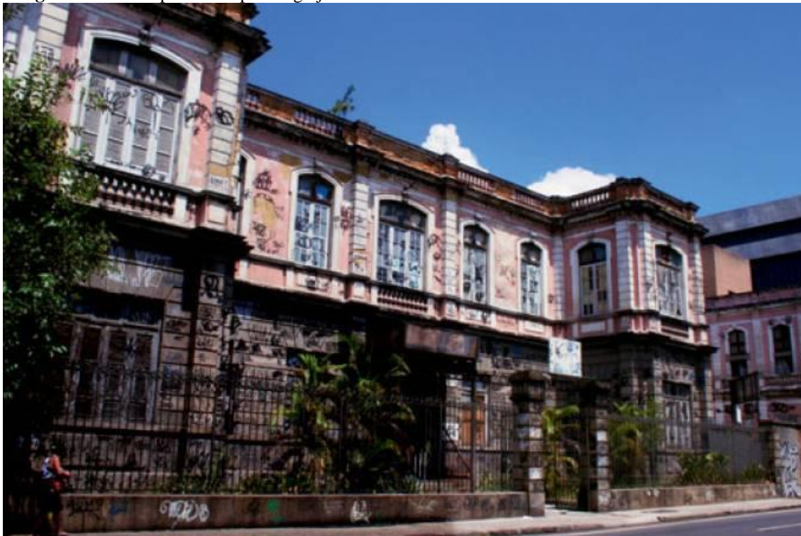
Imagem 42 – Exemplo de Xarpi em Igreja do século XVIII. Rio de Janeiro – Brasil