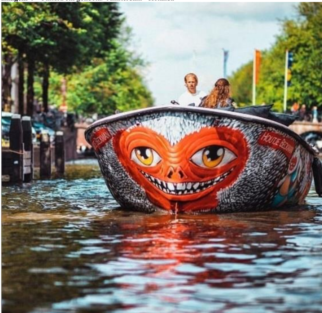
Imagem 9 - Pintura em gondola. Amsterdam - Holanda