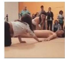
Museu de Arte Moderna de esquerda, exhibe peça que exalta a pedofilia