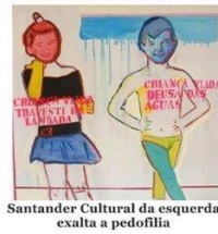
Santander Cultural da esquerda exalta a pedofilia

Ano que vem o amigo do seu filho pode estar indo pra escola com o revólver do pai na mochila. Pense nisso hoje.