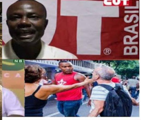
Colagem de imagens propagadas nas redes durante o ano de 2015.