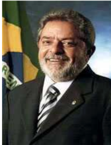
Figura 2 13

CONGRESSO NACIONAL Brasília, 1º de janeiro de 2003