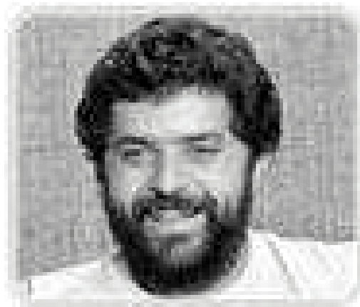
Figura 1 4

1ª Convenção do Partido dos Trabalhadores Brasília, 27 de setembro de 1981