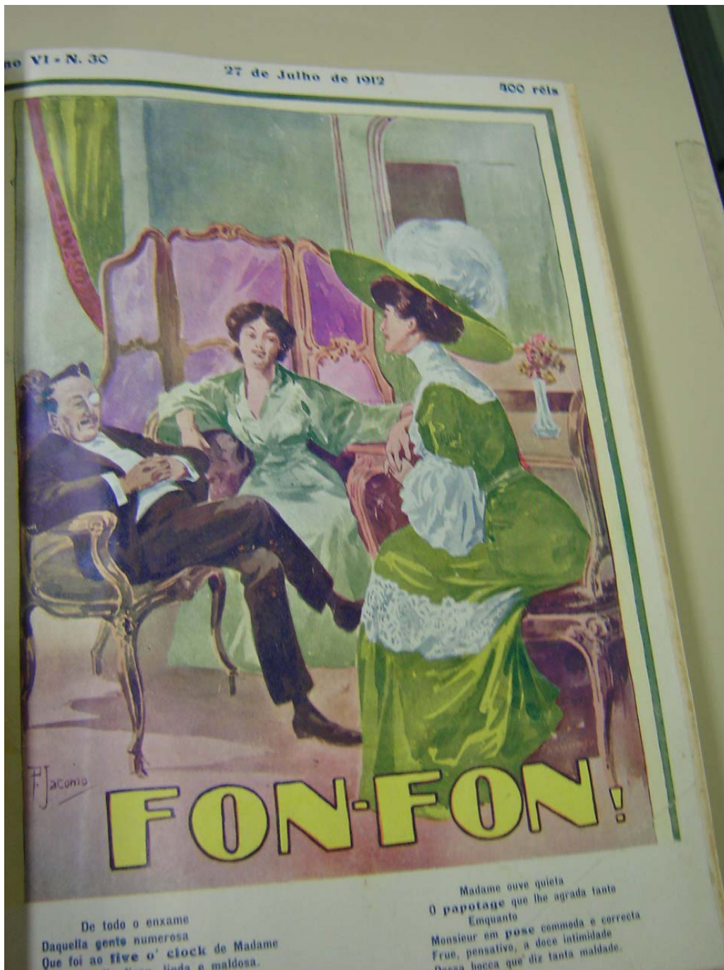
Figura 02- Capa Fon Fon! 27/07/1912 nr. 30 alusiva à moda da época em receber convidados para o chá da tarde, referido na revista enquanto five-o-clock tea.