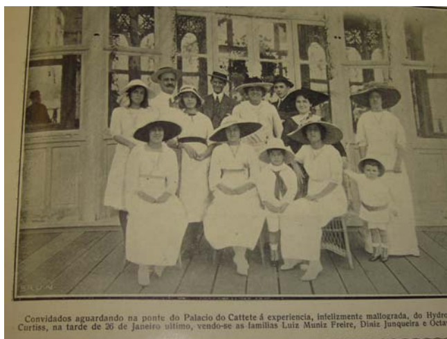
Fon Fon! , ano V, nr. 22, p. 44, 01/06/1912

As roupas que são apresentadas constituem-se de vestidos com algumas camadas de tecidos, onde haveria a camisa e o espartilho abaixo destes, além das golas altas. A roupa para o dia seria mais comportada e fechada em detrimento da veste para eventos noturnos.