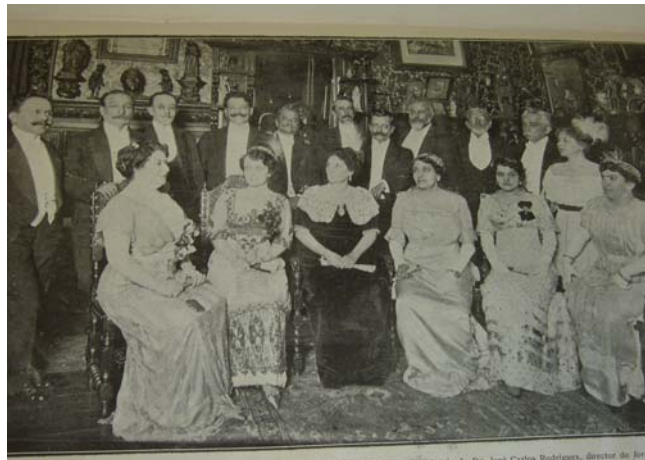
Fon Fon! , Ano V, nr. 22, p.25, 26/01/1912

O vestuário utilizado para certas ocasiões, tais como festas de casamento ou saraus, estaria mais adequado ao clima brasileiro, visto que os decotes seriam aprofundados, as mulheres não utilizariam chapéus e os espartilhos teriam a função de condicionar-lhes o comportamento prendendo-lhes os movimentos.