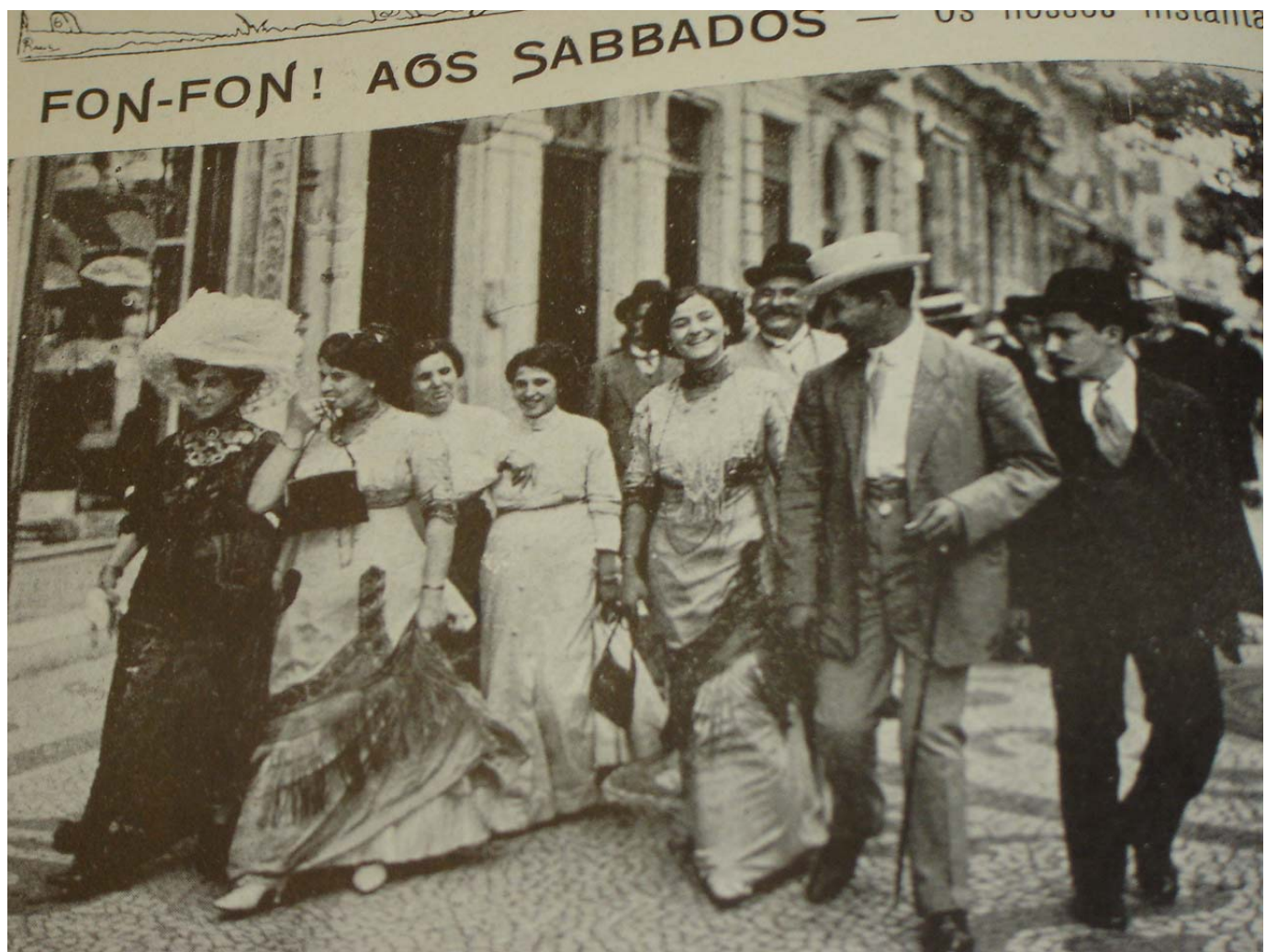
Figura 10: Fotografia tirada no sábado em razão de um passeio na Rua do Ouvidor, no Rio de Janeiro, para a revista Fon Fon! em 20/01/1912, ano V, nr 3, p. 40. Época de verão intenso, as mulheres caminhariam com vestidos pesados e botinas pelas ruas, conforme o costume europeu. Apenas a mulher da esquerda aparece com chapéu, enquanto as outras apresentam coques e apliques na cabeça.