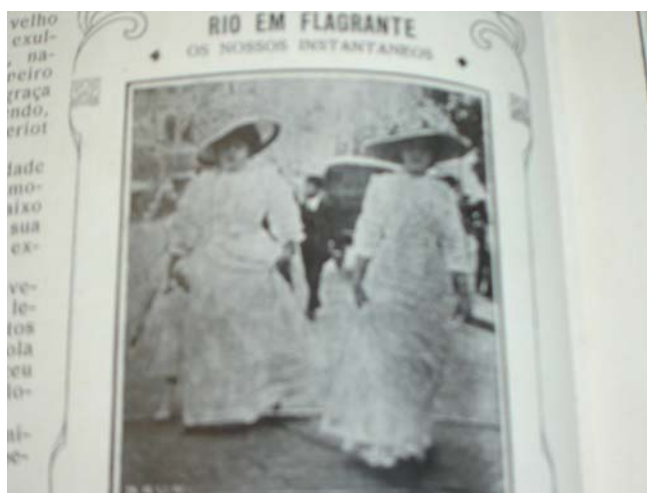
Fon Fon! , ano V, nr. 03, p. 26, 20/01/1912