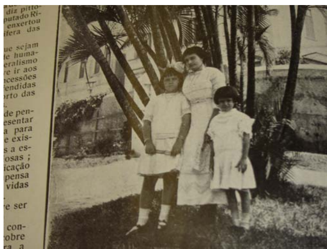
Fon Fon! , Ano v, nr. 03, p. 22, 20/01/1912