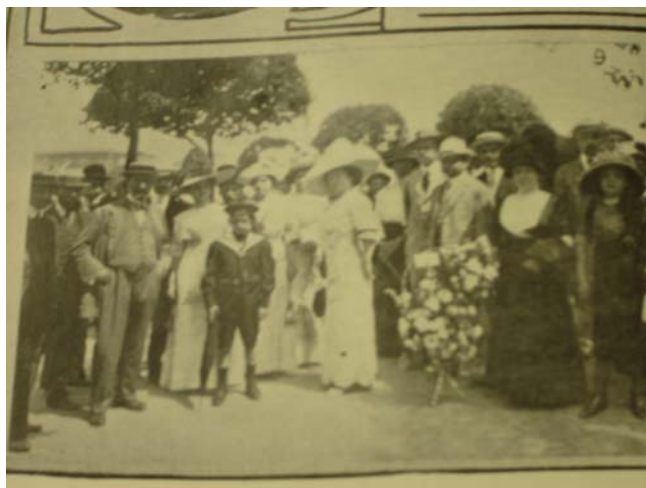
Fon Fon! , ano V, nr. 04, p. 32, 27/01/1912