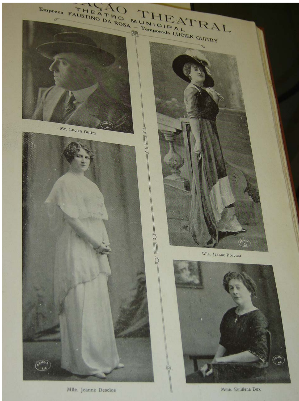
Figura 16: Anúncio de Companhia teatral para a revista Fon Fon! de 08/06/1912, ano V, nr. 23, p. 54. Nota-se o tratamento utilizado para as atrizes de madame ou mademoiselle .