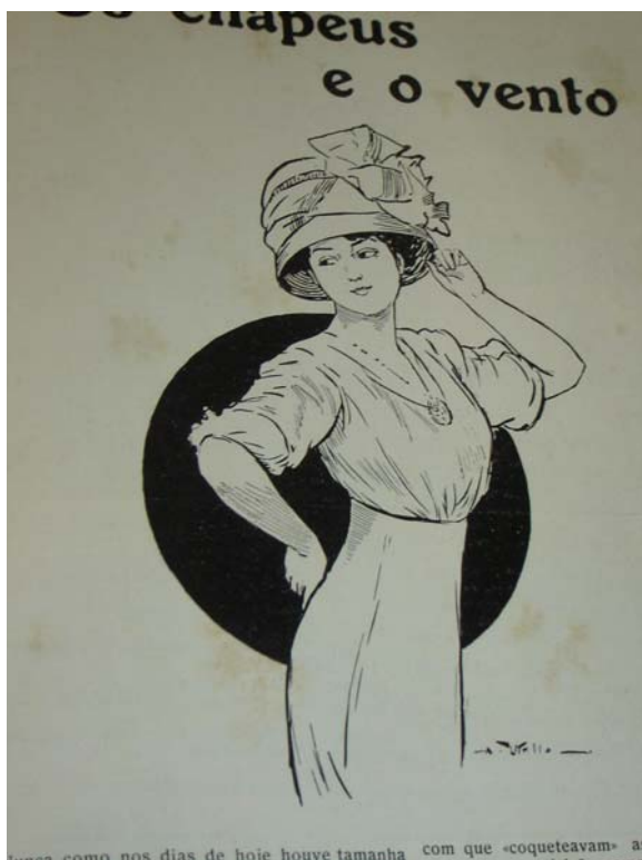
Fon Fon! , ano V, nr. 12, p. 05, 03/02/1912

Os chapéus de copa alta estariam no ápice da moda e deveriam ser usados durante o dia para passeios.