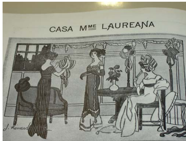
Fon Fon! , ano V, nr. 14, p. 14, 30/03/1912