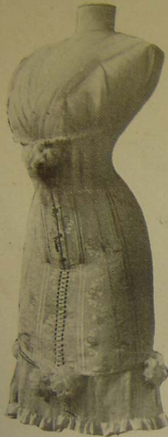
Collete da Casa Nascimento. Modelo Le Réve véritable baleine , en soie broché.

E' o que he'je faz creando esta pagina. Aqui discutiremos as predilecções do feminino e as tendências da moda presente dentro da arte de vestir uma mulher de trajos harmoniosos e elegantes, fazendo resaltar o valor de suas linhas puras e sobresahir a allure encantadora da graça.