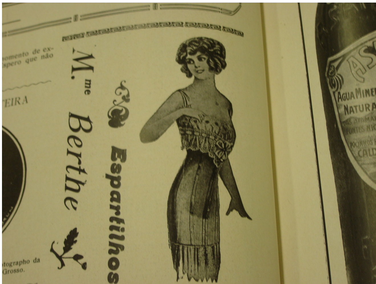
Figura 1: Imagem publicada na revista Fon Fon! 20/01/1912 Ano V nr 3 p. 08. Nota-se a utilização do nome M. me Berthe para a identificação de qualidade e confirmação da procedência desta veste íntima: o espartilho.