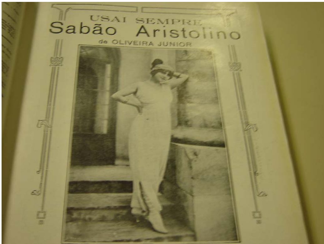
Figura 09: Anúncio para o sabão Aristolino na revista Fon Fon! de 06/01/1912, ano V, nr. 1, p. 52. A roupa apresenta a forma do corpo que estaria em moda na época, além de perceberem-se as botas de cano longo.