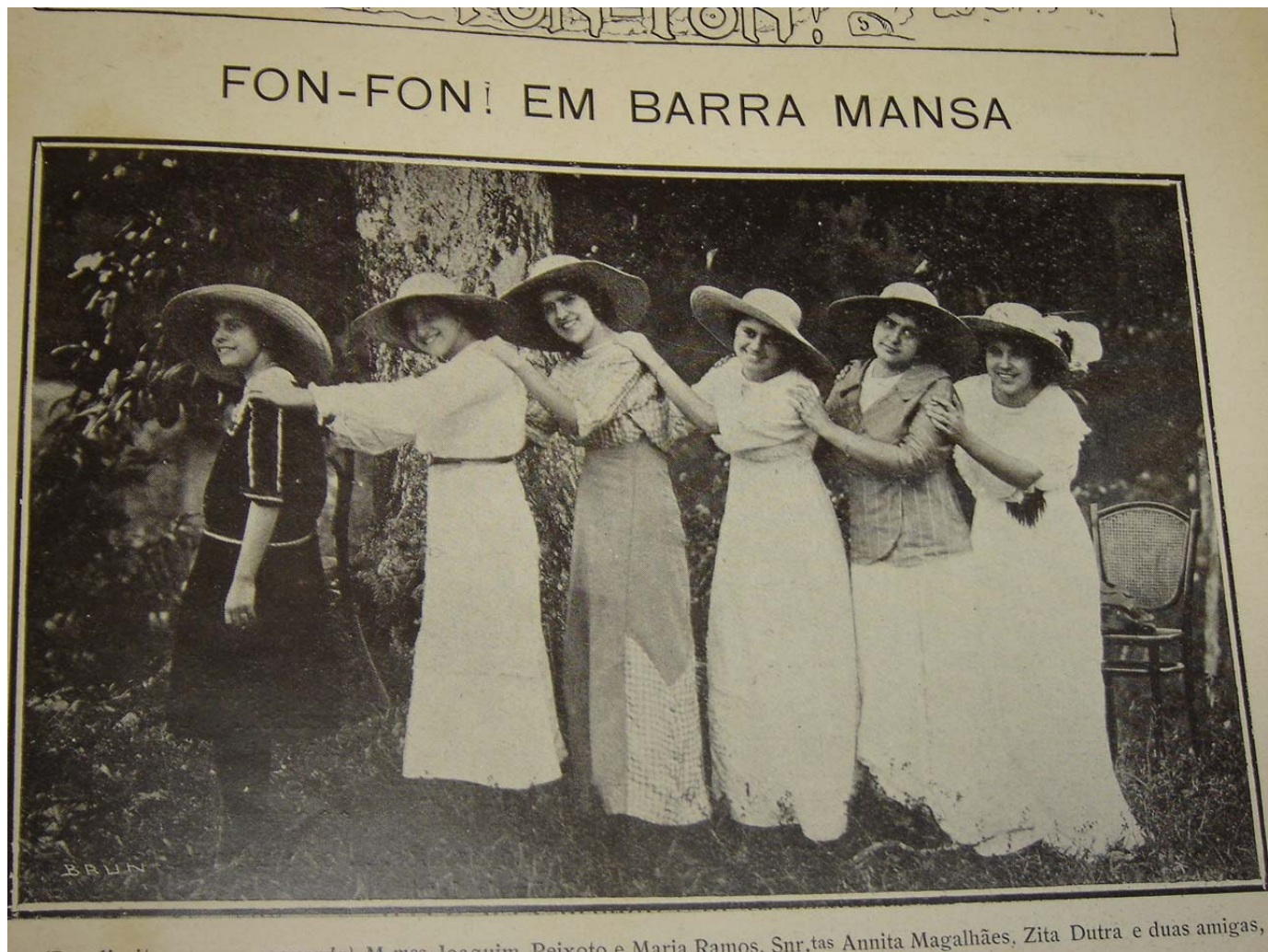
Figura 14: Retrato para a revista Fon Fon! de 21/06/1913 ano VI, nr. 25, p. 34, as mulheres estariam com roupas para passeio no campo, que se aproximariam ao discurso do que seria ideal para Afrânio Peixoto.