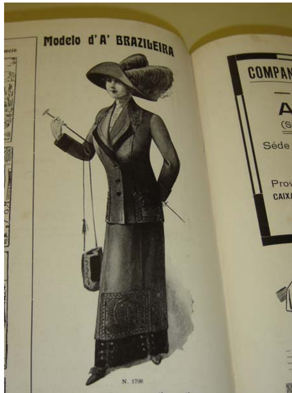
Fon Fon! , ano V, nr. 23, p. 54, 08/06/1912

As campanhas mostrariam roupas para a sociedade brasileira com informações sobre as utilizadas na Europa, principalmente França, fato que pode ser observado pelos termos Mademoiselle e Madame, além dos tecidos serem descritos a partir de termos franceses.