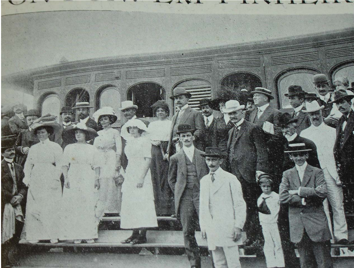
Figura 13: Retrato tirado durante a inauguração da Escola de Agricultura para a revista Fon Fon! de 27/04/1912, ano V, nr 17, p. 19. O grupo de convidados que se vê seriam apanhados na Estação de Pinheiros e levados para o anexo ao posto de Zootecnia Federal de Pinheiro, no Estado do Rio de Janeiro.