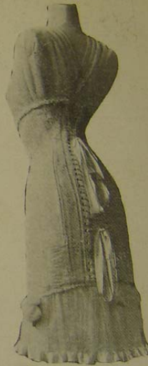
Collete da Casa Nascimento. Modelo Le Réve véritable baleine , en soie broché.

linha longa e pura, com a mais perfeita distincção. Estes colletes, modelo Le Réve , em seda bordada, se amoldam ás exigencias da coquetterie, lindamente, e são o segredo da linha nova das parisienses.