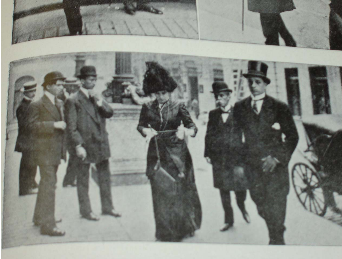
Figura 11: Retrato tirado para a revista Fon Fon! de 27/01/1912, ano V, nr 4, p. 27. Fotografia da entrada da Igreja da Candelária em dia de missa para as vítimas do bombardeio da Bahia, sendo que a mulher retratada seria esposa de Ruy Barbosa.