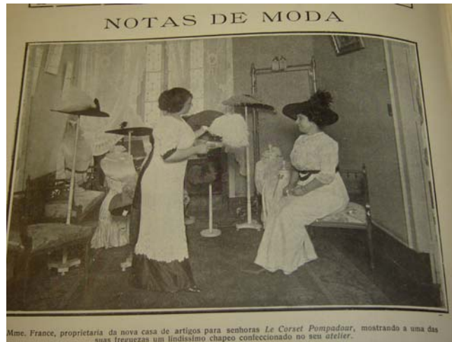
Fon Fon! , ano V, nr.12, p. 43, 22/03/1913