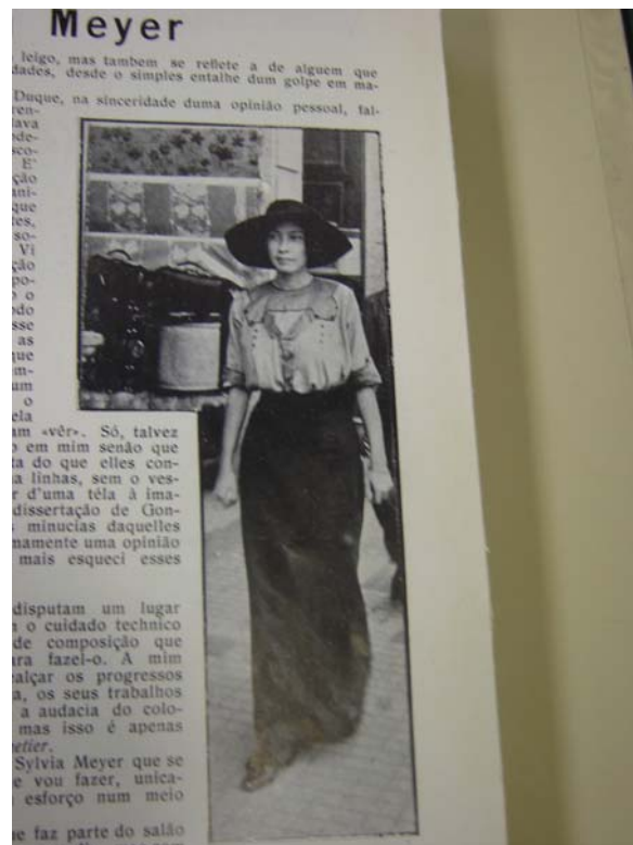
Fon Fon! , ano V, nr. 29, p. 29, 20/07/1912