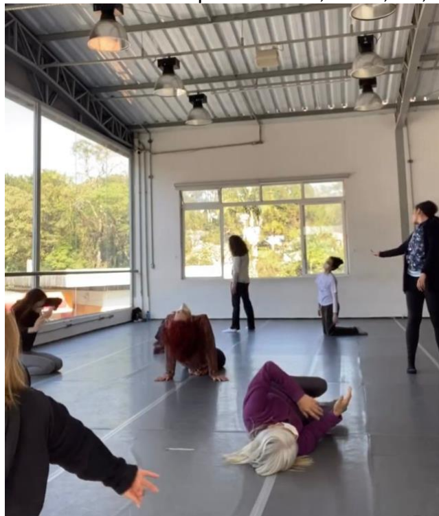
Figura 5- Oficina In.Corporar – EDA, Cotia, SP, 2022