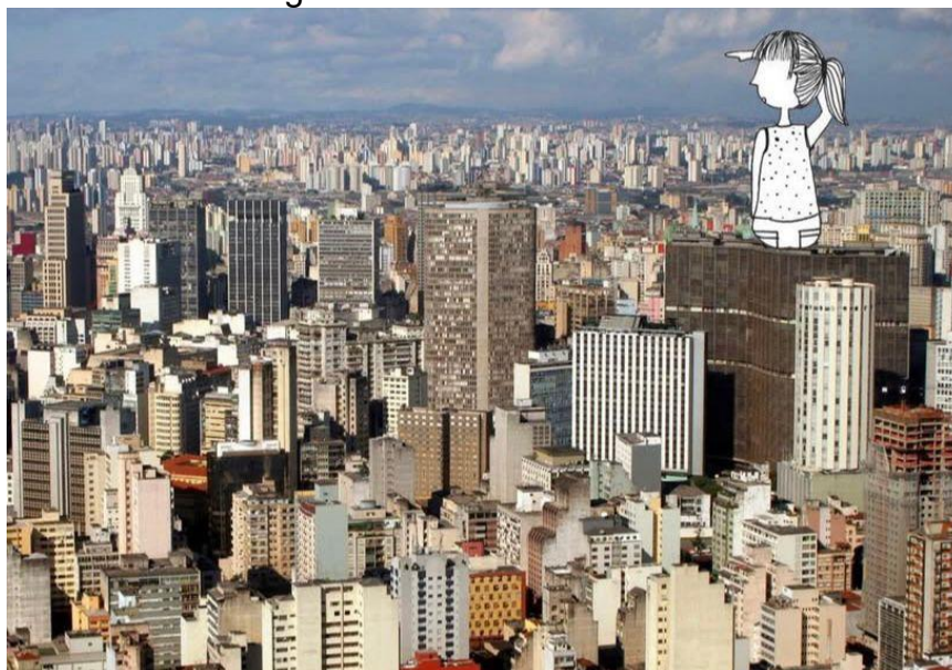
Figura 2- A menina na cidade

Ilustração de Gra Mattar