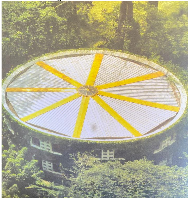
Figura 4- Casa Redonda