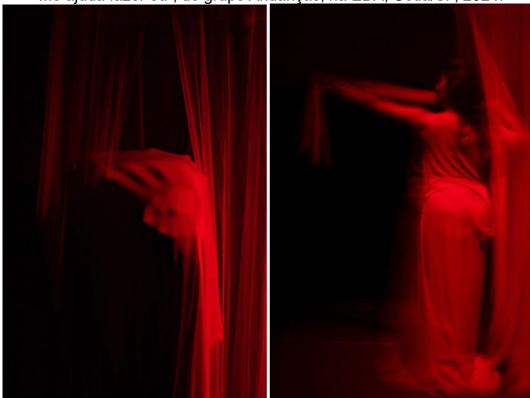
Figura 12- Dois registros da performance “A Veste Vermelha”, no espetáculo “Me ajuda fazer eu”, do grupo Andanças, na EDA, Cotia/SP, 2024.

Do bicho dentro da veste “vermelha” sai a construção de um feminino, que pulsa pela descolonização dos corpos, transformando a veste em uma arma, de arco de braço e flecha de veste.