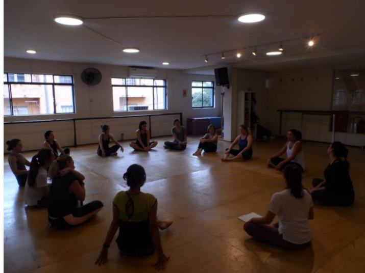
Figura 11- 1º Corpo Contato presencial, Espaço Steps, São Paulo/SP, 2023