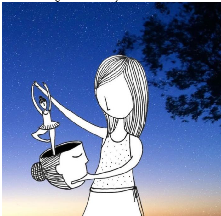
Figura 3- Cabeça de bailarina

Fonte: Arquivo pessoal - Ilustração de Gra Mattar