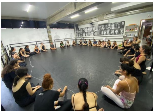
Figura 7- Oficina In.Corporar – Escola de Dança Saloly Furtado, Ubatuba, SP, 2023

Em geral, começamos a oficina em círculo, de modo que todos possam conversar, apresentar-se e trazer impressões sobre como estamos naquele momento. Como dizia Klauss: “falar é uma das formas pelas quais um ser humano situa-se no mundo, uma maneira de o corpo traduzir o que está sentindo” (Vianna, 2018, p. 132). Para a Técnica, esse início é de suma importância, porque ajuda o grupo a se conhecer e se estabelecer em sala.