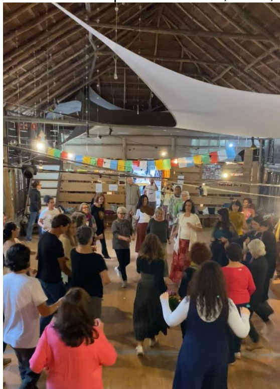
Figura 8- Oficina In.Corporar – Ulabiná, Cotia, SP, 2024