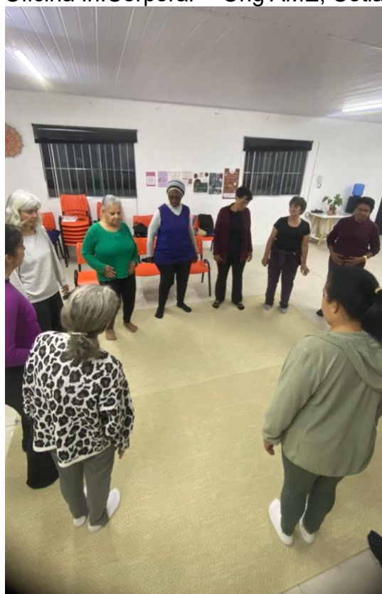
Figura 9- Oficina In.Corporar – Ong AME, Cotia, SP, 2025