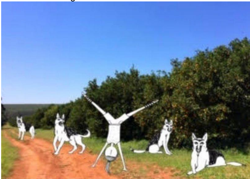
Figura 1- A menina na natureza

Ilustração de Gra Mattar.