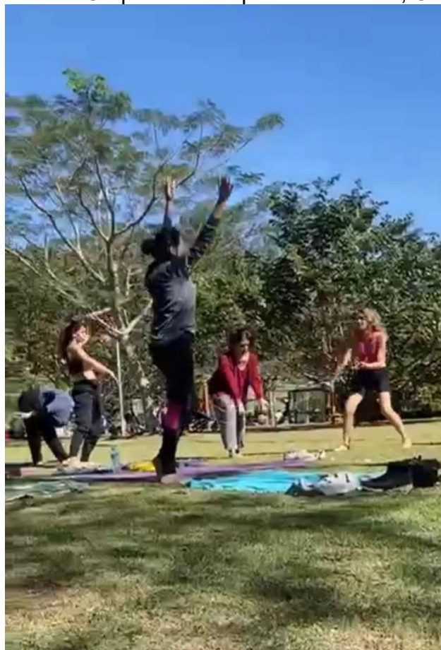
Figura 6- Oficina In.Corporar – Parque Tereza Maia, Cotia, SP, 2023