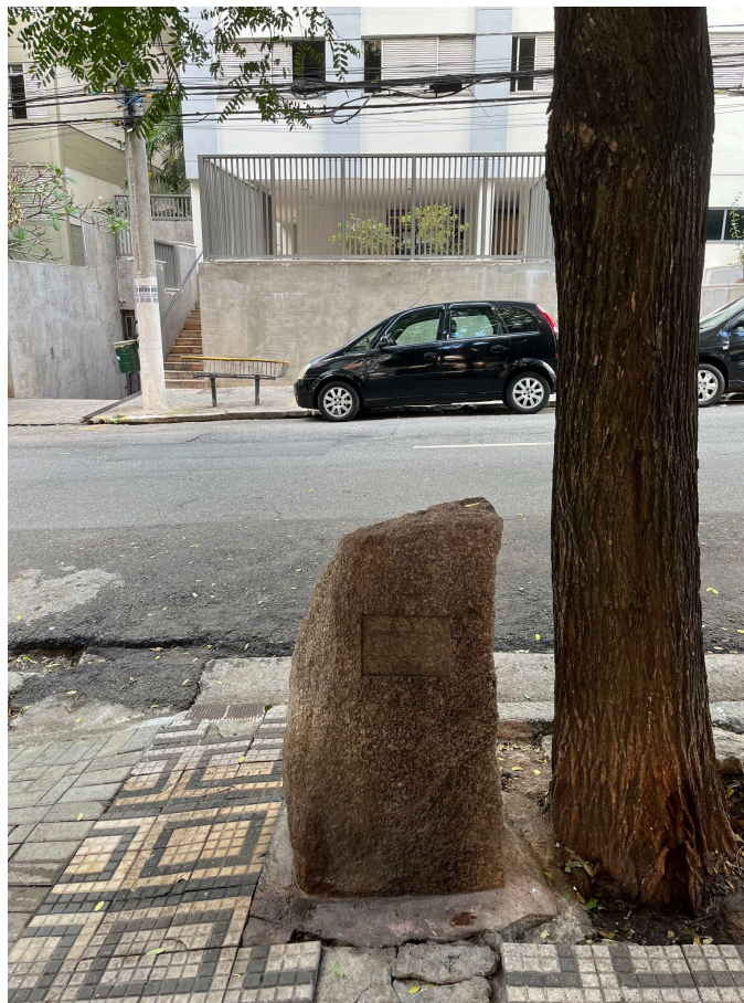
Homenagem a Carlos Marighella

O líder da luta armada contra o regime militar foi assassinado em uma operação do Deops-SP na noite de 4 de novembro de 1969. A pedra de granito foi instalada no local 30 anos depois do ocorrido, em 1999.