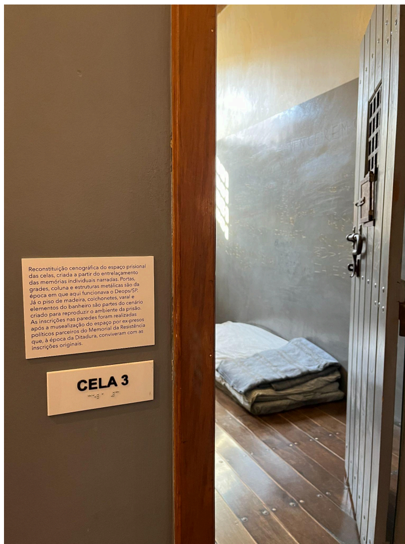
Cela 3 no Memorial da Resistência

As paredes das celas também possuem inscrições e desenhos recriados através da memória de sobreviventes que estiveram no local.