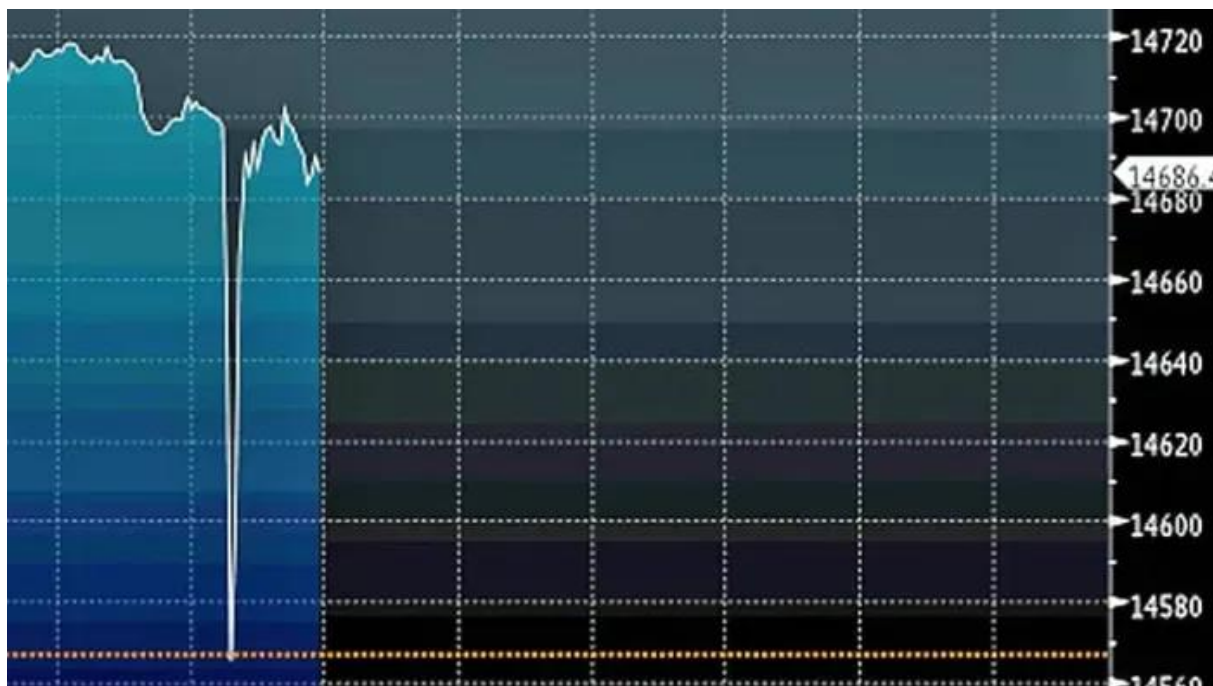
Gráfico 1 — Data compiled by Bloomberg shows the Dow Jones lost 120 points within minutes of an erroneous report about a bombing at the White House.