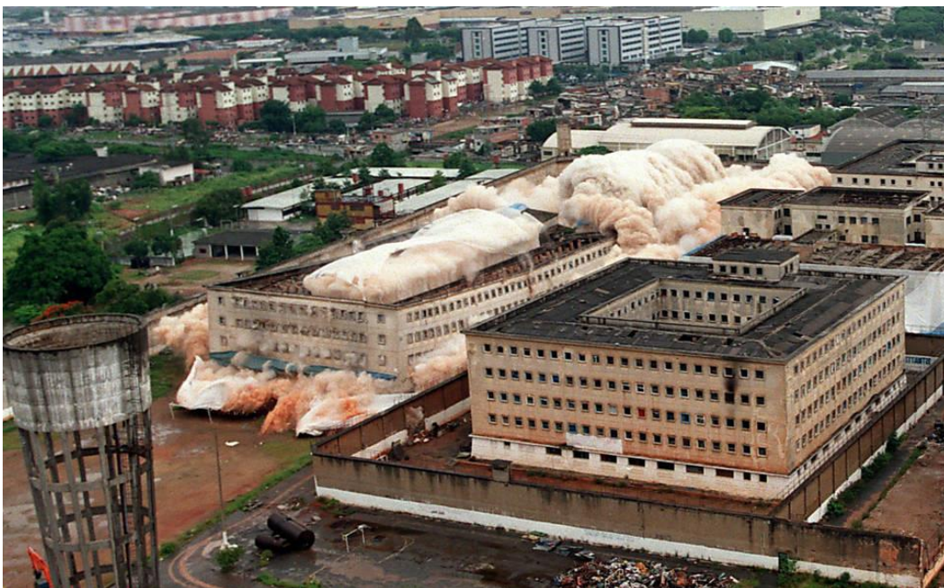
Implosão dos Pavilhões 6, 8 e 9 do Carandiru