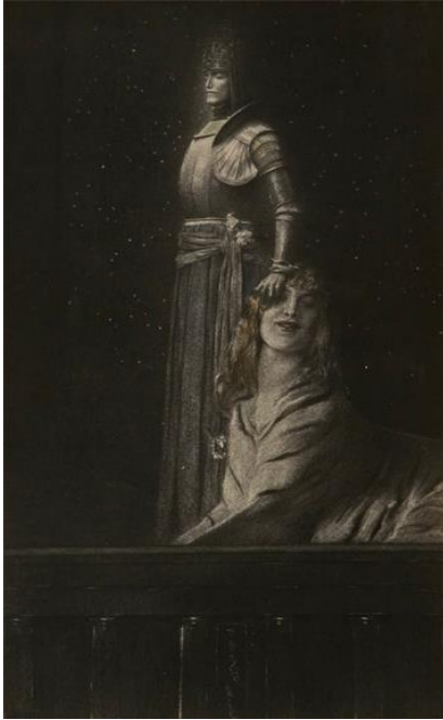
The meeting of animalism and an angel (1889) - Fernand Khnopff