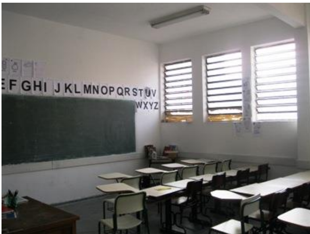
Sala de Aula – Penitenciária Feminina da Capital