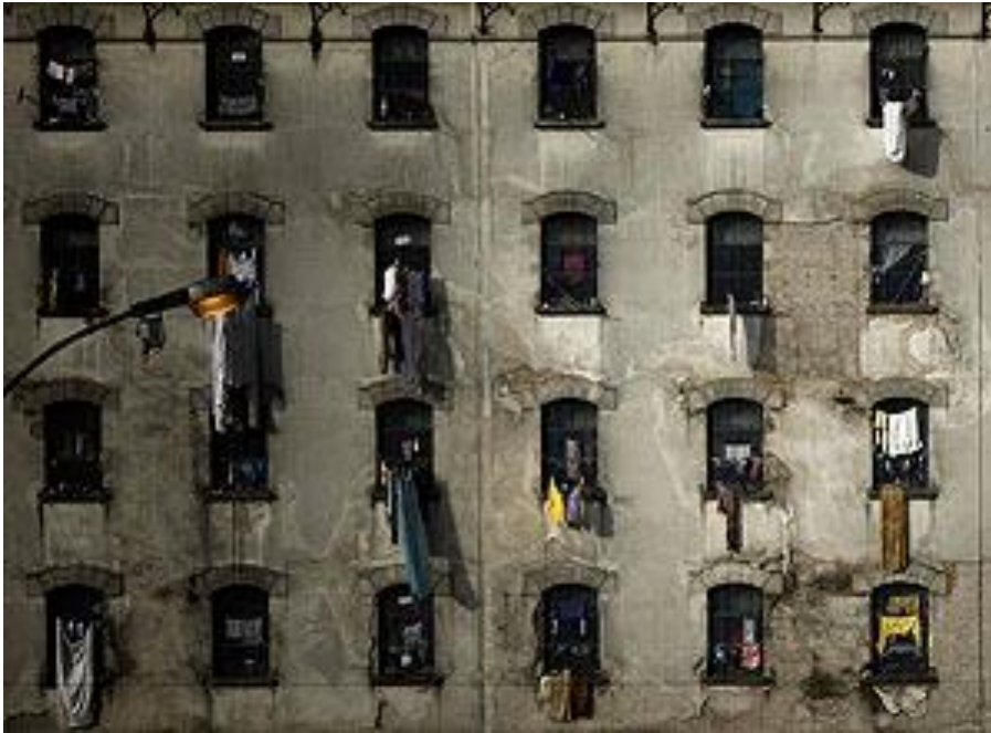
Penitenciária Feminina de Sant'Ana