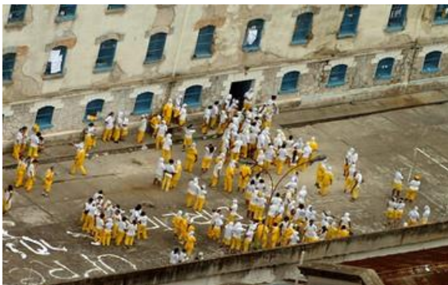
Penitenciária Feminina de Sant'Ana