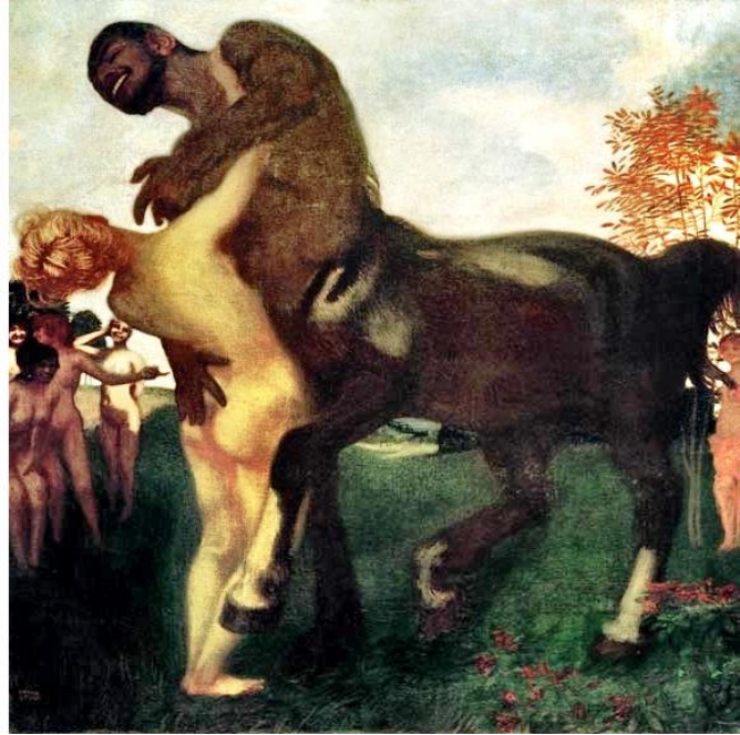
Centauro (1895) – Franz Von Stuck

O mundo é um nó em movimento. O determinismo biológico e cultural são ambas instâncias da concretude deslocada – ou seja, o erro de, em primeiro lugar, tomando abstrações categóricas provisórias e locais como “natureza” e “cultura” pelo mundo e, em segundo lugar, confundindo potentes consequências como sendo fundações pré-existentes. Não existem sujeitos e objetos pré-constituídos e nenhuma fonte simples, atores unitários ou extremidades finais. (HARAWAY, 2003, p. 4)