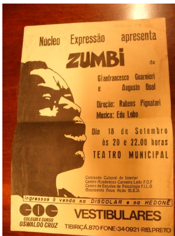
Imagem 1: Cartaz anunciando a peça Zumbi

pelo Núcleo Expressão apenas com o título de Zumbi. No dia da estreia, Gianfrancesco Guarnieri veio pessoalmente assistir. Quando a peça estreou no Teatro de Arena, em 1965, depois de um ano em cartaz, ela foi proibida e nunca mais havia sido encenada. O grupo osasquense resolveu comprar a briga e encenou a peça em 1976, dez anos depois da censura agir. Para tanto, dois censores vieram assistir a uma hora e 45 minutos de atuação e o resultado no dia seguinte, foi de aprovação. Os atores comemoraram e convidaram Guarnieri para ver. Ele veio e chorou de emoção ao ver o que tinha sido censurado 27 .