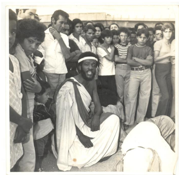
Imagem 3 : Apresentação da peça Um Homem chamado Jesus, Largo de Osasco, 1972