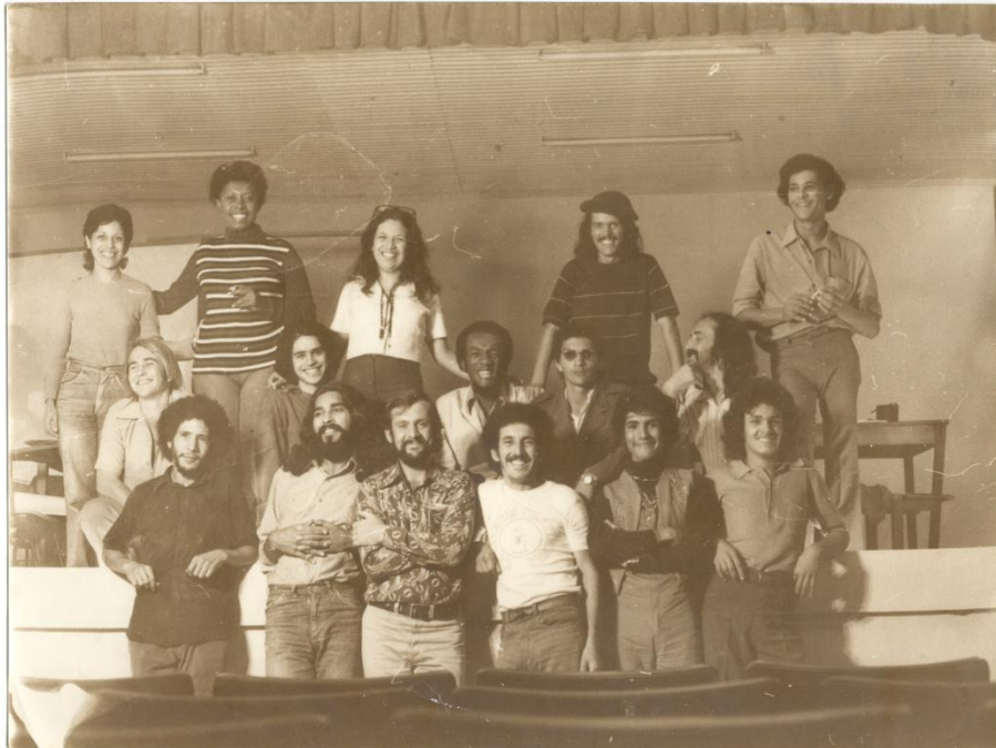
Imagem 5: Atores do Núcleo Expressão, Osasco, [197-], 1 foto : sépia ;18x24,1cm