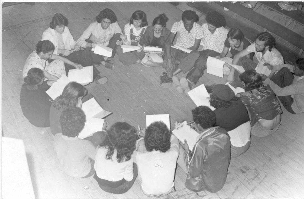
Imagem 6: Elenco da peça Morte e Vida Severina, Núcleo Expressão, Teatro Expressão, Osasco, 1975, 1 foto : p&b ; 11,7x18cm