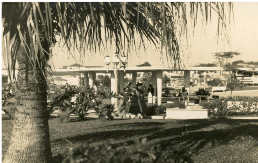
Imagem 12 - Em destaque, umas das principais instalações do Jardim Primeiro de Maio: a sua ilha central (que podia servir de coreto, segundo descrição apresentada na página anterior), sob a cobertura de uma pérgola de concreto armado

Alguns meses depois, mais precisamente no dia 25 de julho de 1954, o tão esperado logradouro foi inaugurado, por meio de um evento que contara com a presença de populares e de autoridades municipais. Dessa data em diante, não faltariam registros de enaltecimento a esse logradouro. Entre tais registros, destaca-se uma publicação de 1958 sobre os municípios do país, a partir da qual o Instituto Brasileiro de Geografia e Estatística (IBGE), ao referir-se a São Caetano do Sul, ressaltara a presença do Jardim Primeiro de Maio junto à paisagem da cidade, então “dominada pelas chaminés”. Conforme apontado na mencionada publicação, tal jardim sobressaía-se entre os logradouros públicos sul-são-caetanenses 366 .