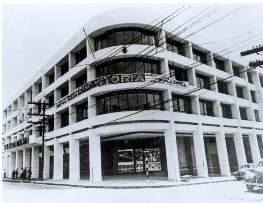
Imagem 14 - Edifício Vitória, empreendimento da família Dal'Mas. Inaugurado em 1953, foi transformado em um dos símbolos do progresso sul-são-caetanense, sobressaindo-se entre os prédios de modestas dimensões que então compunham a paisagem urbana da localidade. Além de uma sala de cinema, abrigou instituições conhecidas da cena sociocultural da cidade. Antes da inauguração do Paço Municipal da Avenida Goiás, n. 600, ocorrida em março de 1961, servira de sede para os três poderes municipais. No pavilhão superior de sua fachada, destaca-se o brasão do município

À sua presença na cenografia urbana da cidade soma-se o fato de ter se firmado como o centro da vida política e sociocultural de São Caetano, uma vez que nele tiveram acolhida os três poderes da municipalidade e instituições recreativas e culturais, como o Clube Comercial e a Acascs, que ficaram bastante conhecidas na localidade por conta de suas concorridas programações, como os famosos bailes 401 . Isso sem falar do Cine Vitória, que se impôs como a grande referência do edifício.