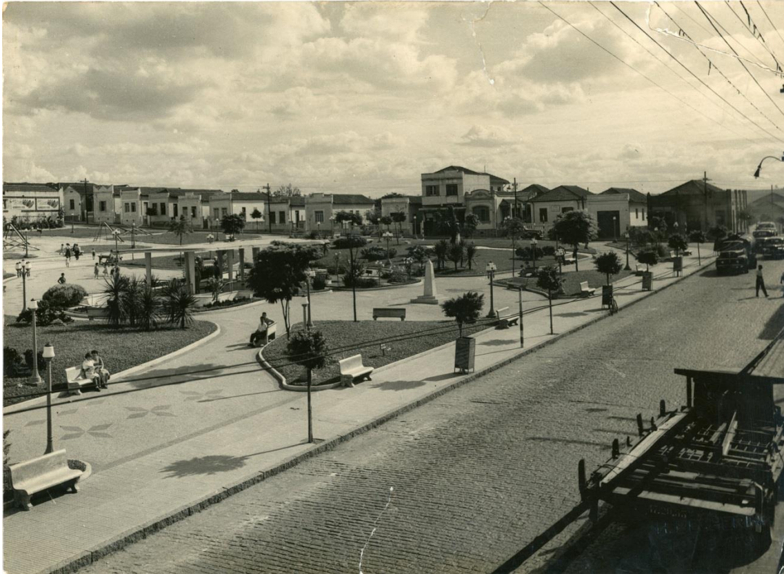
Imagem 13 - Aspecto parcial do Jardim Público Primeiro de Maio, em foto da segunda metade da década de 1950. À direita, a Avenida Goiás (ainda com pista única), e, ao fundo, a Rua Manoel Coelho. Sob o conceito de praça-jardim, firmou-se como símbolo de uma São Caetano voltada para a promoção de uma estética cidadina que tinha no bucolismo e na salubridade as suas molas mestras