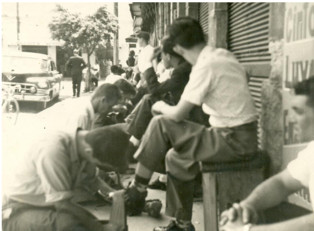
Imagem 18 - Engraxates na Avenida Conde Francisco Matarazzo, uma das vias principais da região central de São Caetano

presença incômoda e indesejada junto às vias do centro da localidade. Daí ter sido essa questão, de caráter social, abordada pela maioria dos artigos a respeito pela perspectiva da coerção e do enquadramento. A ideia segundo a qual a rua, enquanto palco de atuação dos engraxates, seria uma “escola de maus costumes” ou de “tendência para o crime” 478 permeia as discussões aventadas, servindo de justificativa para a defesa de posicionamentos truculentos e de controle severo frente a eles.