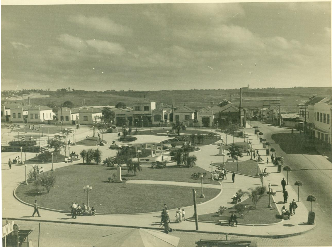
Imagem 11 - Jardim Público Primeiro de Maio em imagem panorâmica de 1955. Foi o pioneiro do gênero na localidade. Acervo/Fundação Pró-Memória de São Caetano do Sul

Em razão das condições higiênicas precárias, agravadas pela incipiente rede de esgoto e serviços deficitários de coleta de lixo e limpeza das vias públicas, São Caetano tornou-se foco potencial de epidemias e moléstias. Diante desse prognóstico nada lisonjeiro, uma série de medidas em prol do sanitarismo público foi adotada na cidade, de modo mais amplo e incisivo a partir de 1953.