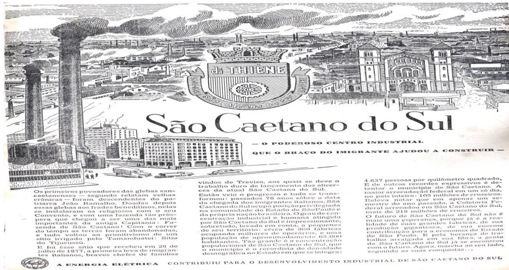
Imagem 07 - Informe publicitário da antiga Light publicado pelo Jornal de São Caetano na edição que divulgara o último texto do bloco cuja transcrição iniciou-se na página anterior

de trabalho arraigada em sua fibra, a gente de São Caetano do Sul já se encontrou com o futuro. 185