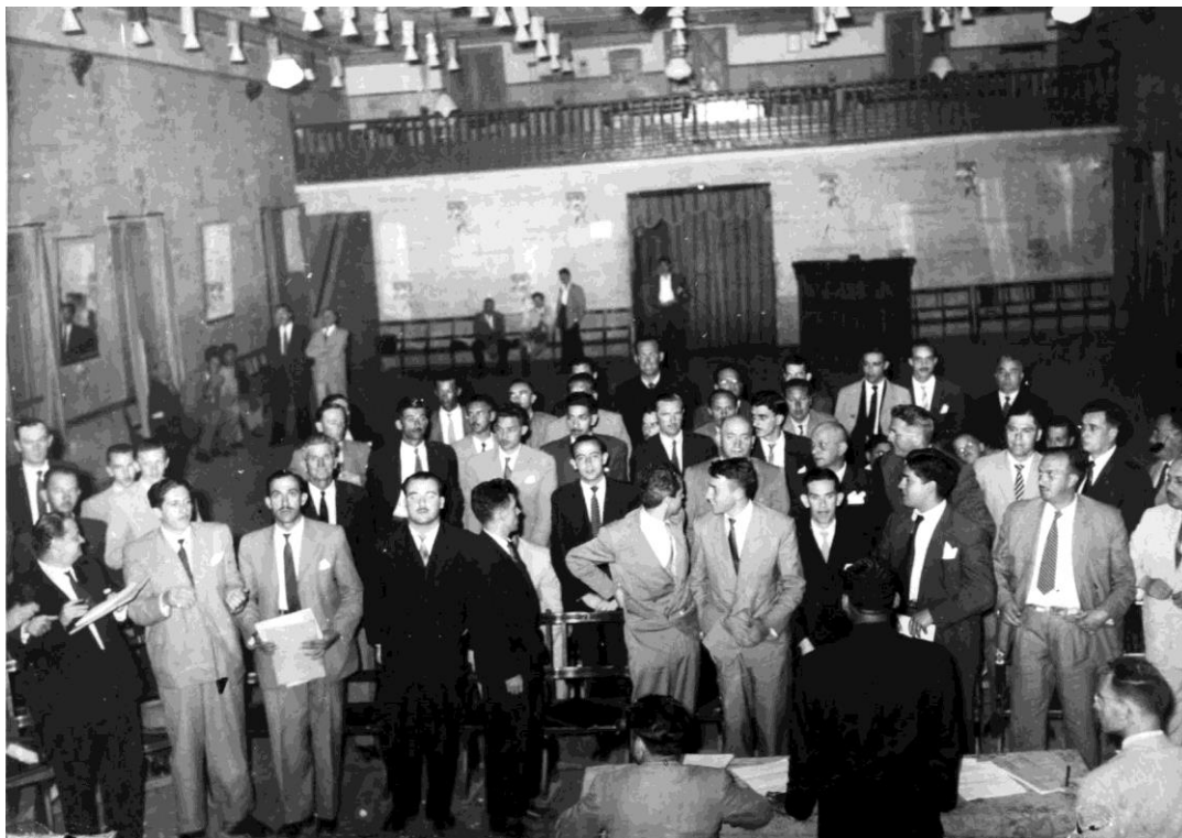
Imagem 02 - Assembleia da Sociedade dos Amigos de São Caetano, realizada no início de 1948, na sede do São Caetano Esporte Clube (então localizada na Rua Perrella). A reunião teve como pauta a discussão do apoio ao movimento autonomista, após solicitação encaminhada formalmente pelo Jornal de São Caetano à diretoria da entidade. A maioria dos associados votou a favor da adesão

De acordo com a Lei Organica é necessário enviar à Assembléia Legislativa Estadual uma representação assinada por 10% da população local, solicitando o plebiscito. 99