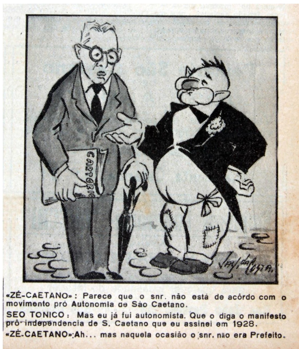
Imagem 05 - Crédito/ Jornal de São Caetano , ano II, n. 46, primeira página, 18 abr. 1948 Acervo/Fundação Pró-Memória de São Caetano do Sul Reprodução fotográfica/Antônio Reginaldo Canhoni (Fundação Pró-Memória de São Caetano do Sul)

“Zé Caetano”, com a sua vestimenta desarmoniosa, firmou-se como a síntese figurativa da realidade contrastante sob a qual vivia São Caetano, em fins da década de 1940: poder econômico, de um lado, e precárias condições urbanas, por outro. Em várias charges publicadas em edições de 1948 do Jornal de São Caetano , o personagem idealizado por Jayme da Costa Patrão aparece em diálogos com Antônio Fláquer, prefeito de Santo André (referenciado, irreverentemente, como seo Tônico – vide imagens na sequência); e outros nomes do segmento opositor da autonomia, como alguns vereadores da Câmara andreense, em uma alusão irônica e contestadora a acontecimentos observados ao longo da campanha, no contexto dos embates entre autonomistas e seus opositores.