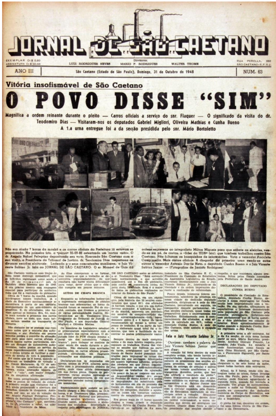
Imagem 03 - Primeira página da edição de 31 de outubro de 1948 do Jornal de São Caetano . A vitória autonomista foi comemorada efusivamente pelo periódico, o grande articulador da causa e da campanha em prol da emancipação da cidade

líderes, e a compor o cabedal de representações que alimentou o imaginário social e a memória do referido movimento na localidade, em uma emaranhada trama de percepções, interesses e utopias.