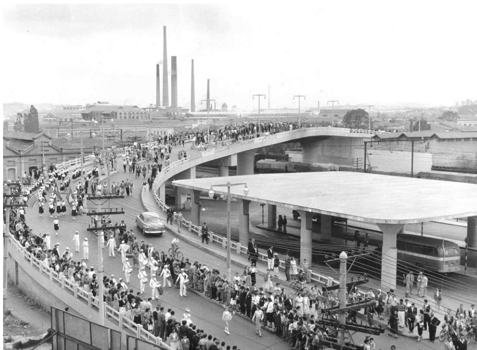
Imagem 09 - Inauguração do Viaduto dos Autonomistas, no dia 28 de julho de 1954. Além de contar com a presença de autoridades políticas, o evento foi marcado por um extenso desfile, o que lhe concedeu solenidade e pompa. Uma inauguração “apoteótica”, nas palavras do Jornal de São Caetano , fazendo jus ao significado grandioso atribuído à obra

A imagem reproduzida a seguir, que destaca a cerimônia que marcara esse evento de inauguração, também confere visibilidade a um cenário no qual inúmeras chaminés atestam o progresso industrial da cidade.