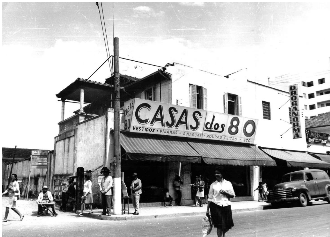
Imagem 19 - Ambulante sentado junto à sua pequena banca na Avenida Conde Francisco Matarazzo, em foto da década de 1950. Na imagem, ressaltou-se a movimentação de pedestres

Em 1956, o jornal publicou uma extensa reportagem de Oto Diringer a respeito da circulação de vendedores ambulantes pelas ruas locais. Tratados pela reportagem em questão como “comerciantes de mentira”, a mesma, por meio da desconstrução que realiza junto àqueles vendedores, procura desqualificá-los e deslegitimar suas ações, estratégias e investidas no comércio de São Caetano.