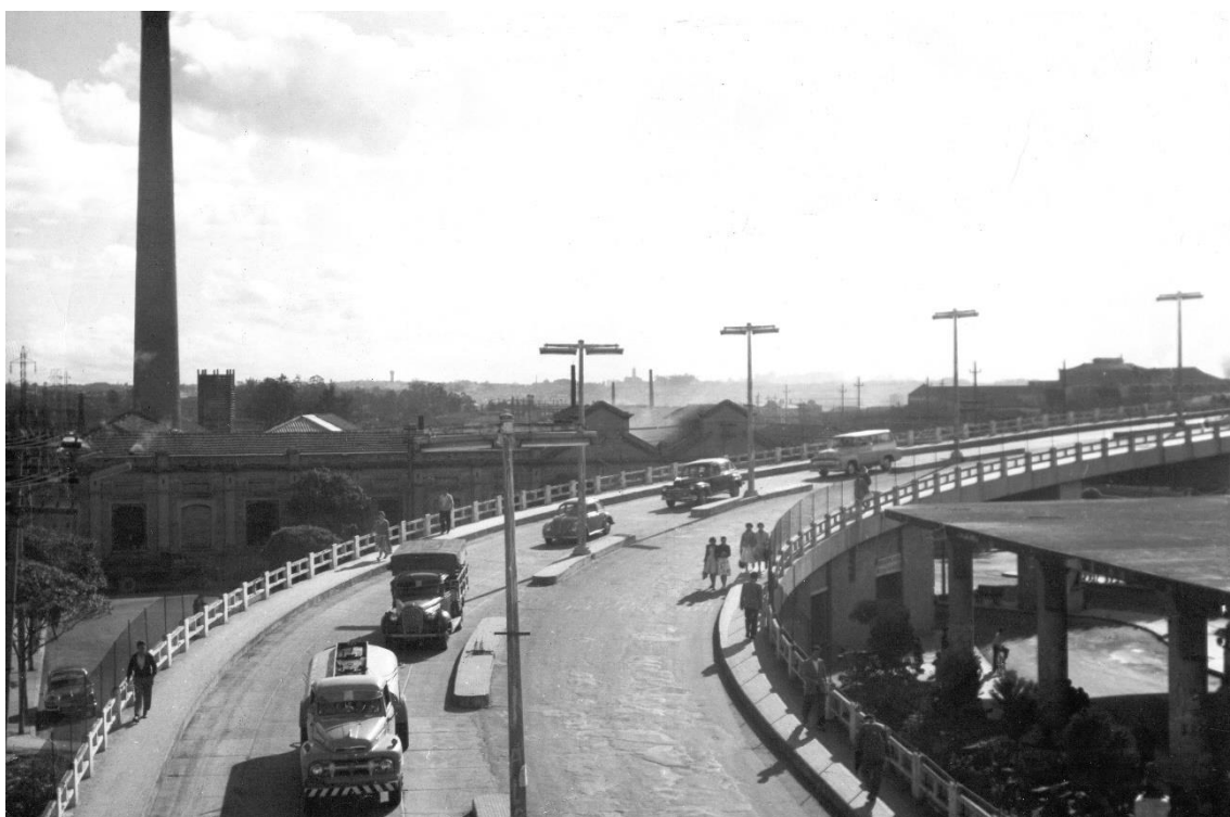
Imagem 10 - Viaduto dos Autonomistas já aberto ao tráfego. A abertura ocorreu no dia 13 de novembro de 1954. À direita, aspecto parcial da Estação Rodoviária Presidente Vargas, construída em conjunto com o viaduto

Um dos mais antigos problemas do Município era, sem duvida, a ligação entre o Bairro da Fundação e a parte alta da cidade, separados pelos trilhos da Estrada de Ferro Santos a Jundiáí cujas porteiras constituíam um pesadelo semelhante ao causado pelas porteiras do Brás. O monumental Viaduto dos Autonomistas veio resolver o problema. 310