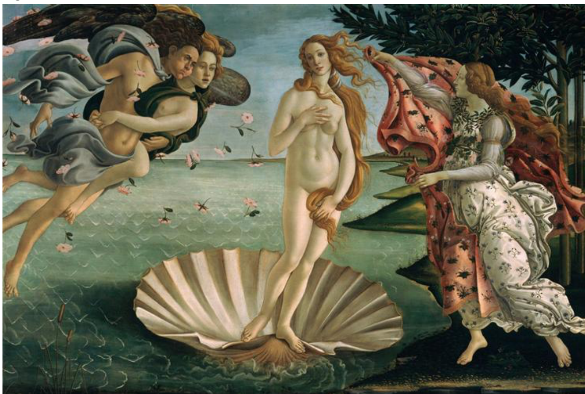
Figura 2 – O Nascimento de Vênus