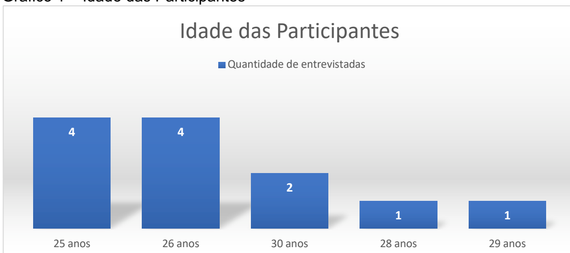
Gráfico 1 – Idade das Participantes

Visto que o total de participantes atingiu o número máximo previsto (12), optou-se por elaborar três gráficos com a descrição mais objetiva das características das entrevistadas, para que as semelhanças e diferenças entre elas fiquem expressas de forma mais clara. Já o Quadro 01 contém informações sobre: se atualmente pratica o sexo sem compromisso, por quanto tempo praticou sexo sem compromisso e qual é ou era a frequência que pratica(va).