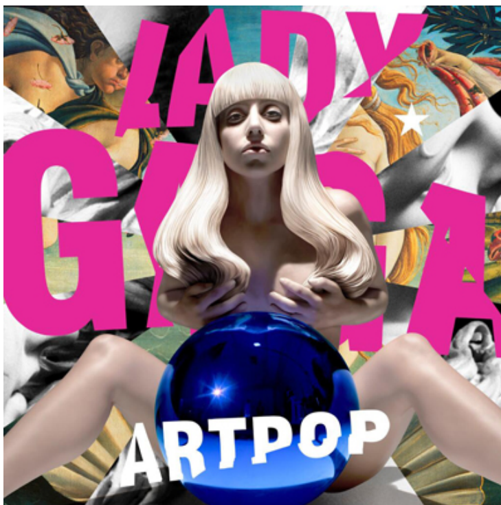
Figura 1 – Lady Gaga

Vale ressaltar que, mesmo com as experiências desprazerosas contadas ao longo das entrevistas, todos os símbolos escolhidos pelas participantes vieram de suas vivências prazerosas. Por exemplo, as cantoras Lady Gaga e Anitta 11 foram retratadas como mulheres independentes, autênticas, que não se preocupam com a opinião dos outros e são símbolos da liberdade sexual feminina. Já as personagens protagonistas de séries — Malu e Samantha — foram vistas como imagens de mulheres livres, espontâneas, corajosas e empoderadas.