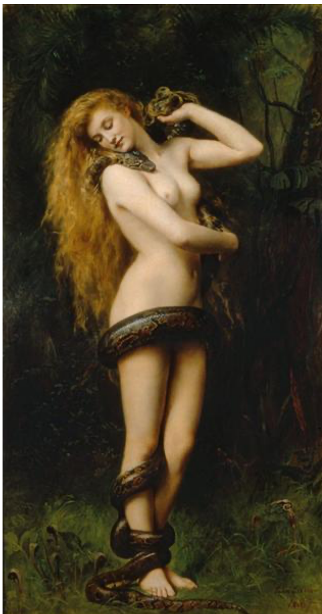
Figura 3 – Lilith com uma cobra