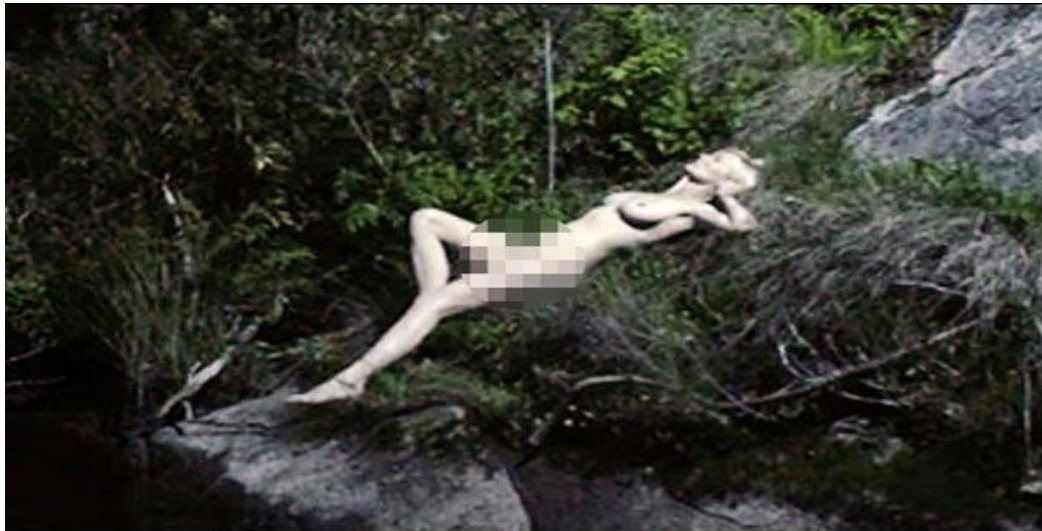
Figura 10 – Cena do filme Melancholia: Justine em relação direta com a natureza.

Engana-se quem vê o sexo apenas a busca de um desejo externo ao sujeito desejante, pois a escolha desse objeto 'responde à interioridade do desejo'. (...) No limite, o movimento do erotismo tem sempre o mesmo fim, implicando uma convulsão interior, não importa se motivado pelo desejo sexual, pela paixão amorosa ou pela fé religiosa (2014, p. 311, grifo do autor).