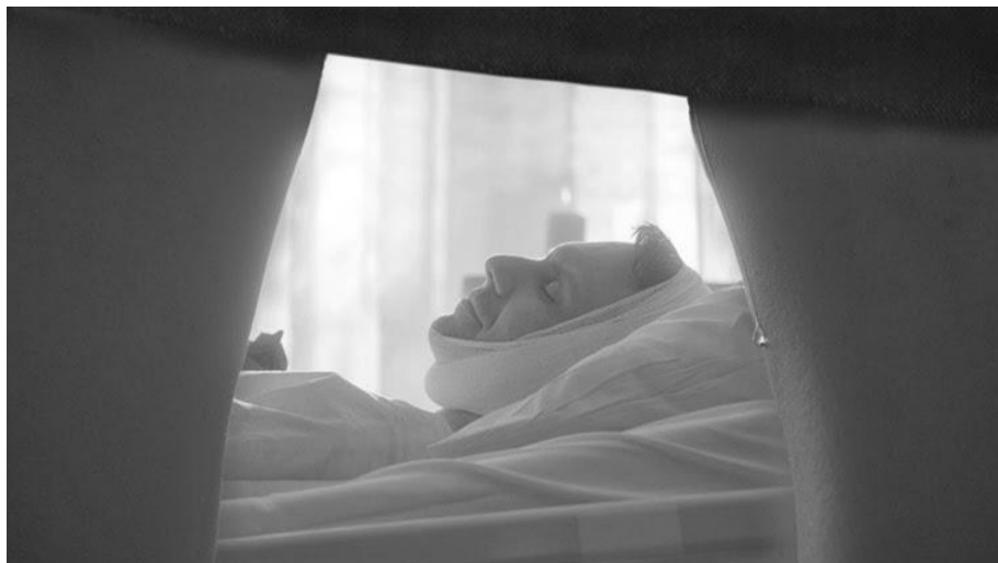
Figura 11 – Cena do filme Ninfomaníaca : Joe observa leito de morte do pai.

Ancoramos as nossas seguranças nos hábitos cotidianos. A natureza hostil representa a saída deste setor aconchegante que o trabalho proporcionou. Ela é o sagrado, o divino. Relacionar-se com ela eroticamente é sacroprofano. E ela se estende por outras transgressões como na infância de uma ninfomaníaca em relação ao seu pai. Sim, LVT não cessa suas perversões. Todo ensinamento paterno em Ninfomaníaca parte do conhecimento, como hobby , da botânica das folhas. Como vulvas, germinam naturalmente e suas sementes e detalhes são observados com o fascínio e encantamento de uma criança seduzida. LVT deixa bem clara essa relação paterna na cena da morte do pai de Joe, ainda na fase adolescente. No enquadramento, como um pintura, centraliza o leito de morte e utiliza as pernas da filha como moldura. E um pequeno detalhe de uma gota escorrendo pela coxa, como uma lágrima, revela o orgasmo (Figura 11):