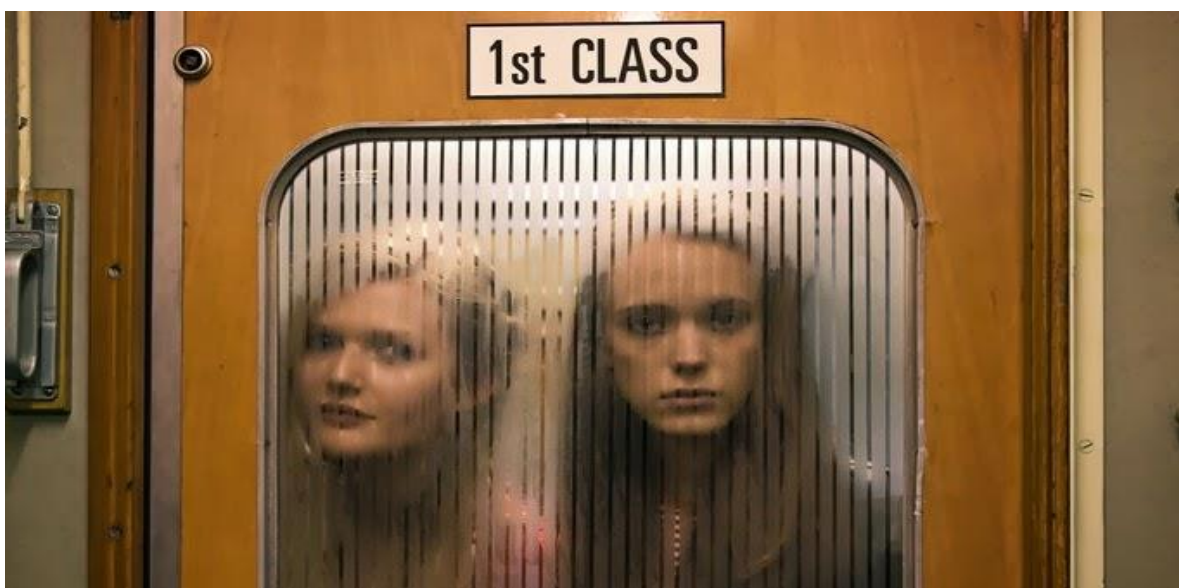
Figura 6 – Cena das ninfomaníacas “pescando” passageiros no trem por um pacote de chocolate. Filme “Ninfomaníaca” (2013)

(...) a morte, sendo a destruição de um ser descontínuo, não toca em nada na continuidade do ser, que existe fora de nós, geralmente. Não esqueço que, no desejo de imortalidade, o que entra em jogo é a preocupação de assegurar a sobrevivência na descontinuidade – a sobrevivência do ser pessoal – mas deixo a questão de lado. Insisto no fato de que, a continuidade do ser estando na origem dos seres, a morte não a atinge, a continuidade do ser independe dela, e mesmo, ao contrário, a morte a manifesta . Esse pensamento, me parece, deve ser a base da interpretação do sacrifício religioso, a que, como disse a pouco, a ação erótica é comparável (BATAILLE, 2014, p. 45, grifos do autor).