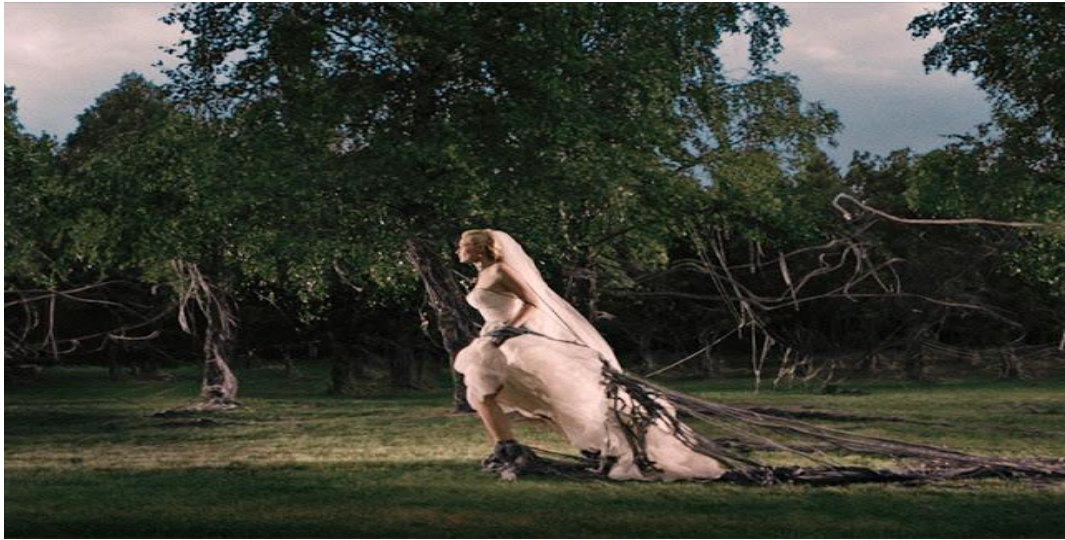
Figura 9 – Cena do prólogo de Melancholia: caminhada em super câmera lenta

se aproxima. Sentimos que o poder da natureza é incomensurável. Esse é um símbolo forte em LVT. O poder da natureza é insuperável, porém, transformador. E a sensualidade das cenas da noiva em contato direto com a natureza se dá pelas reações de ambos. Prazer ao humano e respostas como chuva, rio, granizo e vento pela natureza.