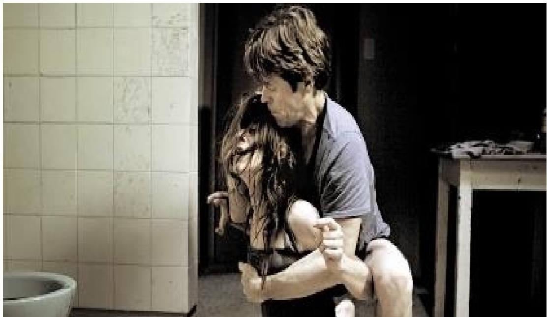
Figura 5 – Em Anticristo , os personagens ELE e ELA formam um casal que entra em constante atrito físico.

utilizados com seus elencos, como estímulos a partir de provocações reais, os resultados das atuações nos seus filmes costumam, aliás, ser reconhecidos como representações irrepreensíveis no sentido de entrega e dedicação do elenco, logrando, inclusive, muitos prêmios nesse quesito. Charlotte Gainsbourg, atriz presente nos três filmes da Trilogia da Depressão, revela que, nos dias de gravação, não eram definidas as cenas que seriam filmadas e nem um roteiro detalhado era disponibilizado aos atores, que tinham liberdade de improvisar falas se quisessem. Muitas lacunas os atores completavam de acordo com estímulos do diretor no momento da gravação (2014). Esse desconforto proposital pode não trazer empatias pessoais, mas consegue efeitos qualitativos nas representações. A sensação permanente de insegurança levada aos intérpretes conduz a uma atenção total ao foco da cena. O clima torna-se tenso e o resultado intenso.