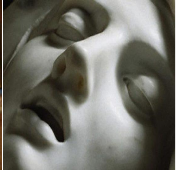
Figura 4 – Detalhes das expressões do rosto