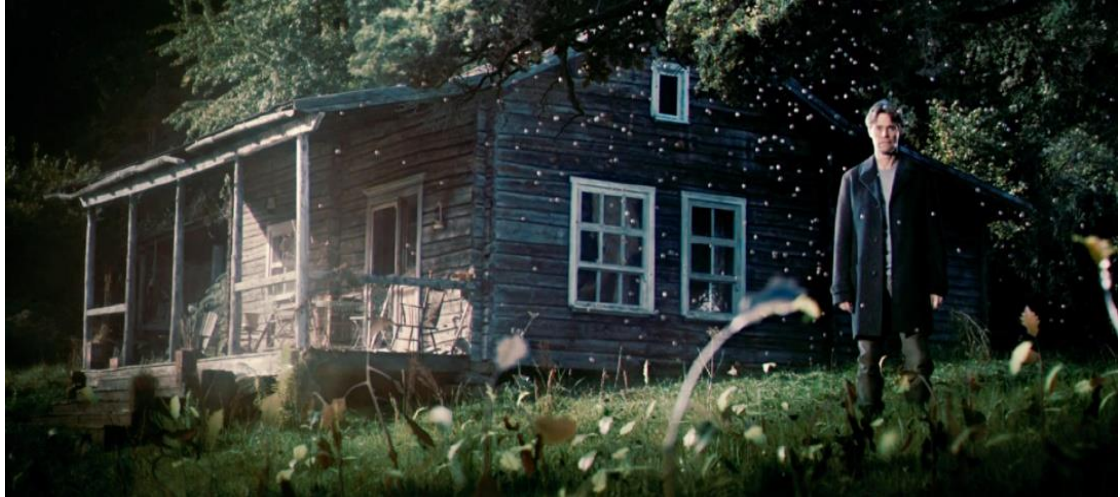
Figura 1 – Cena da cabana em Anticristo: a natureza literalmente fala, por meio de sons, nas cenas dos filmes de LVT.

Fonte: https://images.app.goo.gl/hP1ha9TUofFxoMhQA