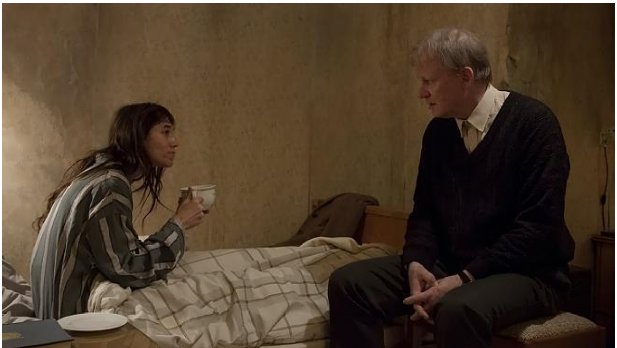
Figura 7 – A narradora Joe é o avesso do erotismo de suas histórias.

Há um elemento fundamental: o fato objetivo da reprodução coloca em jogo no plano da interioridade o sentimento de si, aquele do ser e dos limites do ser isolado. Coloca em jogo a descontinuidade a que se liga necessariamente o sentimento de si porque ela funda seus limites: o sentimento de si, mesmo que vago, é o sentimento de um ser descontínuo. Mas a descontinuidade nunca é perfeita. Na sexualidade, em particular, o sentimento dos outros, para além do sentimento de si, introduz entre dois ou vários uma continuidade possível que se opõe à descontinuidade primeira. Os outros, na sexualidade, não cessam de oferecer uma possibilidade de continuidade, os outros não cessam de ameaçar, de provocar um rasgão no vestido sem costura da descontinuidade individual (BATAILLE, 2014, p. 127).