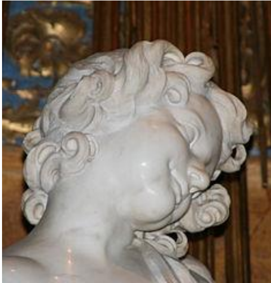
Figura 3 – Recorte do rosto do anjo da santa.

próprio Eros da mitologia profana. O sacroprofano de LVT amplia esse olhar para as possibilidades mais remotas, quase no ponto da loucura, de um ser exposto às atrocidades do mundo; nas nuances das ausências. Não sabemos nossa reação perante um tapa na cara repentino, sem preparação prévia. Os fantasmas, nesse instante, ficam prontos para se apresentarem. Estamos expostos ao tapa, mas não esperamos por ele.