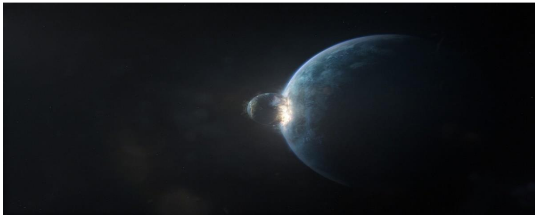
Figura 9 – Prólogo de Melancholia : O beijo mortal dos planetas.

Esse momento do fim pode ser encarado como recomeço de tudo. Qualitativamente, esse tempo ganha a dimensão do sagrado. O tempo que mantém a pureza do instante da Criação, o tempo primordial. É o tempo da purificação e da expurgação dos pecados. E o grande paradoxo desse reestabelecimento do tempo sagrado é que ele se dá por meio de rituais profanos. Temos aí a recuperação do momento mítico do surgimento da existência (ELIADE, 2010, p. 71). Trata-se do tempo sagrado na tentativa de um novo começo, sem o Mal.