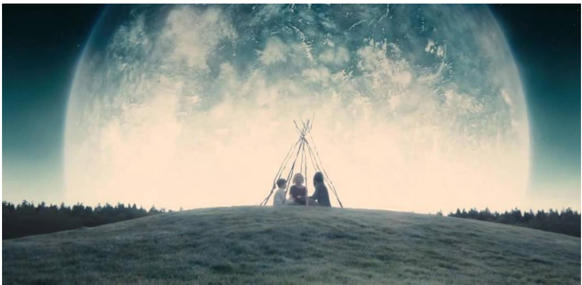
Fig. 20. Melancolia e o mundo próximo do fim

O sacroprofano se instaura nessa relação. O que era colocado como perturbação da ordem, o mal psicológico, torna-se o acalento dos seres no momento mais difícil que é encarar o fim. E quando aparece nesse contexto surge exacerbada como a maior qualidade possível que um ser humano pode ter. O fim dentro de um contexto material gerava o descontrole, mas, prestes ao fim material de tudo, é transformado em força, inteligência e coragem. Na cena final, Justine propõe a construção de uma cabana de proteção onde as irmãs e o sobrinho ficarão juntos, até o fim.