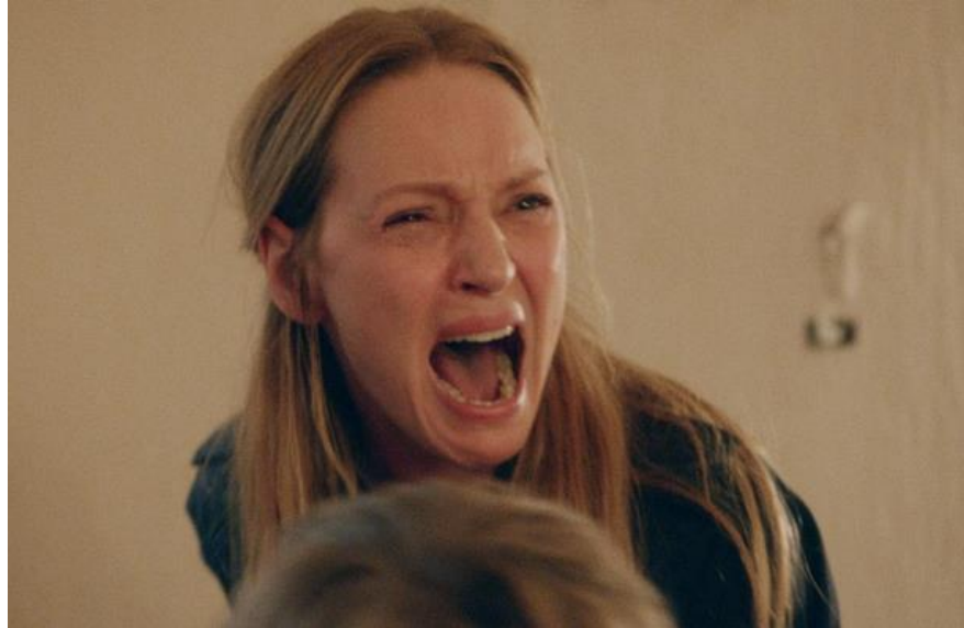
Figura 15 – Cena do filme Ninfomaníaca: Rosto de dor da mãe traída e abandonada.

Assim, em suma, na Trilogia da Depressão, os close-ups legitimam a estética sacroprofana das imagens ao possibilitar que tenhamos a experiência imagética das angústias amalgamadas do prazer e da dor como a expressão de pavor na descoberta do primeiro gozo.