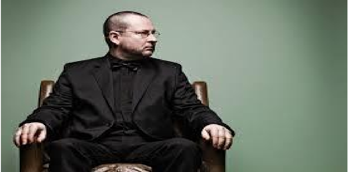
Fig. 17. LVT no estilo da personificação do Mal