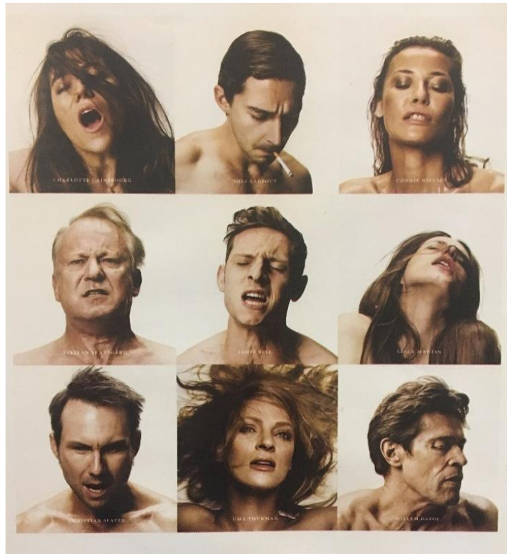
Figura 12 – Um dos cartazes do filme Ninfomaniaca: closes de orgasmos.

próprios medos. Por isso, o sacroprofano se manifesta no momento em que o criador e a criatura se coadunam.