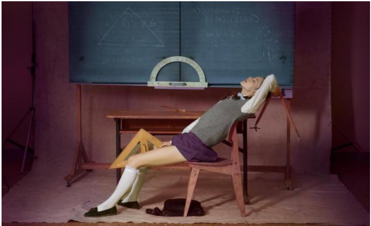
Fig. 21. Filme Ninfomaníaca repleto de fantasias sexuais e gráficos

interpretação mais autêntica do elenco simplesmente não definindo o que iria gravar no dia e nem com um roteiro detalhado das cenas. Muitas lacunas os atores improvisavam de acordo com estímulos do diretor no momento da gravação. Essa forma excêntrica, e não linear, de comandar o set de filmagem faz com que ele tenha atores de confiança sendo que muitos fiquem somente na primeira experiência.