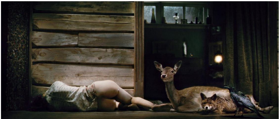
Fig. 19. Anticristo representado pelas três bestas

Como LVT escreve sobre suas experiências, o roteirista coloca a personagem Ele como sendo um psicanalista estruturalista que, para cada surto, tem uma técnica a ser aplicada. A primeira delas é fazer com que Ela enfrente seu maior medo que é reviver as últimas cenas com o filho numa cabana, isolada na natureza, onde ficaram sozinhos para a escrita de uma tese sobre feminicídio. Para se chegar na cabana eles enfrentam a natureza e, mais uma vez, a tentação do prazer aparece. Ela consegue se acalmar dos surtos por meio do sexo selvagem e Ele tenta resistir para manter o controle cognitivo mas, no final, sempre se entregam ao desejo carnal. A natureza celebra com um trio de animais que rondam o ambiente a todo momento: o corvo, o cervo e o lobo. É a nova configuração dos reis magos e que se embasam na alucinação de uma nova configuração celestial.