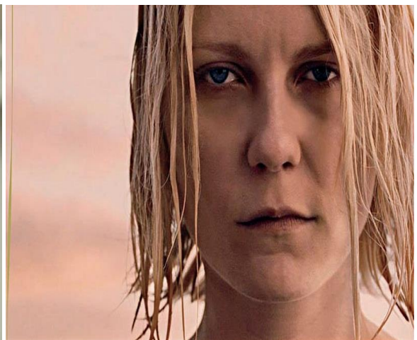
Figura 13 – Melancolia: Rosto de Justine em momento patológico. Figura 14 – Prólogo filme Melancolia: rosto de Justine