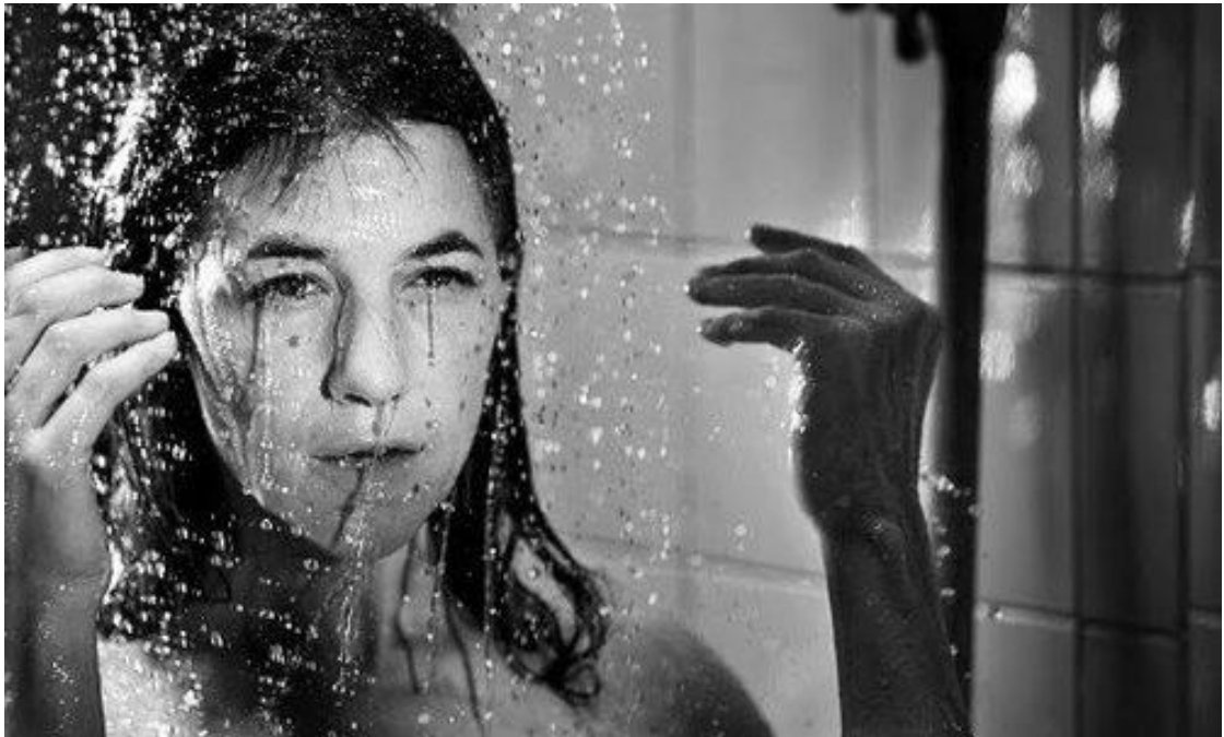
Figura 8 – Prólogo de Anticristo : Ela toma banho em super câmera lenta.

A finitude humana também não é solução. Isso porque o tempo de vida ganha outros contornos. LVT, em Anticristo , coloca o mundo regido pela missa negra. O mal é o que domina o mundo. A natureza é o mal. Assim, nem no fim irá encontrar a paz. A solução é viver, em dor, o que, neste novo contexto, traz sentido à vida como uma extensão do tempo numa suposta posição de sofrimento eterno nas profundezas do Mal. Essa foi a cena realizada em seu último filme após a Trilogia da Depressão: “A casa que Jack construiu”, de 2018, sobre um serial killer . As longas pausas, a falta de identidade das personagens e o ambiente fechado em que vivem, mostram uma possível tentativa de, no silêncio do tempo, fazer com que as vozes internas encontrem o antagonismo de tudo; nesse caso, resquícios do que seria o bem. Mas esse tempo é dado ao público. A escolha é de cada um.