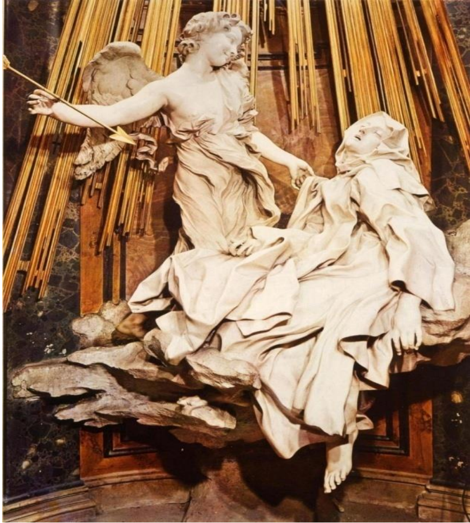
Figura 2 – Escultura “O Êxtase de Santa Teresa D’Avila” – Gian L. Bernini, 1652.

Veja-se a expressão da Santa Teresa D’Avila. No mesmo momento que significa desespero e dor, remete ao prazer do gozo. Essa ambiguidade, que os renascentistas já alcançavam com seu naturalismo, reflete aqui a complexidade do ser humano e deixa a obra mais longe do mármore e mais perto da carne. De fato, o artista possibilita que a escultura humana tenha as expressões de um riso de dor ou um choro de alegria, inclusive, a imagem demonstra a total possibilidade de previsão sobre qual seria o movimento posterior se fosse um ser vivo. Faz possível o movimento num quadro estático. Essa quebra lógica permite alcançar o âmago da alma humana.