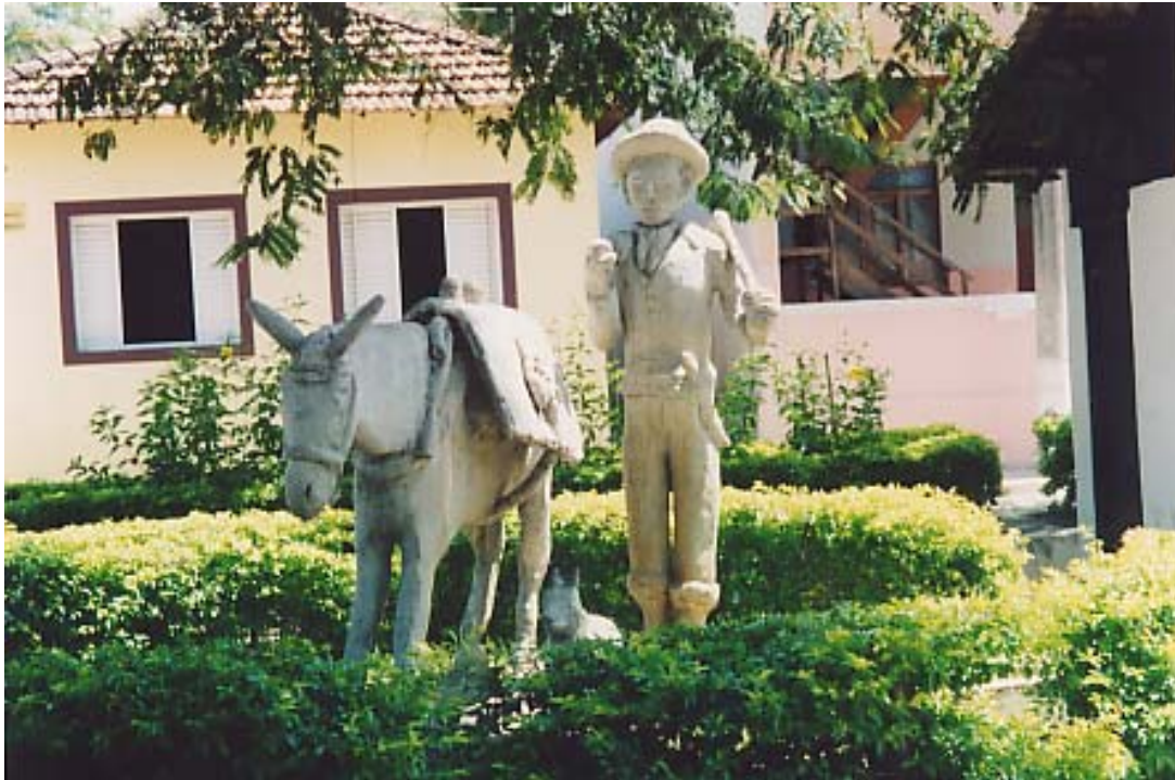
Figura 11: Praça do Tropeiro