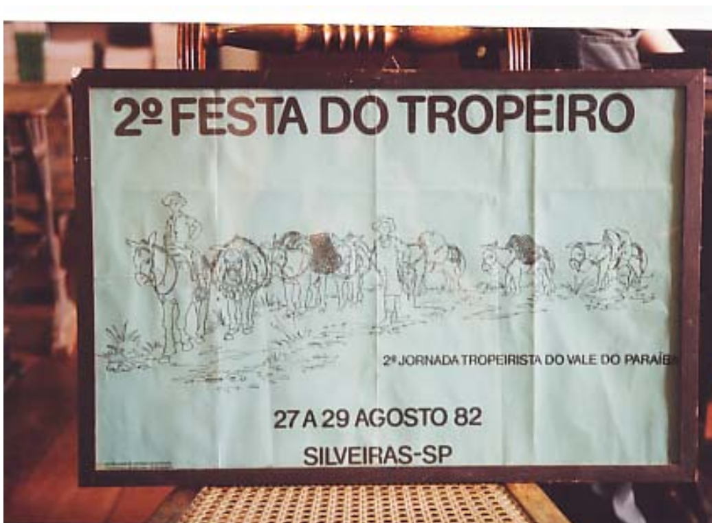
Figura 4: Cartaz da 2ª Festa do Tropeiro

Os cartazes de divulgação de 1981 a 1999 só diferem com relação à data, colaboradores e alguma atração acrescentada àquele ano. Com ilustrações de Tom Maia, todos representam uma tropa carregando mantimentos e guiada por tropeiros.