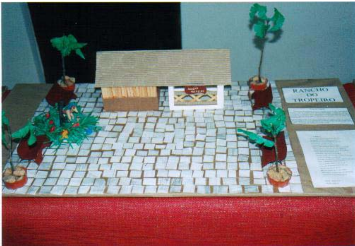
Figura 17: Exposição dos alunos de Silveiras na 24ª Festa do Tropeiro