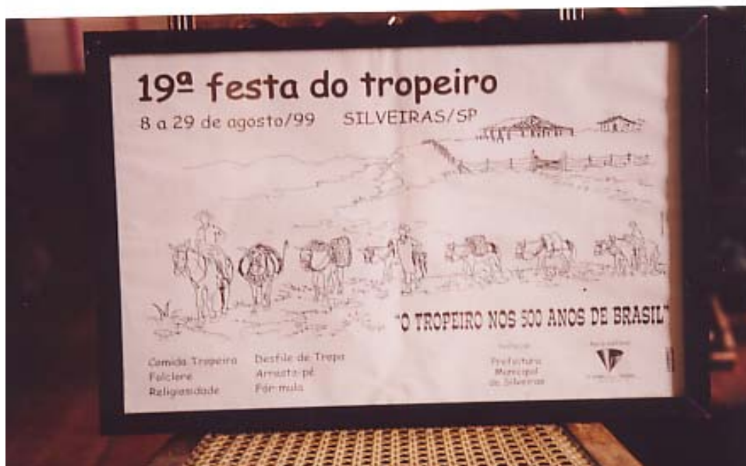
Figura 7: Cartaz da 19ª Festa do Tropeiro