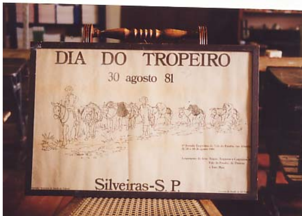
Figura 10: Cartaz da 1ª Festa do Tropeiro

Nesse mesmo período um grupo de moradores passou a promover um almoço tropeiro por mês, como uma confraternização entre amigos, que chamou a atenção de grande parcela da população. Diante desse fato, decidiu-se transformá-la numa data comemorativa para a cidade. Foi escolhido o último final de semana de agosto para celebrar o Dia do Tropeiro, nome dado à primeira manifestação promovida na cidade.