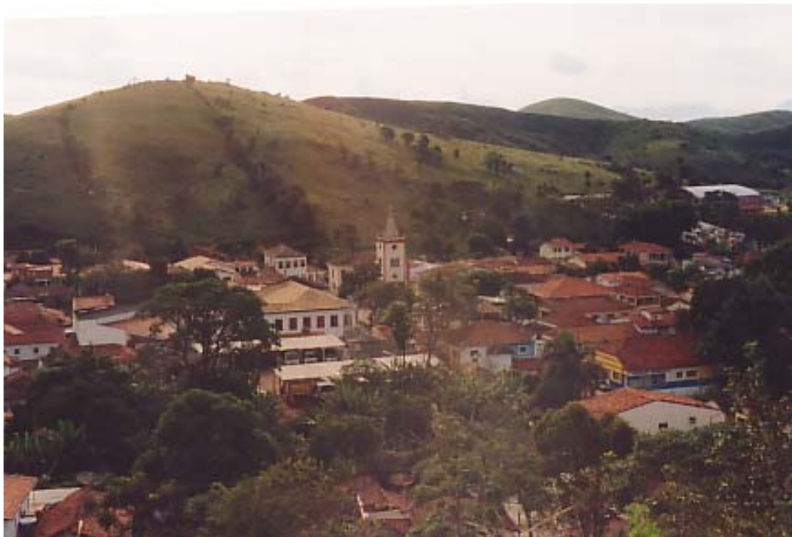
Figura 2: Centro de Silveiras

histórico e natural. Sabe-se que, em muitos casos, só se tombam os patrimônios tidos de grande representatividade. Em Silveiras, o único bem tombado é o casarão que pertenceu ao Capitão Manoel da Silveira, pois muito do que se pretendia recuperar ou restaurar se encontra em estado lastimável devido ao descaso político.