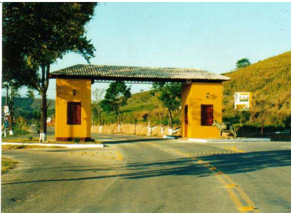
Figura 14: Portal de Silveiras

atinge um número maior de pessoas que compartilham a imagem de Silveiras como cidade dos tropeiros. O monumento está no portal de entrada da Rodovia dos Tropeiros (embora o início da rodovia não seja no portal), sendo visto por todos que visitam as outras cidades à margem da rodovia. Diferentemente dos demais espaços em homenagem ao tropeiro, este tem uma abrangência mais significativa.