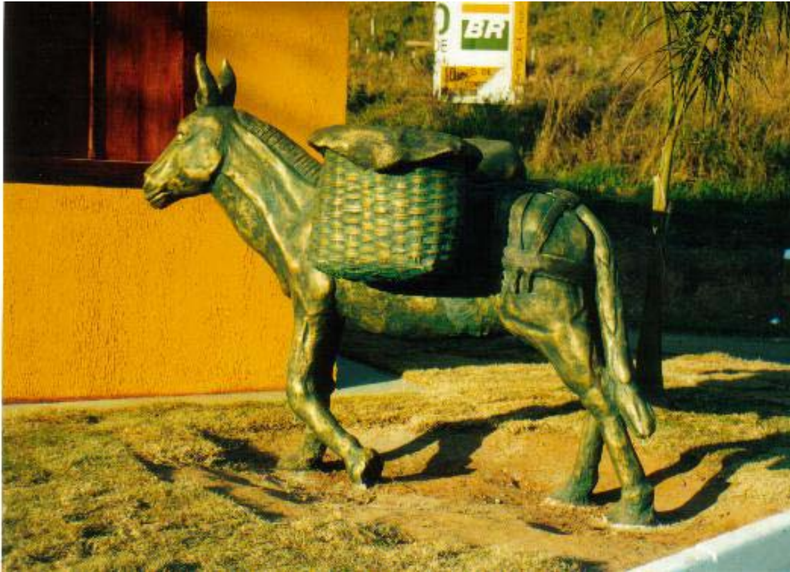
Figura 15: Monumento do portal