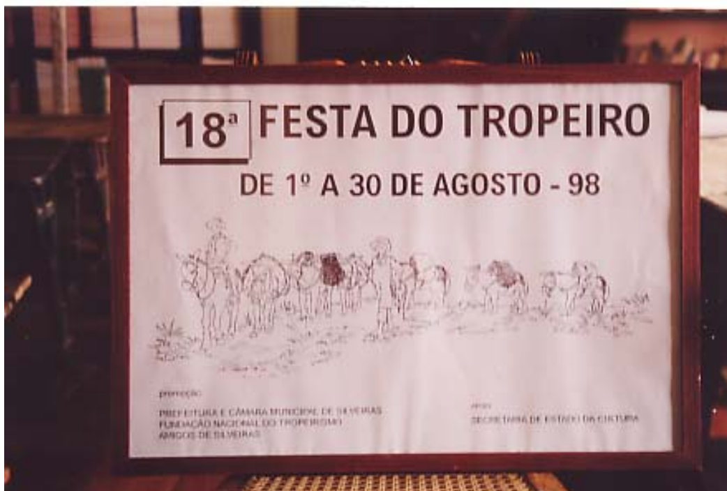
Figura 5: Cartaz da 18ª Festa do Tropeiro