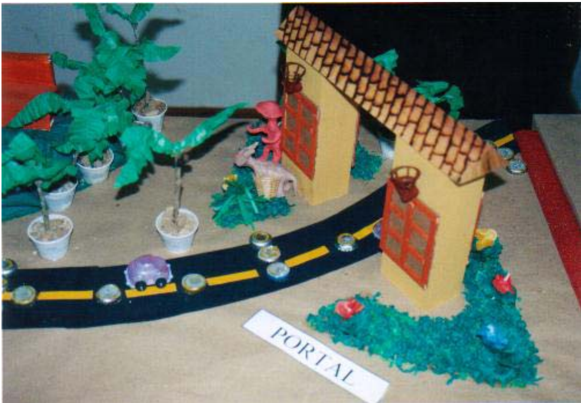
Figura 16: Exposição dos alunos de Silveiras na 24ª Festa do Tropeiro

alimentos recriam um universo que, embora “tradicional”, valoriza costumes ainda presentes na vida das crianças e jovens, proporciona uma vivência autêntica, que é reconhecida pelos seus participantes. A manufatura dos brinquedos trabalha com a dimensão lúdica da criança, produzindo de uma memória individual e comum, pois foi vivenciada e compartilhada com os pais e colegas. Assim, a exposição, na festa de 2004, envolve o sentimento de reconhecimento, compartilhado com um grupo maior, moradores de Silveiras e visitantes. Dessa forma, a imagem de Silveiras como uma cidade com “alma” tropeira ultrapassa os limites do município.