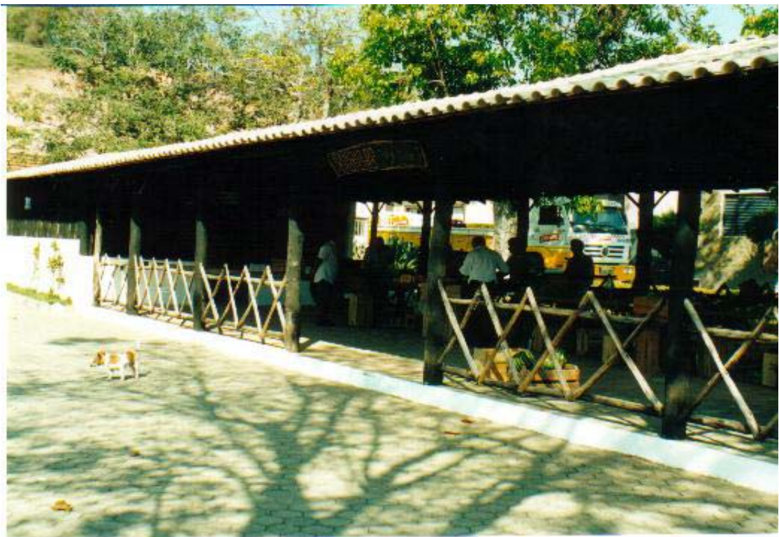
Figura 12: Rancho do Tropeiro