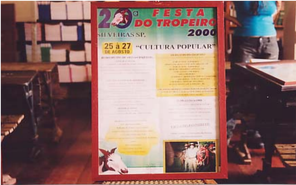
Figura 8: Cartaz da 20ª Festa do Tropeiro