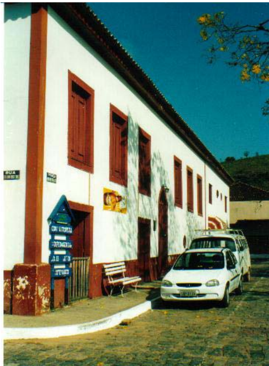
Figura 13: Casarão do Tropeiro