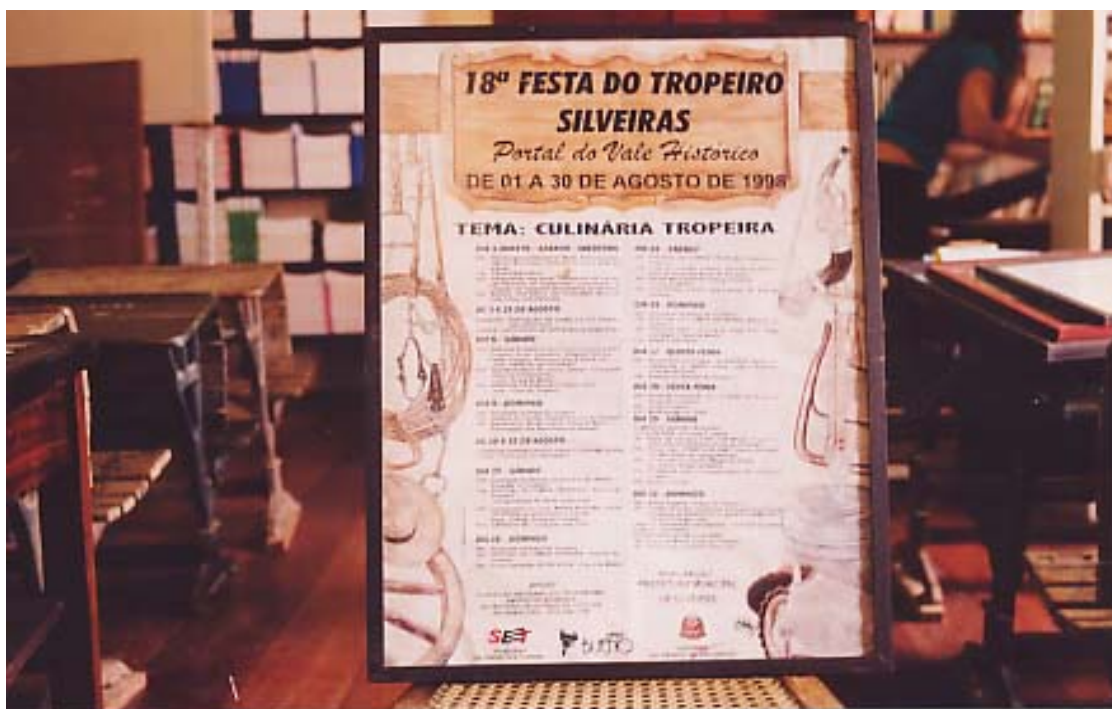
Figura 6: Cartaz da programação da Festa