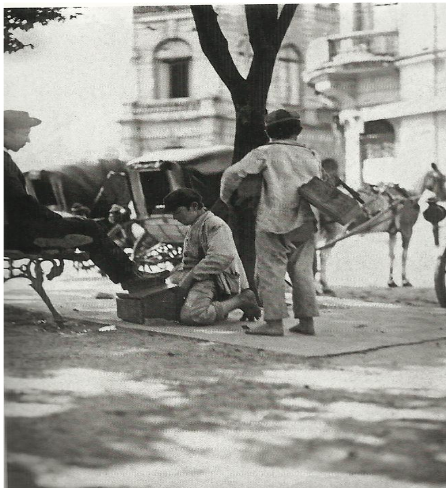
Imagem 16 – Meninos engraxates no Largo São Bento 1910. (PASTORE, 2009).

Pelas fotografias, pode-se inferir que o cotidiano dos meninos engraxates poderia ser perpassado pelo trabalho e também pelo brincar. O fato de serem trabalhadores autônomos lhes permitia uma liberdade, uma disciplina menos rígida, ou a completa falta desta, caso os pais não cobrassem o trabalho dos filhos e lhes proporcionava momentos de brincadeira, como se vê nas imagens 14 e 15, em que os meninos estão brincando de bolinha de gude. Esses pequenos trabalhadores ambulantes se reuniam para jogar, ou para experimentar outras sensações, como na imagem 13, em que se tem a impressão de que os dois garotos estão fumando. No clássico trabalho História Social da Criança e da Família , ÀRIES 2011, detecta-se que as crianças dos camponeses, dos artesãos, dos operários, ou seja, as crianças pobres continuam tendo suas vidas junto aos adultos, mesmo com o surgimento da ideia ou conceito de infância no século XVIII, não sendo possível uma separação visível, seja do ponto de vista do trabalho, dos trajés ou mesmo das