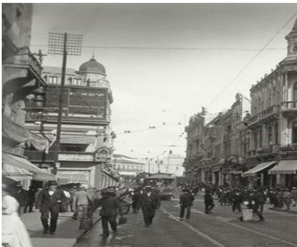
Imagem 11 - ampliada