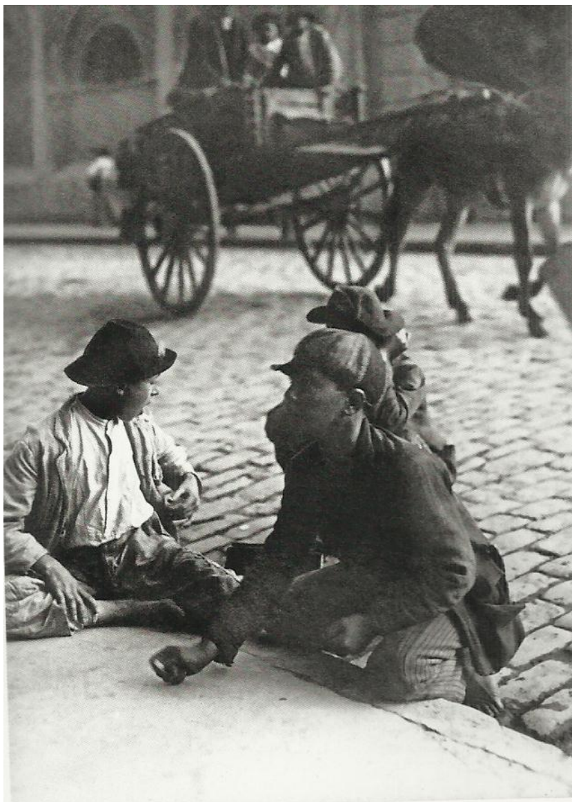
Imagem 15 – Meninos jogando bola de gude na Praça da Sé 1910. (PASTORE, 2009).