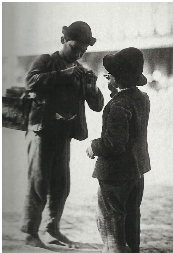
Imagem 13 – Meninos engraxates em frente a Estação da Luz, 1910 (PASTORE, 2009).