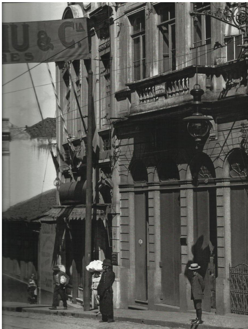
Imagem 10 - Rua Líbero Badaró, 1912. (BECHERINI, 2009, p. 101).