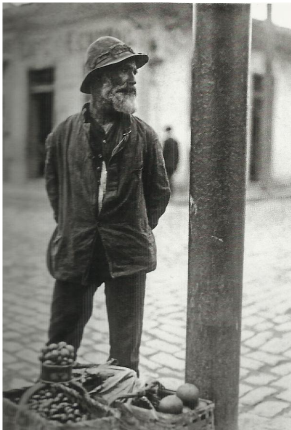
Imagem 6 - Homem com cestas de frutas no chão, 1910. (PASTORE, 2009).