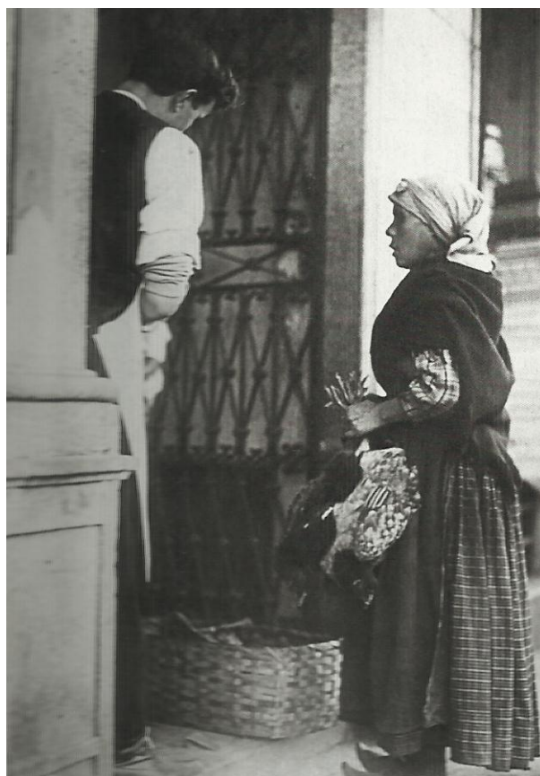
Imagem 18 - Vendedora ambulante em frente a estabelecimento comercial – 1910.

trabalham na região. A presença do vendedor ambulante de vassouras nessa região indica que os comerciantes estabelecidos poderiam ser seus fregueses, principalmente no caso desse tipo de ambulante, que vende um item indispensável para a limpeza e a higiene dos estabelecimentos comerciais. A imagem 18, abaixo, corrobora a ideia de que os comerciantes estabelecidos compravam mercadorias dos ambulantes.