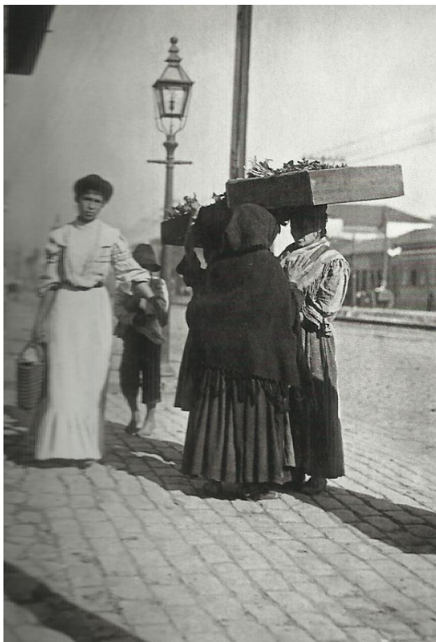
Imagem 8 - Vendedoras de verduras e mulher voltando das compras em região próxima ao mercado dos Caipiras – 1910. (PASTORE, 2009).