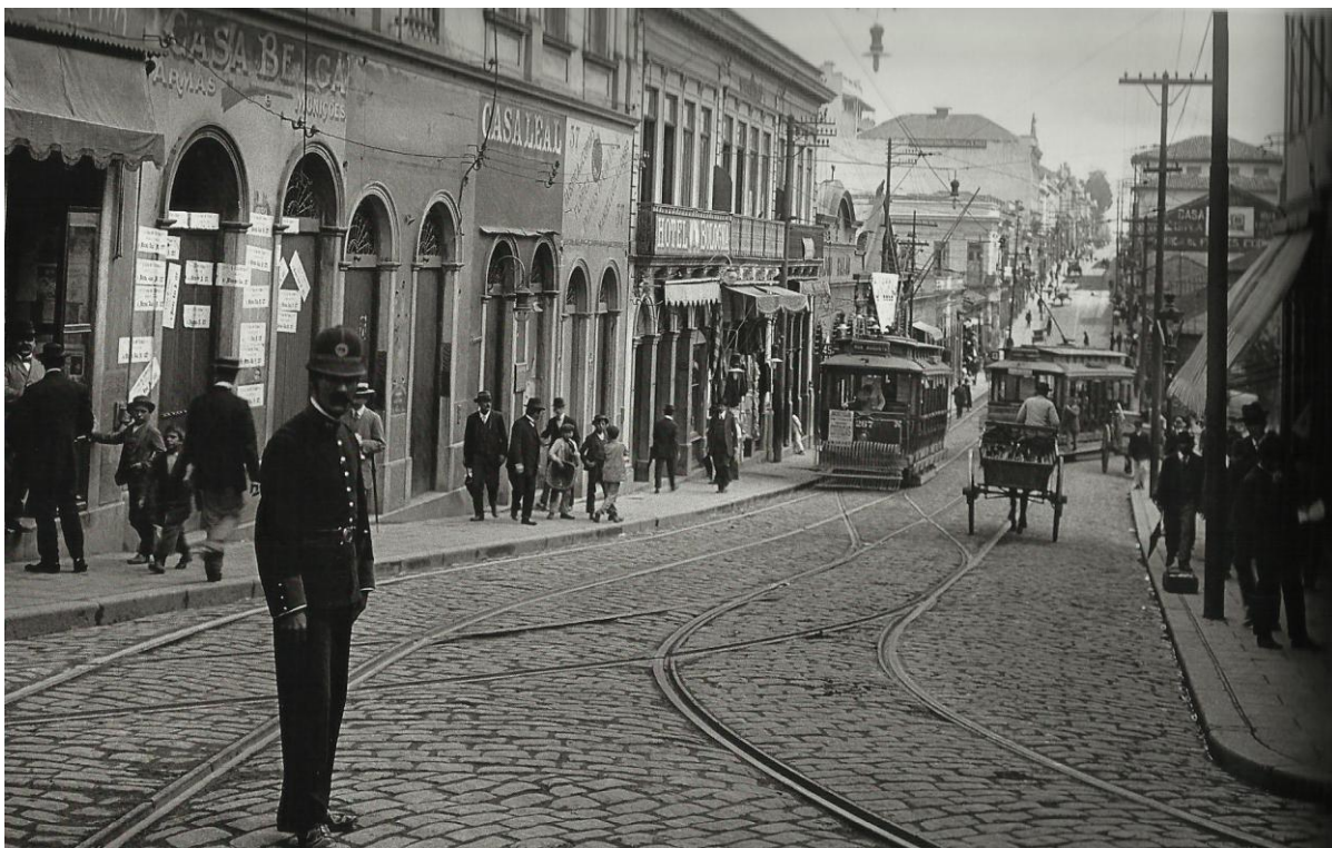
Imagem 1 - Rua de São João em direção ao Largo do Paissandu, 1908. (BECHERINI, 2009, p. 172).