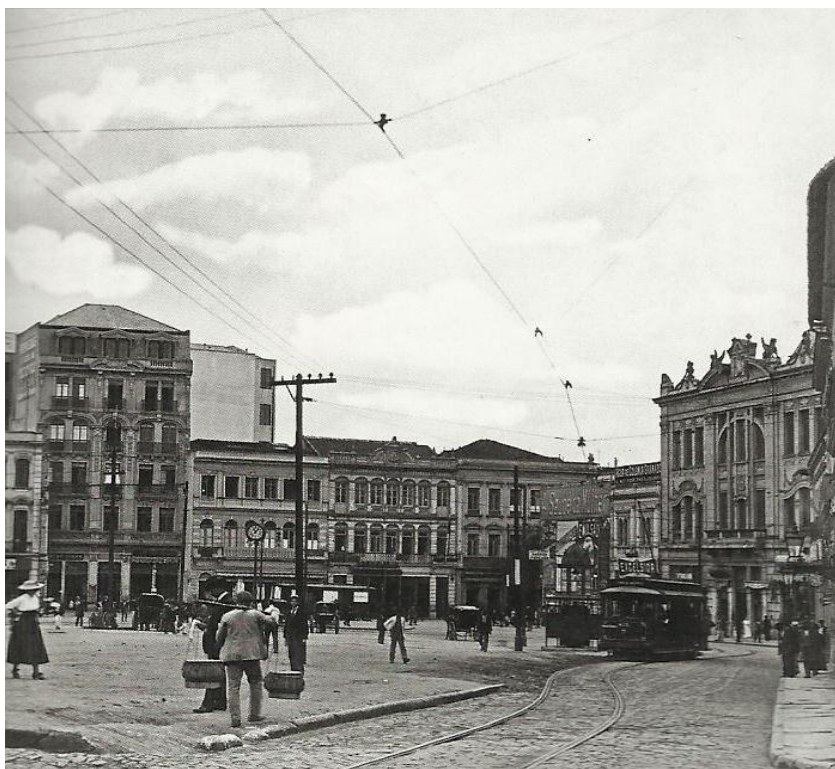
Imagem 9 - Largo da Sé, atualmente ocupado pela Praça da Sé, 1912. (PASTORE, 2009).