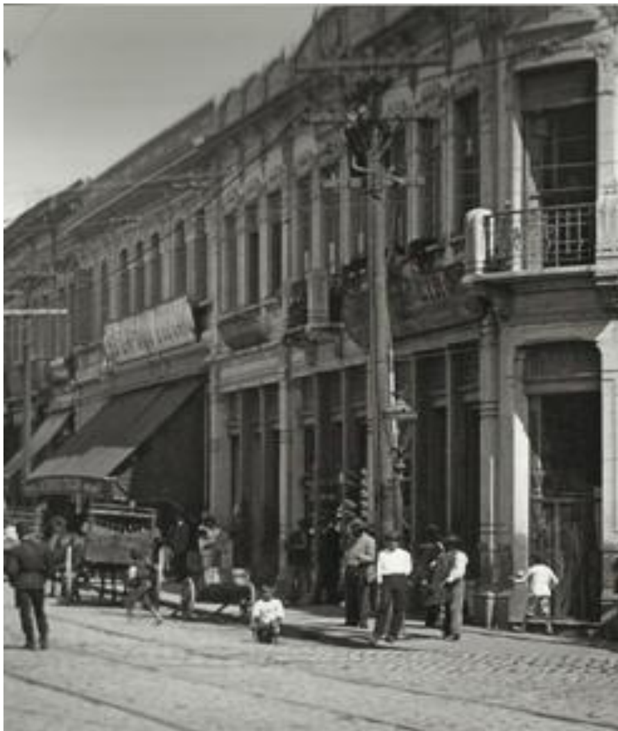
Imagem 2 - ampliada

Encontra-se, nos periódicos do Correio Paulistano, uma significativa quantidade de notícias sobre acidentes e atropelamentos nas ruas de São Paulo: