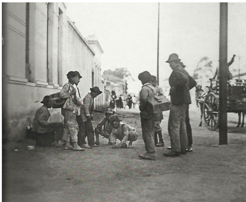
Imagem 14 - Meninos engraxates jogando bola de gude, 1910. (PASTORE, 2009).