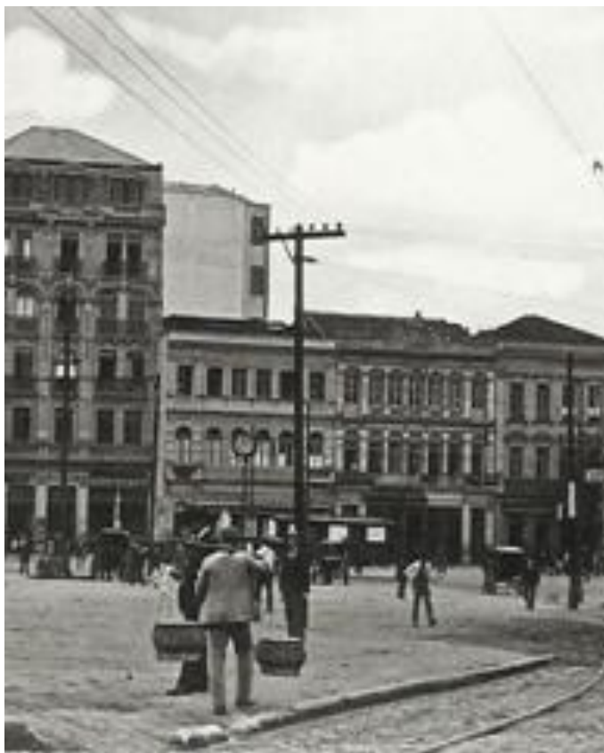
Imagem 9 - ampliada

Na imagem 8, pode-se visualizar o cotidiano do comércio na cidade. Duas mulheres vendedoras de verduras exercem seu ofício, de forma bastante particular, em relação aos outros ambulantes fotografados por Pastore. Elas carregam as caixas de verdura na cabeça, uma habilidade que provavelmente nem todos possuíam. Está presente também na imagem 8 uma mulher com uma bolsa, provavelmente uma criada vindo das compras, atrás dela há ainda um garoto descalço, parado, talvez esperando para fazer algum serviço, como carregar as sacolas de compras de alguém, ou algum outro tipo de serviço que poderia ser prestado próximo ao mercado. Importante considerar também que, diferentemente do século XIX, quando as mulheres parecem ter sido maioria nesse tipo de atividade 44 , no início do século XX, a proporção de homens exercendo a atividade ambulante é maior. Essa percepção da maioria masculina no trabalho ambulante foi possível, graças aos relatos memorialistas, às licenças e às multas envolvendo ambulantes