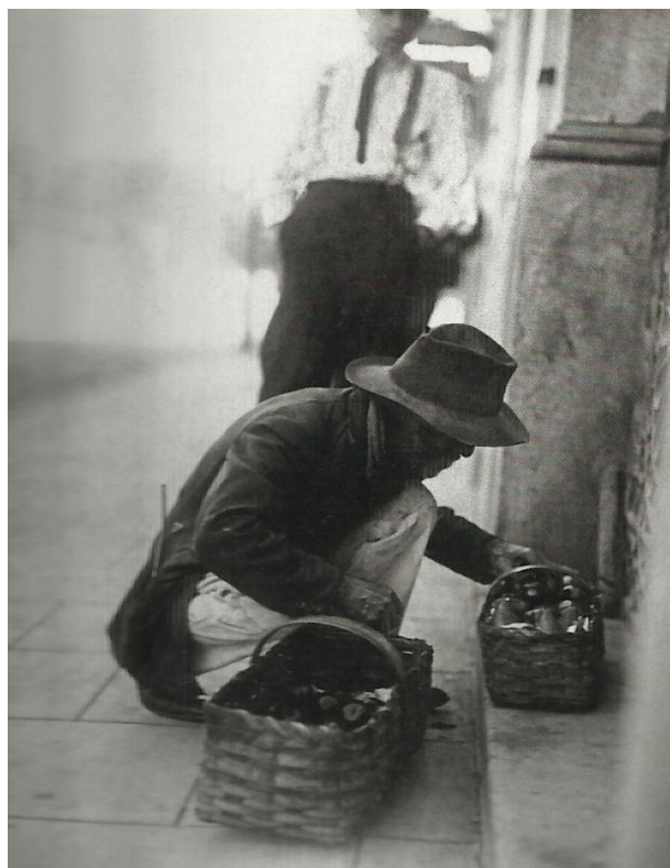
Imagem 5 – Homem arrumando cestas, 1910. (PASTORE, 2009)