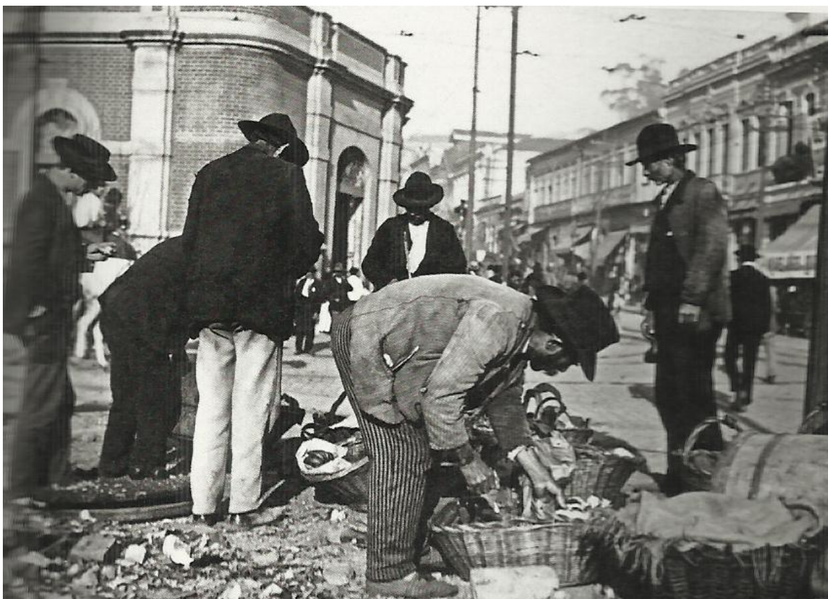
Imagem 3 - Comércio em frente ao Mercado Municipal, 1910.

No relato do viajante, fica nítida a desorganização e a falta de higiene por parte dos comerciantes da Rua das Casinhas. Diferentemente de outros relatos e memórias, Saint-Hilaire teve uma impressão bastante negativa desse local. No entanto, o problema da falta de higiene e da deterioração dos alimentos não estava presente apenas na Rua das Casinhas e apenas no período inicial do XIX. A falta de higiene estava também nos mercados, nos açougues, nas quitandas e nas ruas, com os ambulantes. Pelas fontes pesquisadas, percebe-se que a limpeza não era a preocupação principal entre os comerciantes ambulantes, como se verifica na fotografia abaixo: