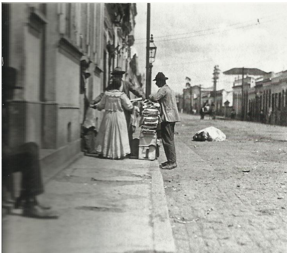
Imagem 12 – Vendedor ambulante de tecidos, 1910. (PASTORE, 2009).

Note-se, mais uma vez, o valor dos vendedores ambulantes como fornecedores de gêneros de primeira necessidade. Até mesmo um sujeito que aparentemente questiona, menospreza a atividade dos ambulantes, admite que sem o trabalho deles, a população teria incômodos, ou seja, legitima certos ramos do comércio ambulante. Mas a insistência de Baruel em proibir alguns negócios dos ambulantes, leva à reflexão sobre o real motivo dessa proposta de proibição, que poderia ser o problema da concorrência com os comerciantes estabelecidos. Provavelmente alguns comerciantes conhecidos de Baruel, lembrando que ele também é um grande comerciante, o procuraram para reclamar dos ambulantes que negociavam os mesmos gêneros que eles, como se pode ver em uma imagem de um vendedor de fazendas, registrada por Pastore: