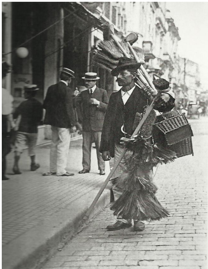
Imagem 17 - Vendedor ambulante de vassouras em rua do centro da cidade - 1910

considerados, no período, melhores que os nacionais 86 . Visualize-se agora um vendedor de vassouras registrado pelo olhar de Pastore: