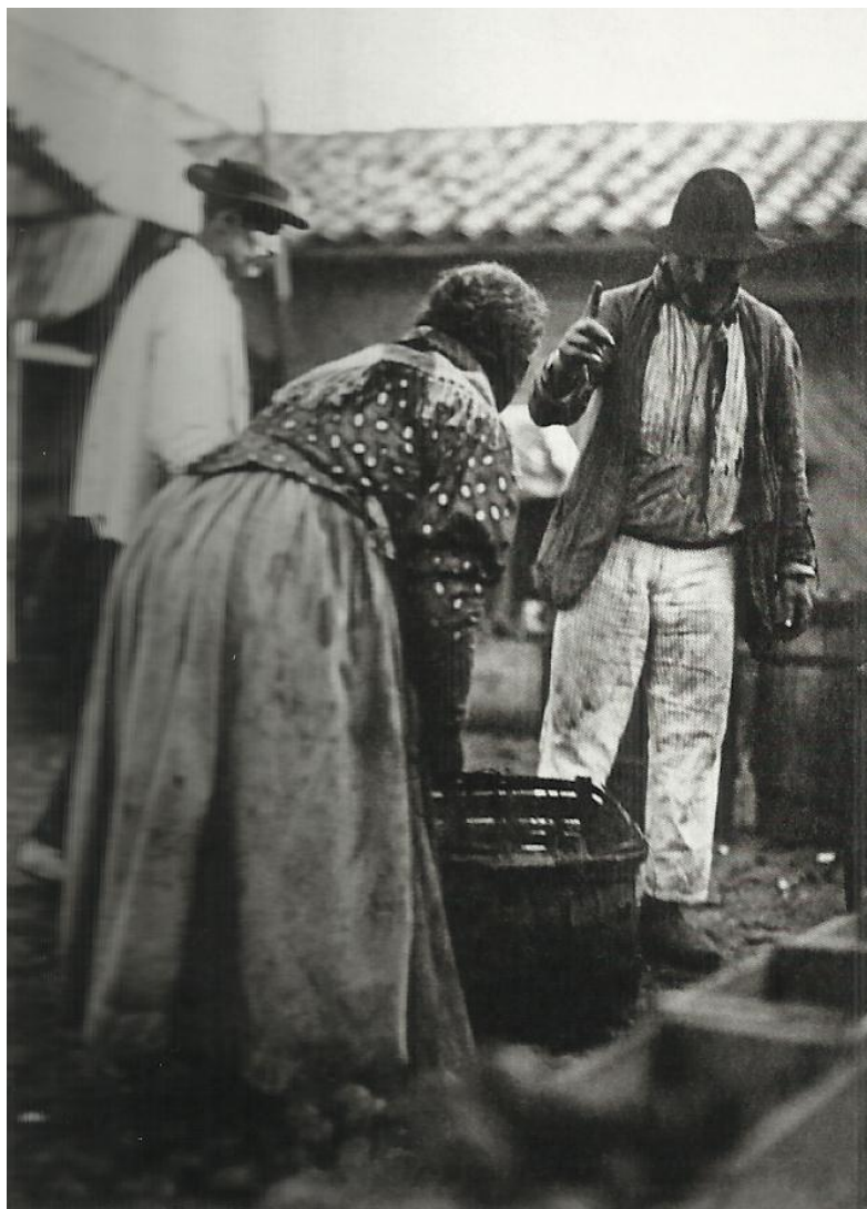
Imagem 4 - Vendedora, provavelmente no mercado dos Caipiras, na esquina das ruas 25 de Março e General Carneiro – 1910. (PASTORE, 2009).

No relatório apresentado à Câmara Municipal, pela Intendência de Polícia e Higiene, no ano de 1896, existia um ato executivo, nº11, através do qual se estabeleciam regras em relação à venda de gêneros alimentícios. A tentativa de retirar os ambulantes das ruas e concentrá-los nos espaços dos mercados reservados à venda de alimentos, se contradiz na própria legislação, como veremos abaixo: