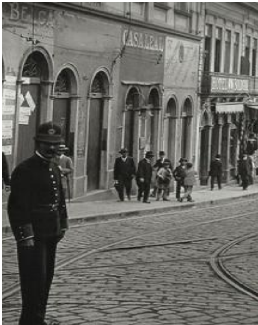
Imagem 1 – ampliada.