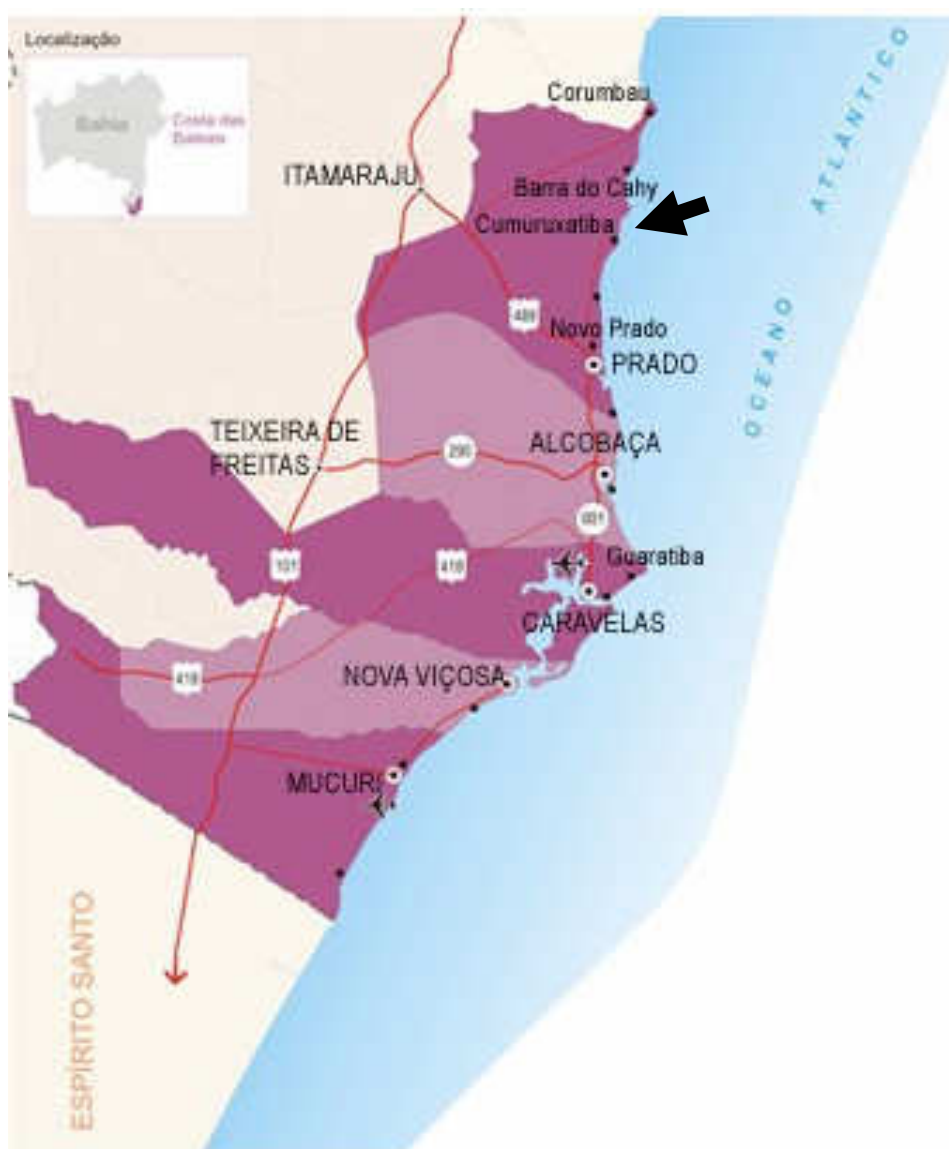
Figura 2: Mapa do extremo-sul da Bahia