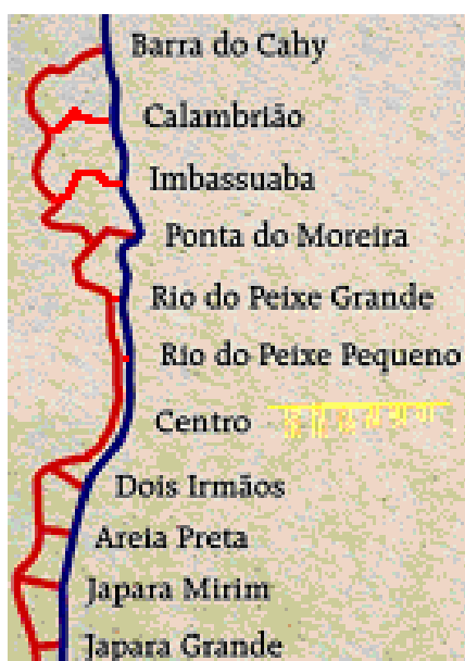
Figura 3: Mapa do litoral:

O estudo limitou-se a uma faixa litorânea de 20 quilômetros, que se estende da Praia da Japara Grande até a Barra do Cahy. Essa região é composta por 11 praias, 7 rios que desembocam no mar, recifes de corais, falésias e um vilarejo típico de pescadores, conforme mapa abaixo.