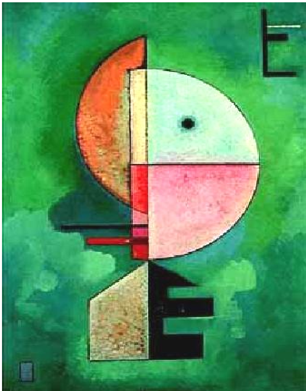
Figura 4 - Wassily Kandinsky –Upwards