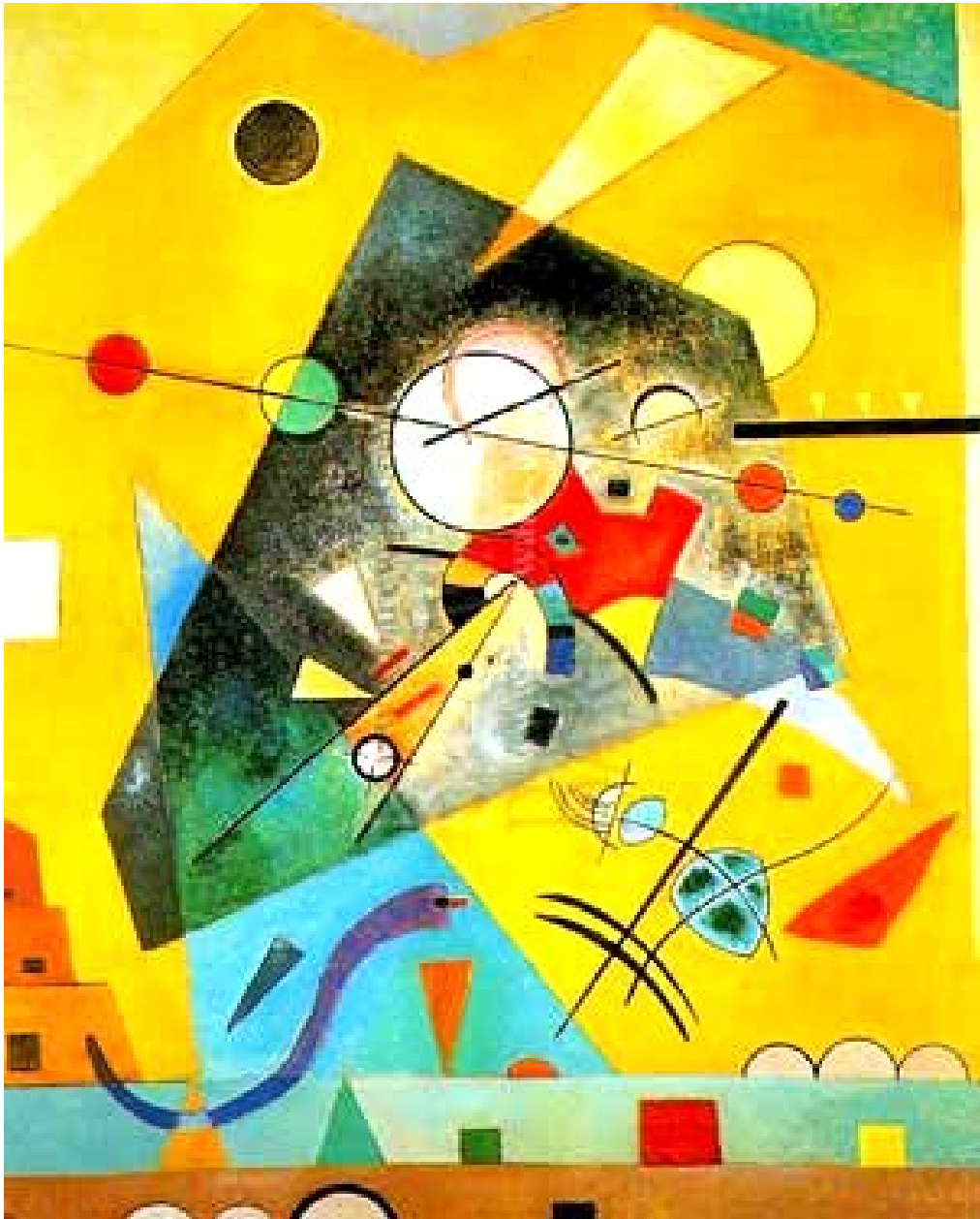
Figura 5 - Wassily Kandinsky

Fonte: http://www.ricci-arte.biz/pt/Wassily-Kandinsky-28.htm