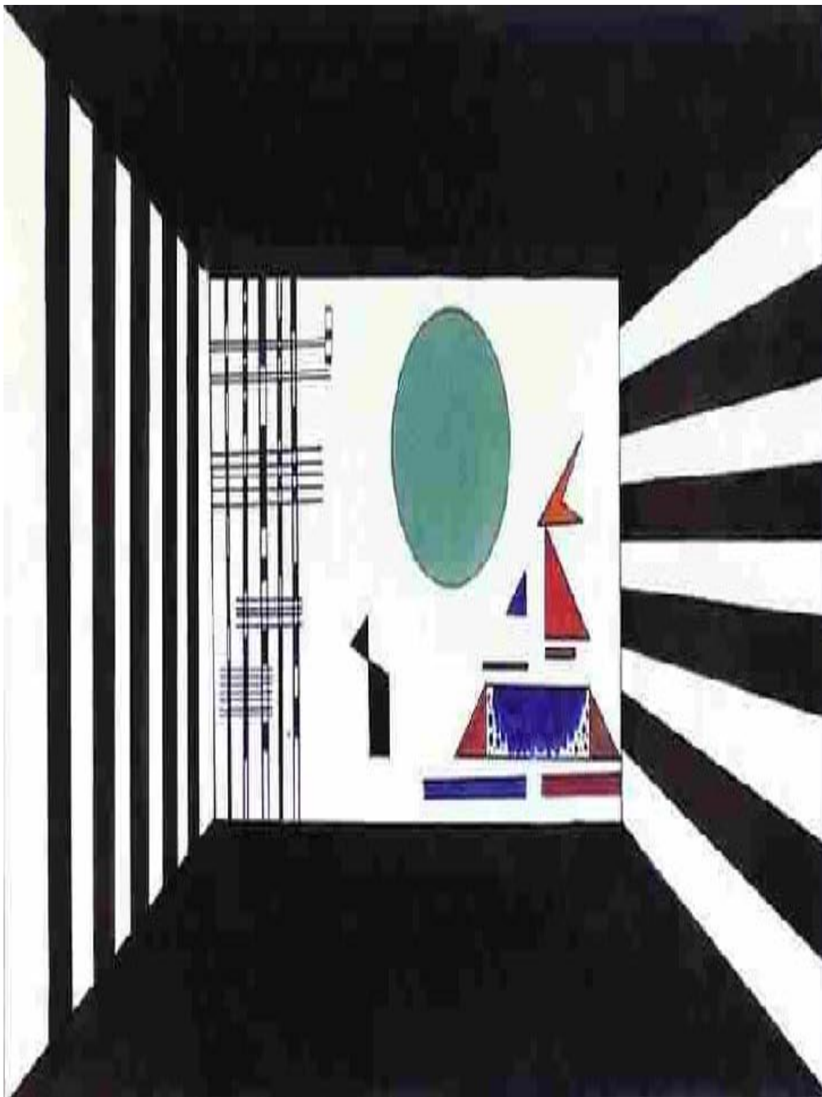
Figura 3 - Wassily Kandinsky