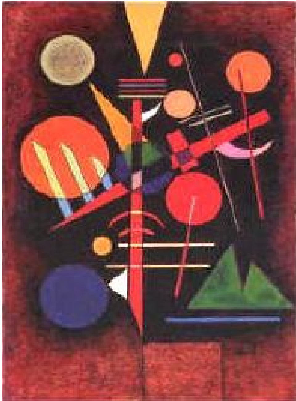
Figura 6 - Wassily Kandinsky