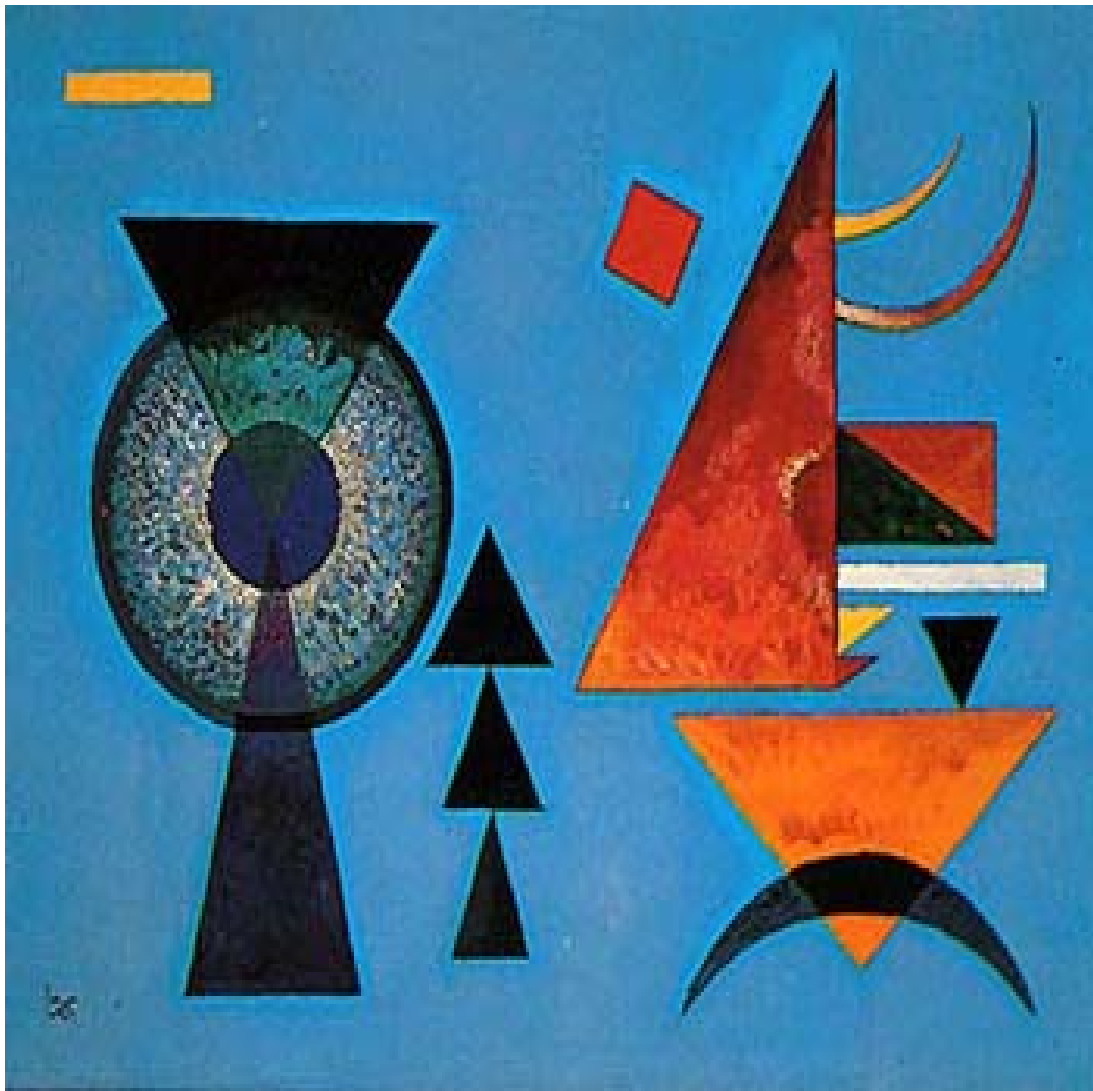
Figura 2 - Wassily Kandinsky – Weiches Hart