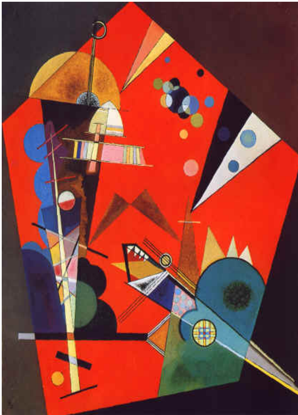
Figura 7 - Wassily Kandinsky